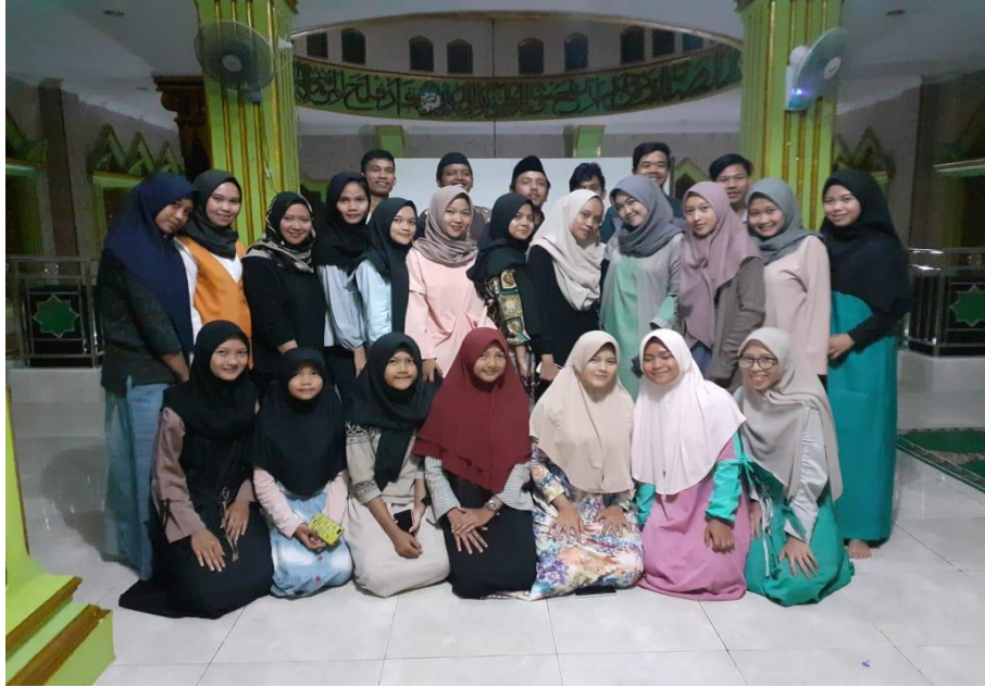
Gambar 4.1.7 Sosialisasi RISMA mengenai materi keorganisasian

dapat lebih memahami materi dan melaksanakan tugas sesuai struktur organisasi.