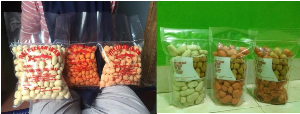
Gambar 4.1.1 Inovasi UKM Peletakan SEHATI Hj.Eli