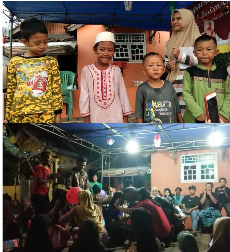
Gambar 4.1.6 Perlombaan saat Peringatan 17 Agustus

berpartisipasi dalam lomba bernyanyi, berpartisipasi dalam lomba fashion show, lomba melepaskan karet dari wajah, hingga malam puncak HUT RI Ke-74.