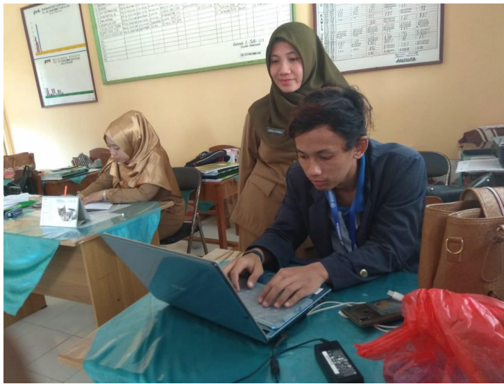
Gambar 4.1.5 Pelatihan Dasar Komputer di MI Al-Khairiyah

Program ini kami lakukan untuk membantu guru di MI Al-Khairiyah untuk lebih mengenal computer dan teknologi yang berkembang saat ini dengan melakukan pelatihan dasar computer dengan mengenalkan perangkat computer dan system operasi seperti Ms.Excel dan Ms.Word sebagai dasar dari system operasi pada computer. Dengan program ini kami berharap dapat memberikan pengetahuan yang bermanfaat pada guru di MI Al-Khairiyah.