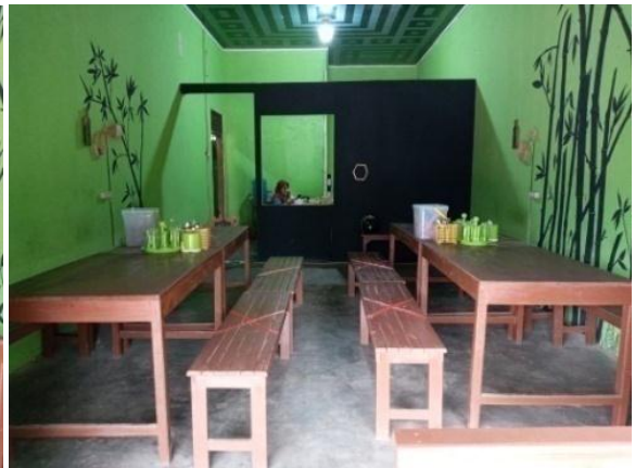
Gambar 2.2 Sesudah