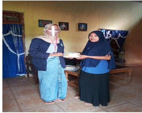
Membagikan APD kepada Masyarakat yang Memiliki UMKM