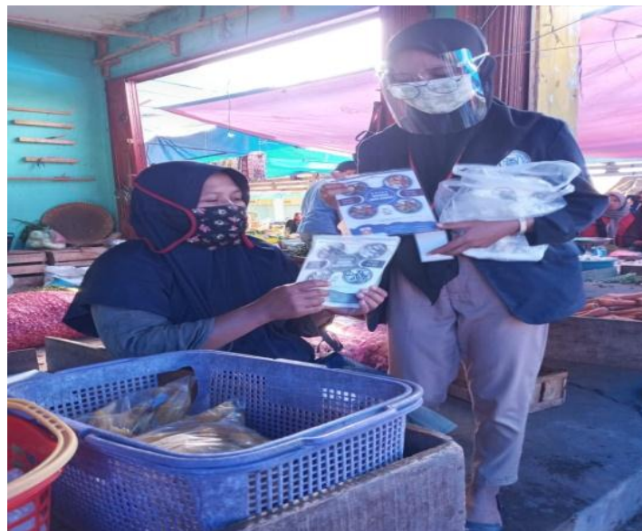
Gambar 2.5 Membagikan brosur Rumah Makan Bakaran Abah Jenggot

Membagikan brosur membutuhkan usaha yang lebih besar daripada yang dibayangkan. menarik perhatian konsumen yang reseptif membutuhkan banyak perencanaan. Tetapi dengan membagikan brosur yang diberi masker dimasa pandemi seperti sekarang tentu sangat berpengaruh daya tarik masyarakat untuk mengetahui lalu membeli makanan di Rumah Makan Bakaran Abah Jenggot.