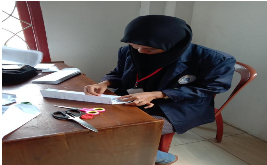
Membantu membuat amplop untuk keperluan administrasi di balai kampung