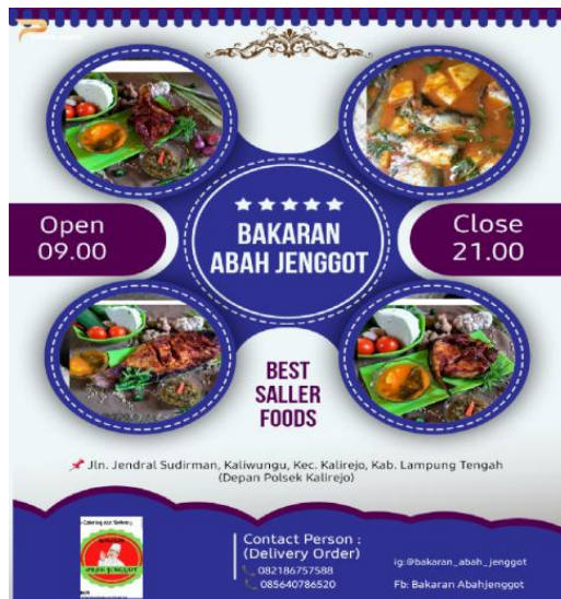
Gambar 2.3 Pamflet

Bisnis kuliner adalah jenis usaha yang akan selalu ada sepanjang masa, alasannya karena makanan merupakan kebutuhan pokok yang tidak bisa lepas dari kehidupan. Melakukan promosi di media sosial maupun offline terbukti ampuh. Bagi pebisnis kekuatan media sosial bisa digunakan untuk melakukan promosi produk karena banyak khalayak yang mampu mengenali juga tertarik untuk mencoba kuliner kita. Apalagi mengingat adanya covid-19 ini media sosial sungguh sangat membantu kelancaran bisnis kuliner ini. Maka dari itu saya ikut membantu dalam mempromosikan Rumah Makan Bakaran Abah Jenggot dengan berbagai cara baik online maupun offline.