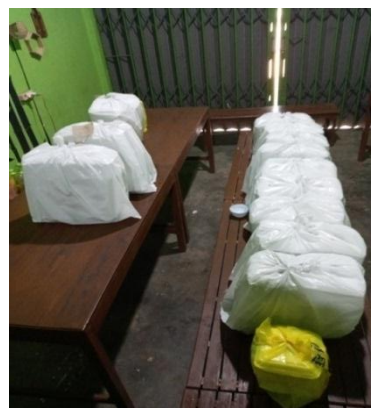
Pengemasan Pesanan Catering Rumah Makan Bakaran Abah Jenggot