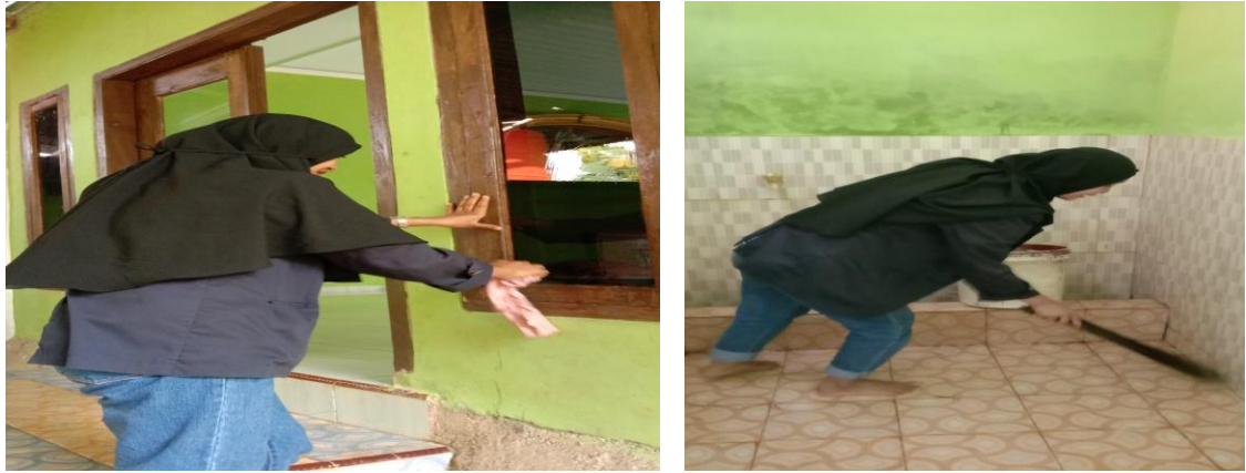
Kegiatan Jumat bersih di masjid Nurul Huda Kaliwungu