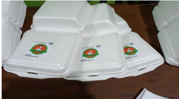
Kemasan Rumah Makan Bakaran Abah Jenggot