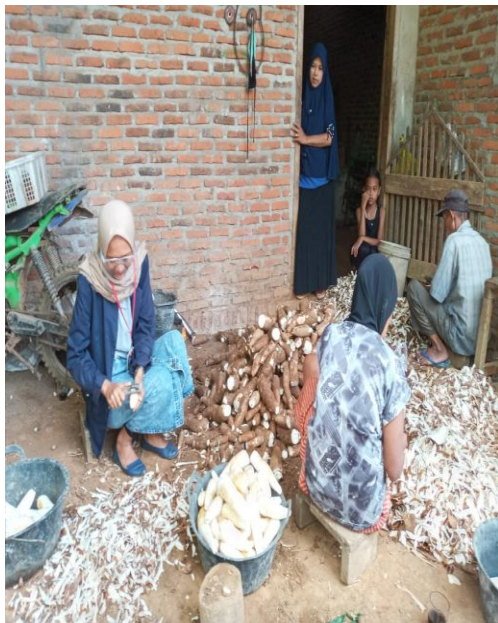
Gambar 2.7 Kerupuk Upik