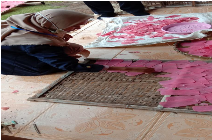
Membantu pemilik UMKM menjemur kerupuk upik