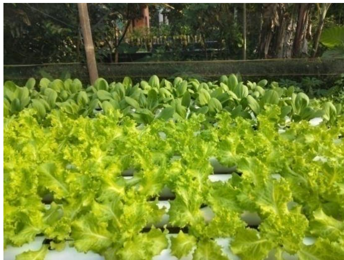
Gambar 2.9 Tanaman Hidroponik