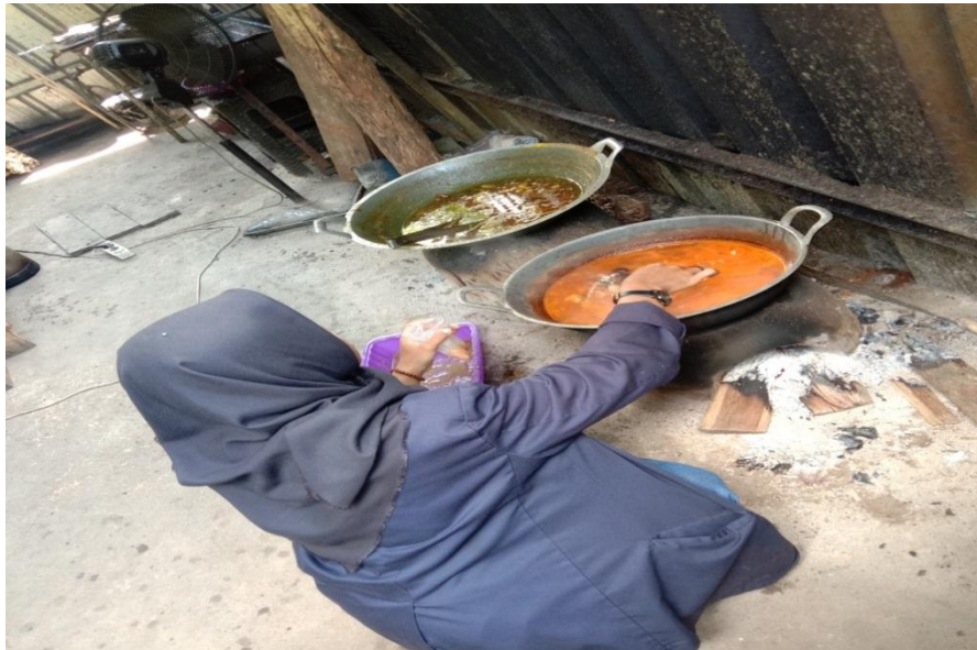
Membantu menyajikan makanan di Rumah Makan Bakaran Abah Jenggot