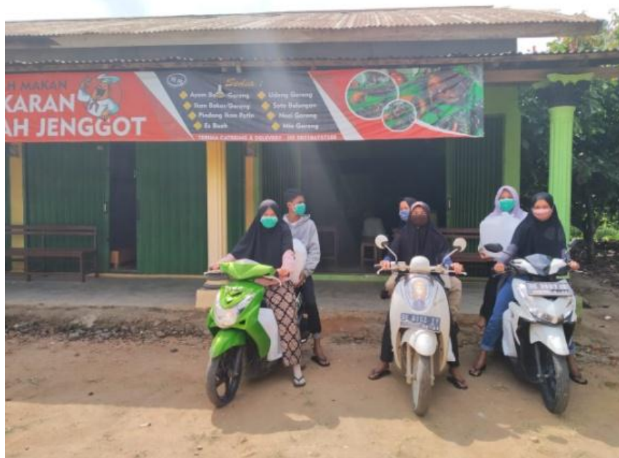
Gambar 2.6 Pengantaran catering ke kalirejo