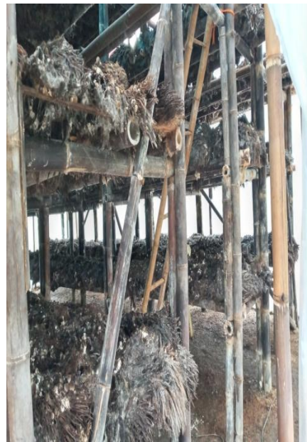
Gambar 2.8 Budidaya Jamur