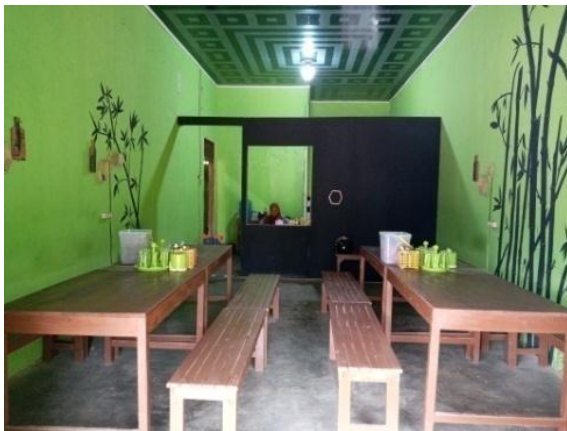
Gambar 2.1 Sebelum

Salah satu fokus masyarakat beraktivitas yang akan mendukung keberlangsungan perekonomian adalah tempat umum. Termasuk rumah makan, restoran dan sejenisnya. Tempat-tempat tersebut berpotensi menjadi lokus peyebaran wabah covid-19. Karena itu, diperlukan penerapan protokol kesehatan dalam pelaksanaan kegiatan di tempat guna mencegah penyebaran covid-19. Karena menteri kesehatan Terawan Agus Putranto menertbitkan keputusan menteri kesehatan nomor HK.01.07/MENKES/382/2020 tentang protokol kesehatan bagi masyarakat di tempat dan fasilitas umum yang di sahkan pada 19 juni 2020. Dengan ini kami membuat dan menerapkan protokol kesehatan di Rumah Makan Bakaran Abah Jenggot.