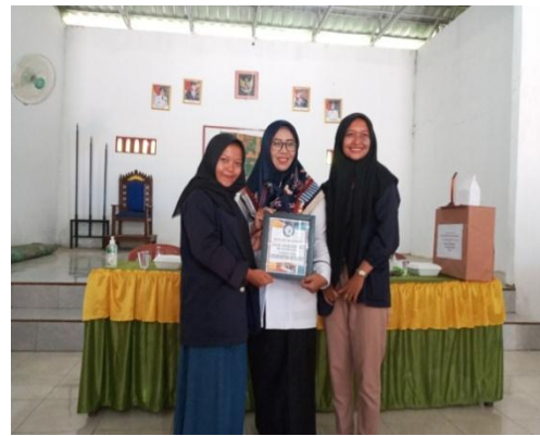
Acara pelepasan atau perpisahan peserta PKPM dan KKN 2020 dan pemberian cinderamata.