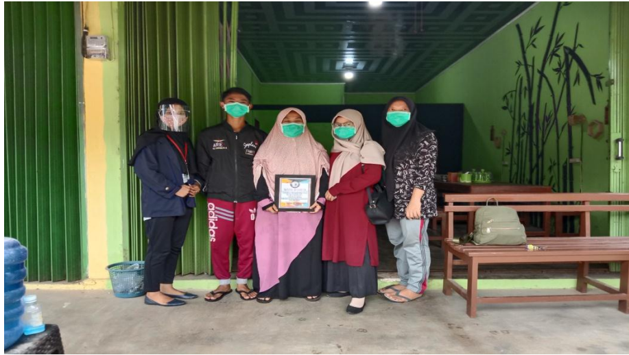
Pemberian cinderamata dan foto bersama pemilik serta karyawan Rumah Makan Bakaran Abah Jenggot