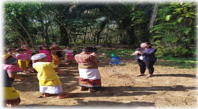
Gambar (b) 2.3.2 Sosialisasi Cara Mencuci tangan