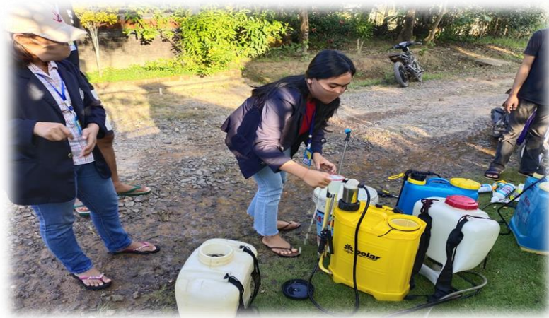
Gambar (a)2.3.3 Pembuatan Disinfektan