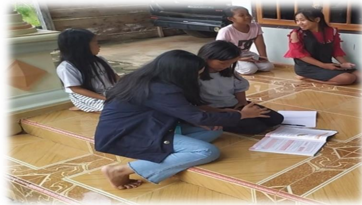
Gambar 2.3.1 Bimbingan belajar siswa SD

dengan beberapa siswa SD serta mengikuti protokol kesehatan yang dianjurkan pemerintah .