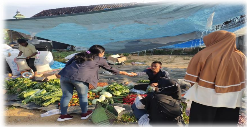
Gambar 2.3.4 Pembagian Masker Di Pasar Desa Kali Deras

berada di luar rumah agar tetap mempertahankan protokol kesehatan di masa pandemi.