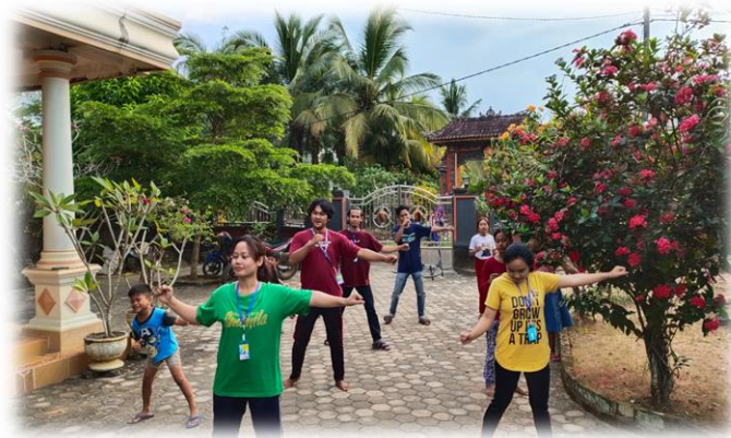
Gambar 2.3.7 Senam Bersama Siswa SD

Kegiatan ini sayai lakukan senam bersama dengan siswa Sd untuk menjaga imunitas anak –anak agar daya tahan tubuh mereka tetap sehat selama masa pandemi covid-19. kegiatan ini dilaksanakan selama 2 kali yaitu pada tanggal pada tanggal 12 agustus 2020 dan 14 Agustus 2020. Denga tetap memperhatikan protokol kesehatan.