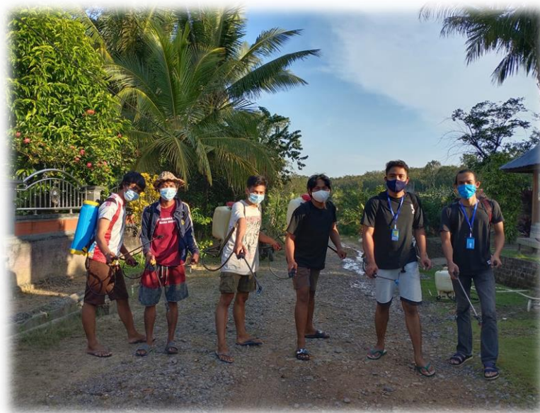
Gambar(b) 2.3.3 Penyemprotan Disinfekta