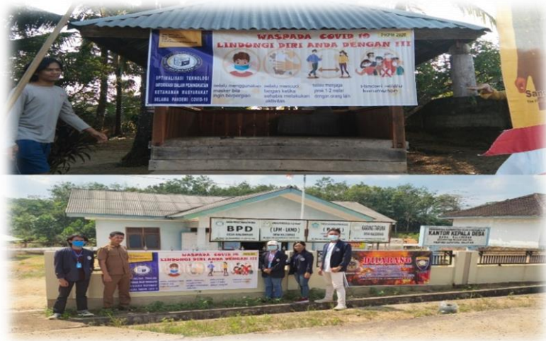
Gambar 2.3.6 Pemasangan Banner Pencegahan Covid-19