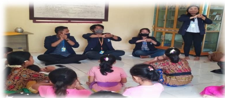
Gambar (a) 2.3.2 Sosialisasi Cara Mencuci tangan

Kegiatan Sosialisasi New Normal dan cuci tangan ini dilaksanakan pada hari minggu tanggal 26 juli 2020 yang dilakukan ditempat Pasraman Hindu di desa kali deres. Dimana kegiatan ini diikuti oleh anak –anak Pasraman Desa kalideres. Dalam kegiatan ini menjelaskan tutorial tentang cara mencuci tangan dengan baik dan benar serta memberikan informasi tentang gejala covid-19 serta memberitahukan agar wajib menggunakan masker ketika berada diluar rumah serta mematuhi protokol kesehatan pemerintah.