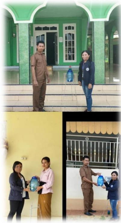
Gambar 2.3.5 Penyerahan dan Pemasangan Tempat Cuci Tangan