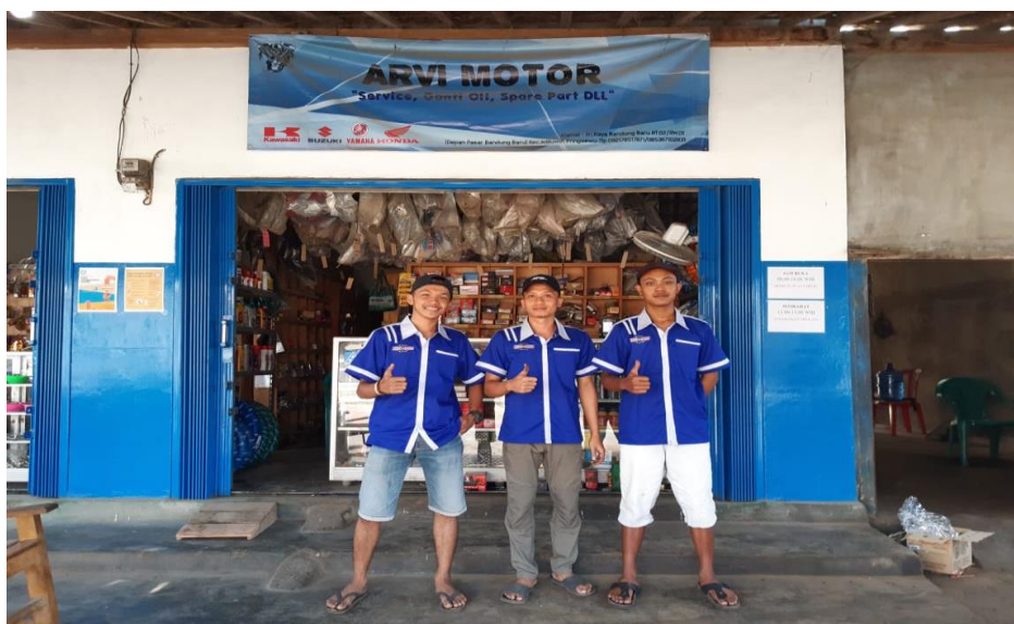
Gambar 3.9. Foto Bersama Pihak UMKM