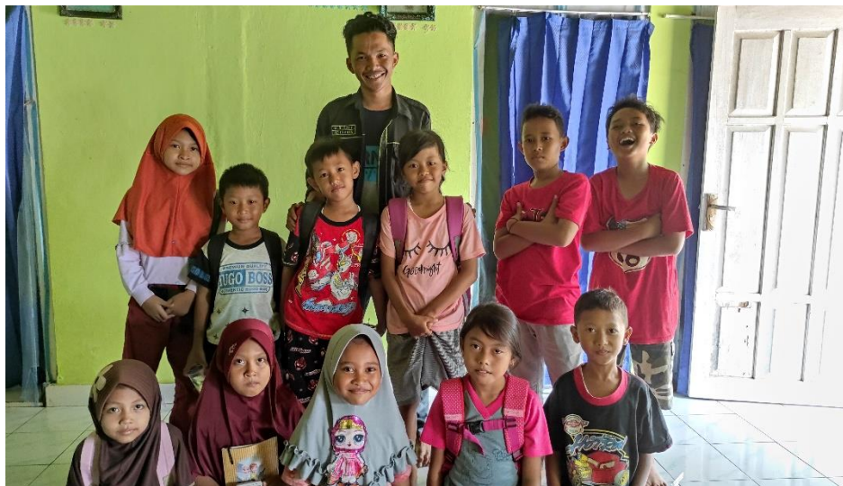
Gambar 3.7. Foto Bersama Adik-adik