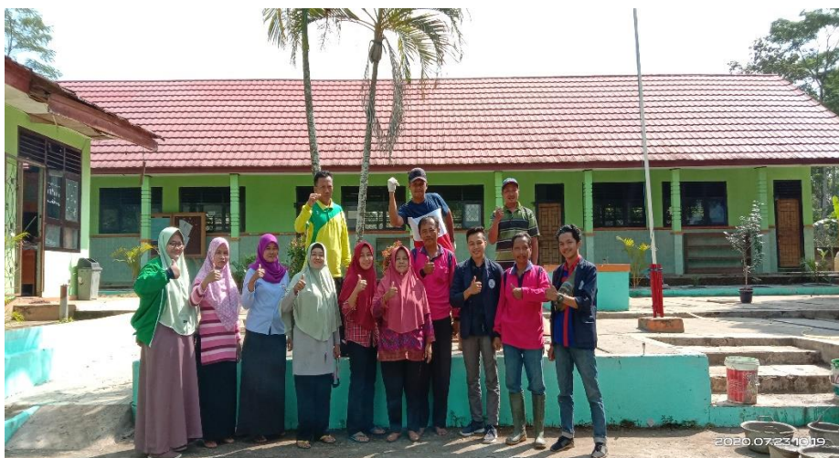
Gambar 3.8. Foto Bersama Guru SDN4 Waringinsari Timur