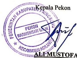
Gambar 3.5. Surat Balas dari Pihak Kelurahan