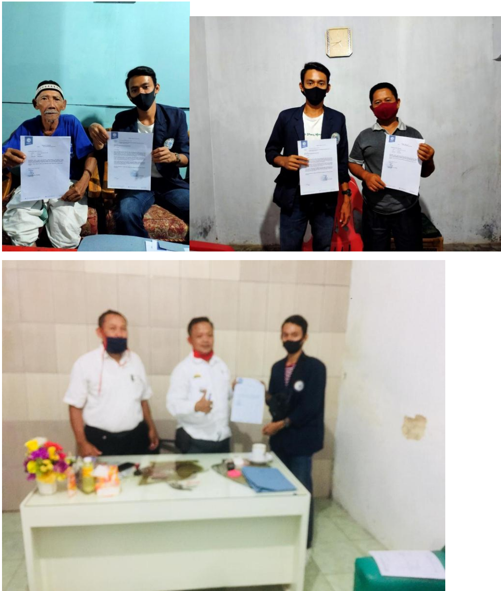
Gambar.1 penyerahan surat tugas