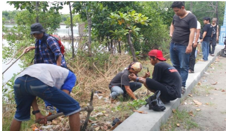
Gambar 2.1 Kerja Bakti di Kelurahan dan Lingkungan RT 003

Dalam rangka meningkatkan kebersihan dan kesehatan lingkungan sekitar di tengah pandemi, kerja bakti sangat dianjurkan untuk dilakukan. Untuk itu, salah satu kegiatan pelaksanaan PKPM adalah kerja bakti di lingkungan sekitar. Selain untuk meningkatkan kebersihan lingkungan sekitar, kerja bakti juga mempererat tali silaturahmi antar warga khususnya RT 003 Desa Karang Pucung.