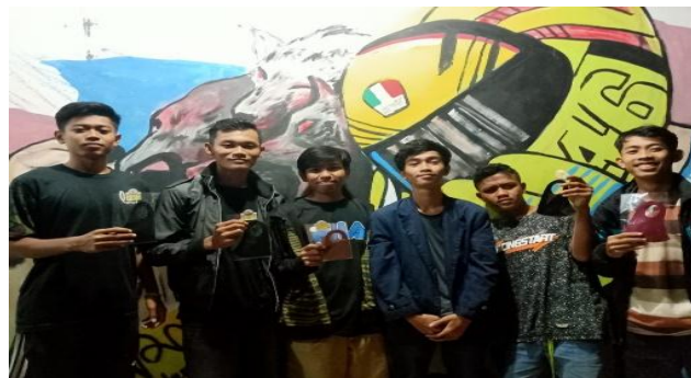
Gambar 2.5 Sosialisasi serta Pembagian Masker

Masker memang bukan jaminan utama untuk mencegah tertular dari penyakit. Akan tetapi, masker efektif dapat menangkal cipratan cairan dari saluran pernapasan, biang penularan virus corona. Oleh karena itu, pada tanggal 31 Juli 2020 kami membagikan ke masyarakat upaya untuk pencegahan tertular dari virus corona.