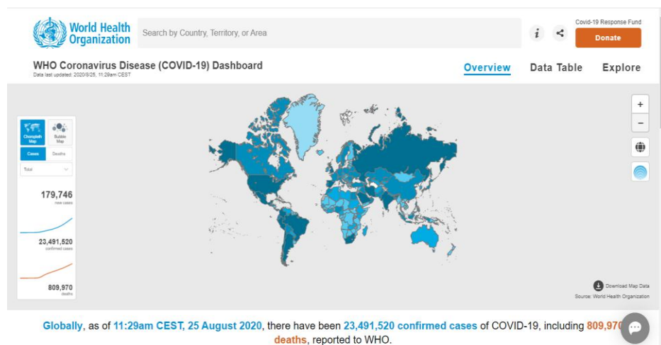
Gambar 1.1 Peta Penyebaran COVID-19

Dalam waktu yang relatif singkat, penyakit ini sudah menyebar di 216 negara dan teritorial di seluruh dunia. Dalam situs resminya, WHO mengemukakan lebih dari 23 juta kasus terkonfirmasi, termasuk kasus meninggal yang mencapai 809.970 kematian terhitung sejak 25 Agustus 2020 di seluruh dunia.