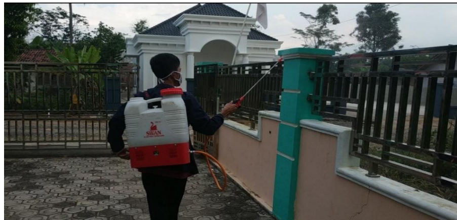
Gambar 2.3 Penyemprotan Desinfektan

Dilakukannya penyemprotan desinfektan disekitar perumahan warga diharapkan dapat membunuh atau meminimalisir penyebaran virus COVID-19. Penyemprotan ini dilakukan di lingkungan RT 003 Desa Karang Pucung, penyemprotan ini juga dilakukan pada tanggal 29 Juli 2020 guna memutus mata rantai dan membuat masyarakat sekitar lebih aman.