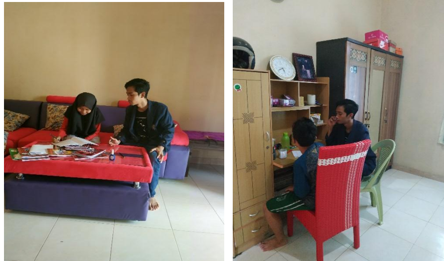
Gambar 2.2 Mendampingi Anak-anak Mengerjakan Tugas Home School