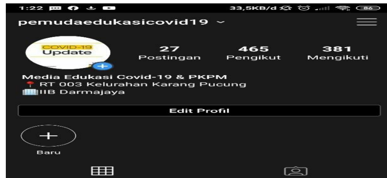
Gambar 2.4 Pembuatan Media Edukasi Online

dengan kesepakatan sasaran program yang mengedukasi pembaca tentang pencegahan dan bahaya pandemi covid-19.