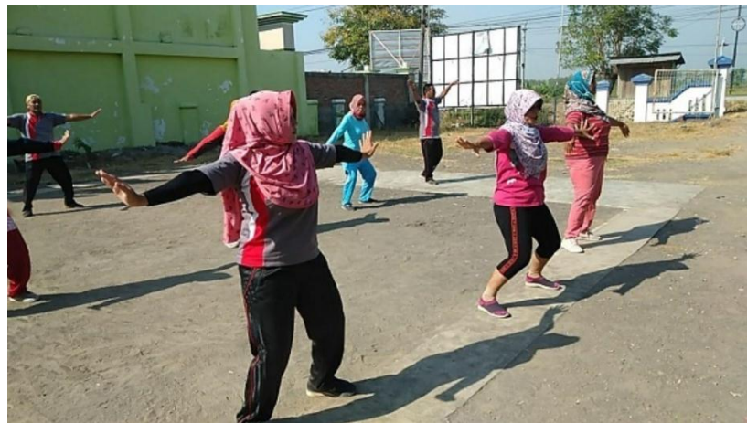
Gambar 2.6 Senam Bersama

mahasiswa hanya sebagai pendamping tapi kegiatan ini sangat di dukung oleh warga setempat pada tanggal 7 Agustus 2020.