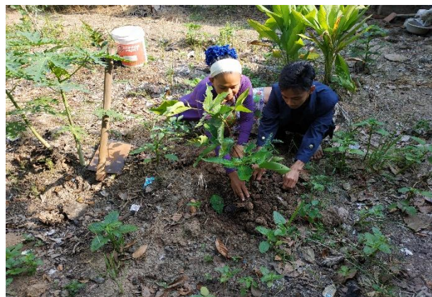
Gambar 2.7 Kegiatan Penghijauan

Penghijauan merupakan satu diantara program dalam bidang lingkungan hidup yang bertujuan untuk mengurangi dampak pemanasan global, memperindah lingkungan sekitar dan dapat dipanen pada waktunya. Selain itu penanaman pohon ini juga kami tanam sebagai kenang-kenangan dari mahasiswa PKPM Darmajaya 2020. Kegiatan ini dilakukan pada tanggal 8 Agustus 2020.