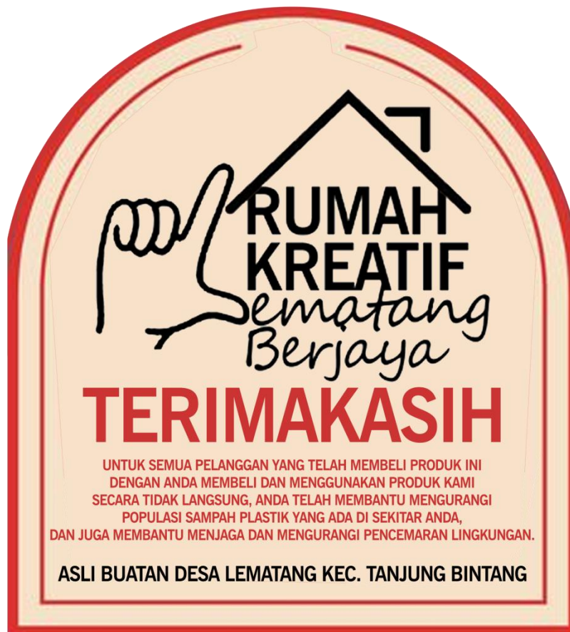
Gambar2.1 Logo Instagram Untuk Memasarkan Produk Kerajinan Tangan