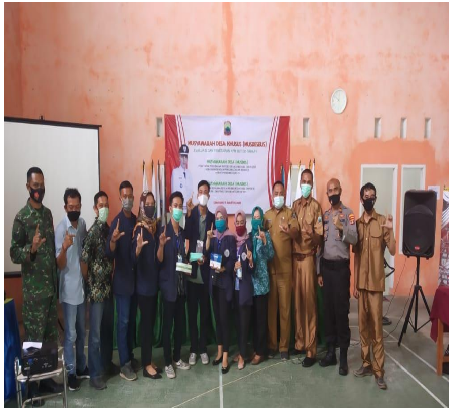
( Pembagian Masker Sekaligus Pamitan Berakhirnya PKPM)