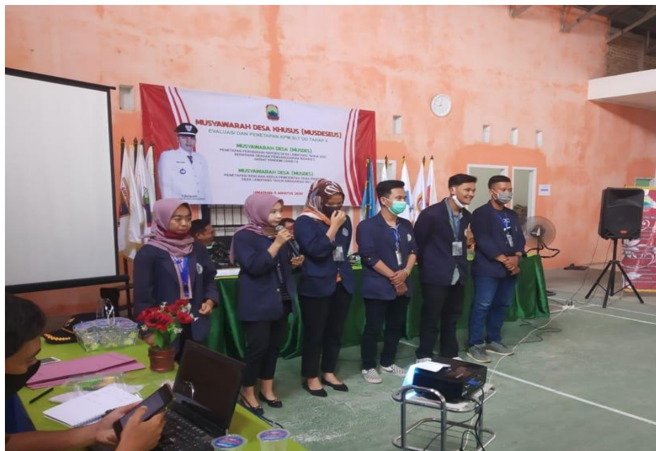
(Pemaparan Hasil Kegiatan UMKM)