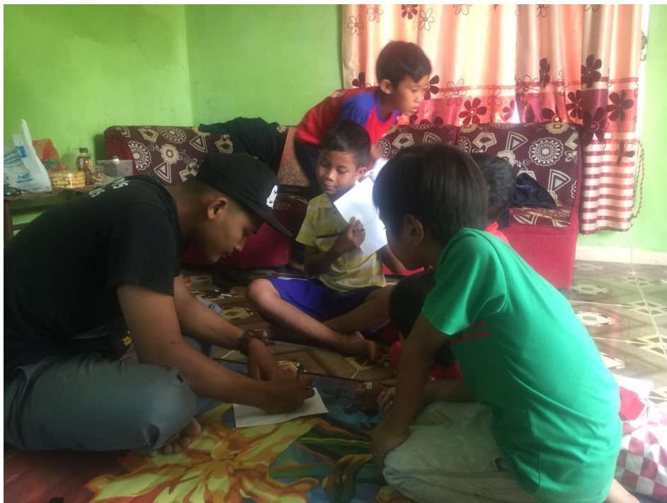
(Melakukan Pendampingan Belajar)