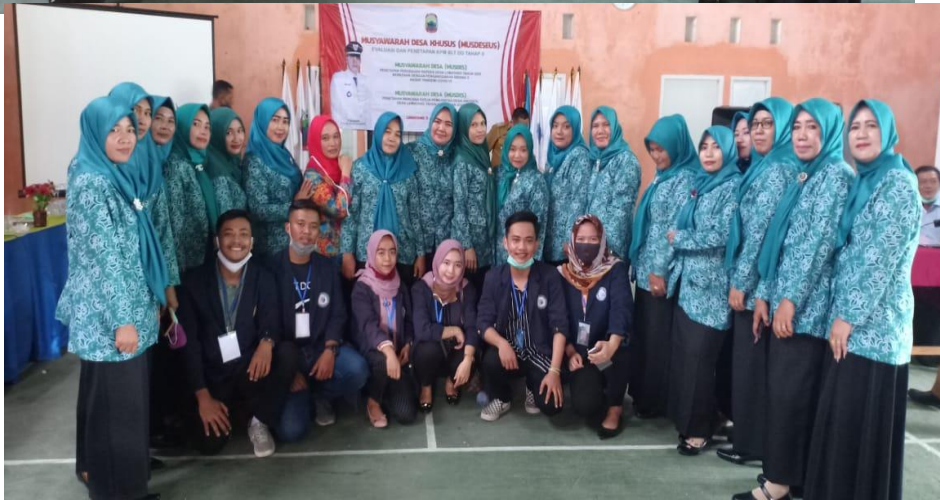
(Bersama Ibu-Ibu PKK Dalam Acara Dibalai Desa)