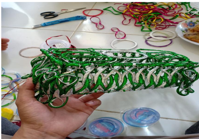
Gambar 2.4 Proses Pembuatan Produk Kerajinan Tangan