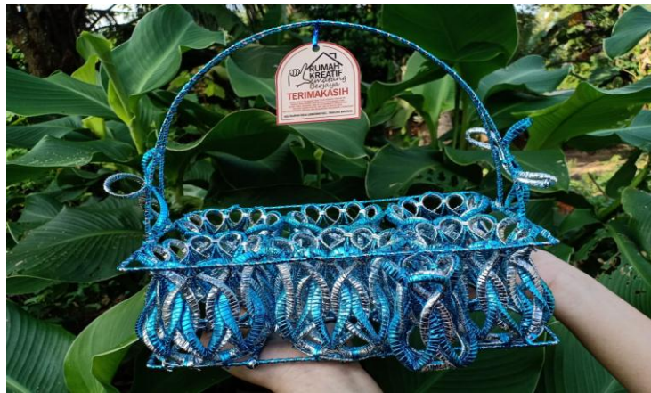
Gambar2.5 Finisshing Produk Dan Logo Kerajinan Tangan