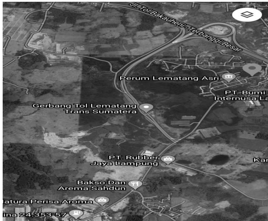
(Denah Lokasi Desa Lematang)