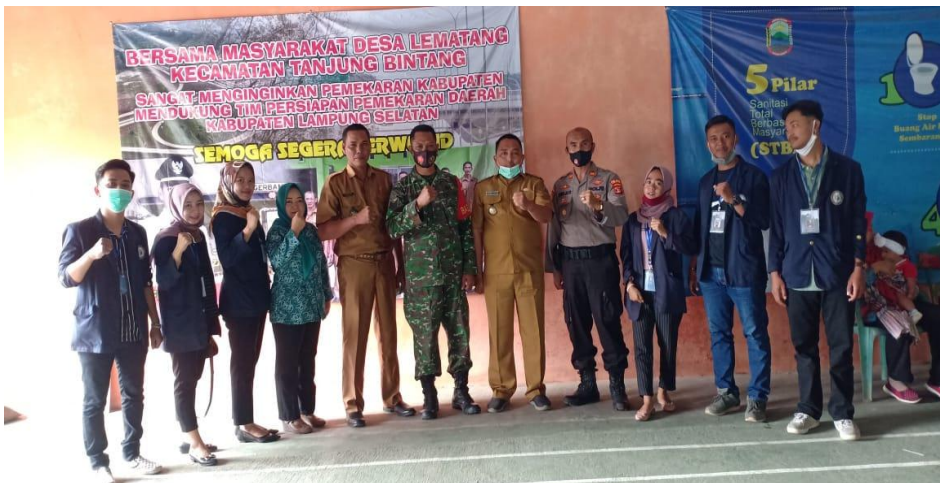
(Bersama Jajaran Dalam Acara Musdes)