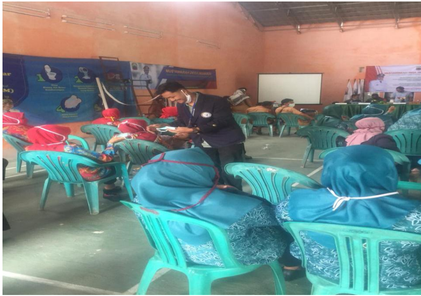
(Kegiatan Musdes Sekaligus Pembagian Masker dan Antis)