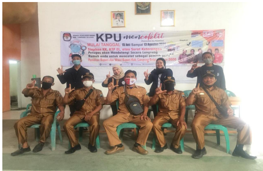
( Penyerahan Mahasiswa PKPM 2020)