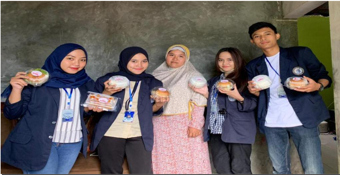
Membantu mengembangkan UMKM dengan Membuatkan brand dan akun sosial media Instagram untuk menambah pangkauan pasarnya