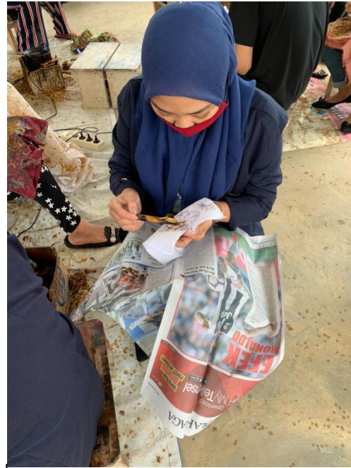
Melakukan Proses Pembuatan Batik Tulis Dari Membuat Pola, Mencanting, Sampai Mewarnai dan membantu memperluas jangkauan pasar dengan cara membuat akun Instagram