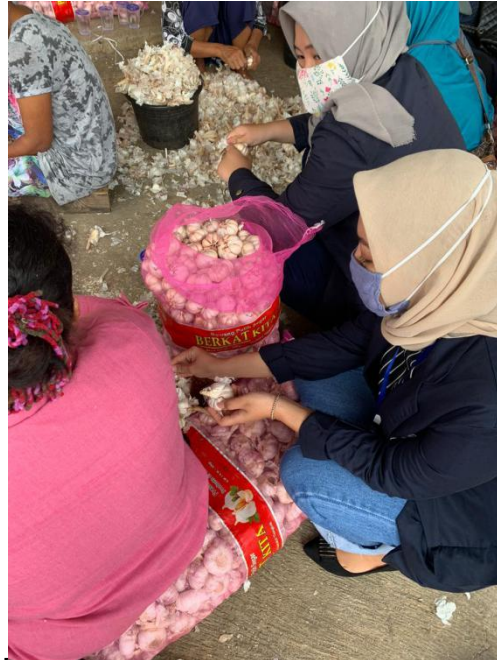
Membantu Proses Pengupasannya Bawang Putih