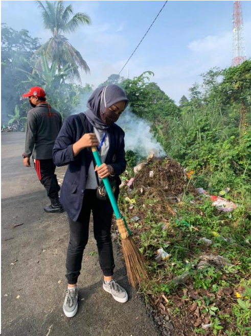
Bersih Bersih Rutin Kelurahan Sukadanaham