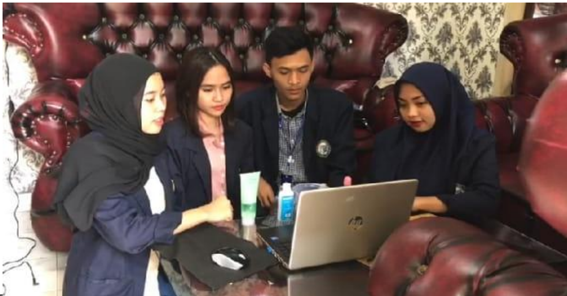
Mengajak dan mengajarkan kaum milenial di daerah kelurahan Sukadanaham untuk membuat handsanitizer menggunakan bahan bahan yang ada dirumah seperti Aloe vera, Alkohol 70%, dan Baby Oil.