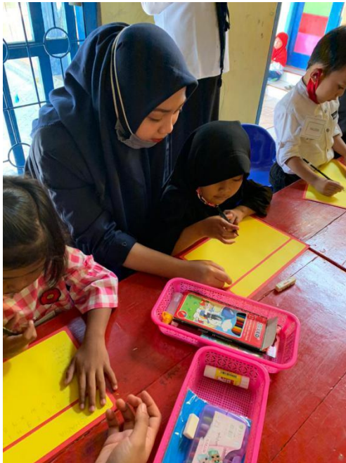
Pendampingan Belajar Pada Murid Paud Kenanga Pratiwi