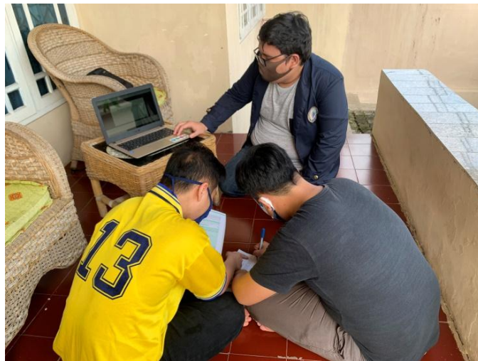
Gambar 7.0 Membuka ruang belajar bagi siswa sekolah yang terdampak Covid-19