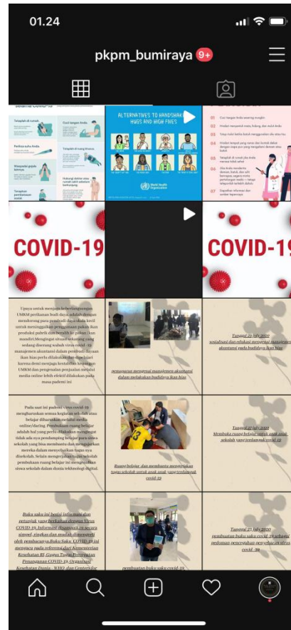
Instagram (social media) PKPM RT.012 Kelurahan Bumi Raya