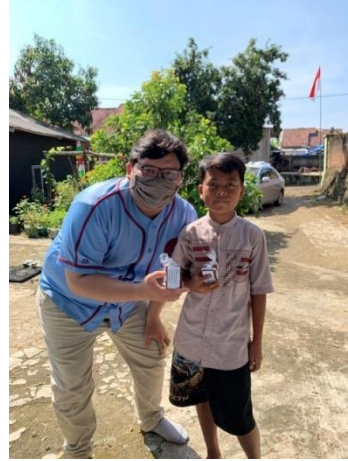
Gambar 6.0 Sosialisasi dan edukasi kepada masyarakat tentang gerakan protein sehat untuk menambah imunitas tubuh di masa pandemic Covid-19