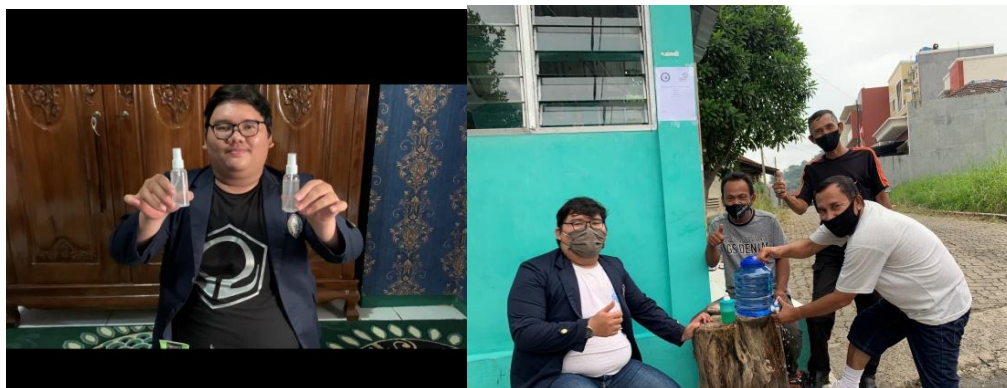
Gambar 5.0 Pembuatan handsanitizer dan pemasangan tempat cuci tangan umum di area sekitar lingkungan RT.012 Kelurahan Bumi Raya