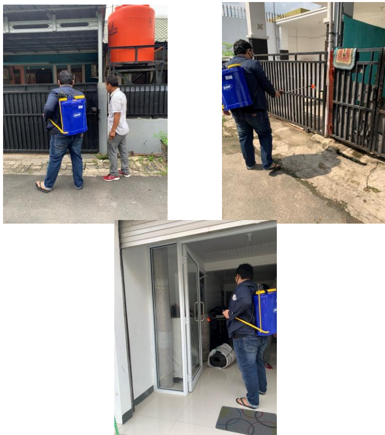
Gambar 2.0 Penyemprotan Disinfektan di lingkungan sekitar RT.012 Kelurahan Bumi Raya