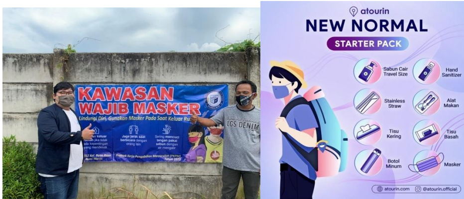
Gambar 4.0 Pemasangan banner bertuliskan “kawasan wajib masker” di lingkungan sekitar RT.012 Kelurahan Bumi Raya