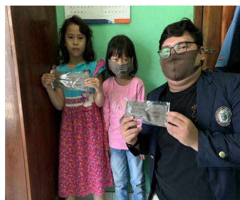
Gambar 1.0 Penyuluhan tentang Covid-19 secara daring kepada masyarakat sekitar dan pembagian masker