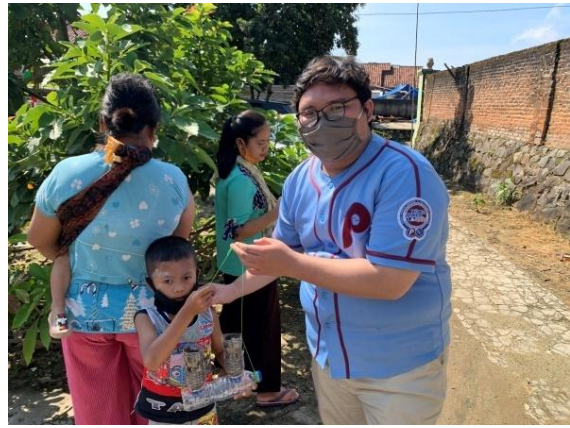
Gambar 10.0 Sosialisasi pemanfaatan sumberdaya alam serta pengembangan ekonomi kreatif dalam penanaman cabai dan pakcoi dimasa pandemic Covid-19