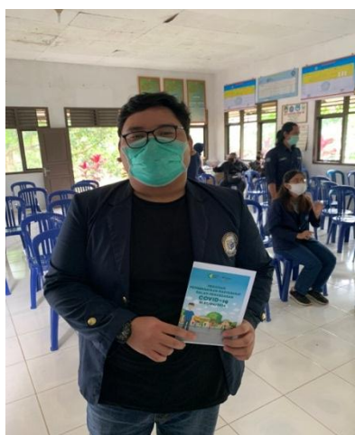
Gambar 3.0 Pembuatan dan pembagian buku saku Covid-19