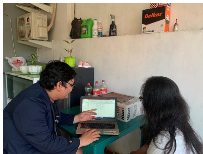
Gambar 9.0 Sosialisasi tentang pembuatan laporan keuangan sederhana kepada UMKM