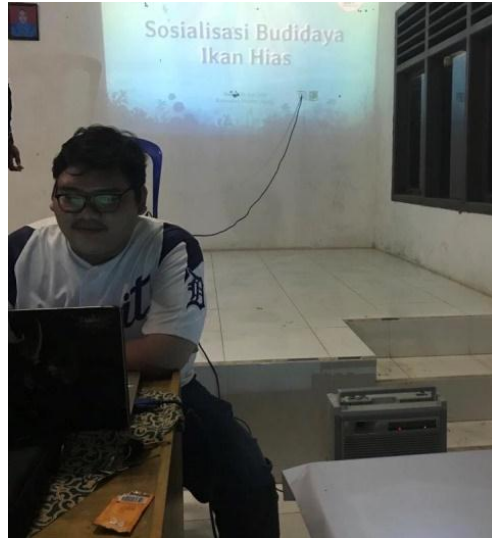
Gambar 8.0 Melakukan edukasi tentang manajemen akuntansi dalam pembudidayaan ikan hias sebagai industry ekonomi kreatif dimasa pandemic Covid-19