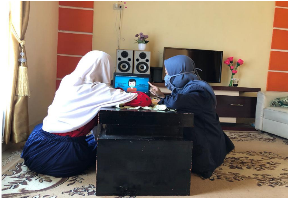
Gambar 2.7 Melakukan pendampingan kepada siswa yang sedang melakukan pembelajaran online

Memperkenalkan siswa tentang aplikasi yang menunjang mereka belajar online seperti zoom yang berguna ketika guru ingin berdiskusi langsung secara tatap muka kepada siswanya.