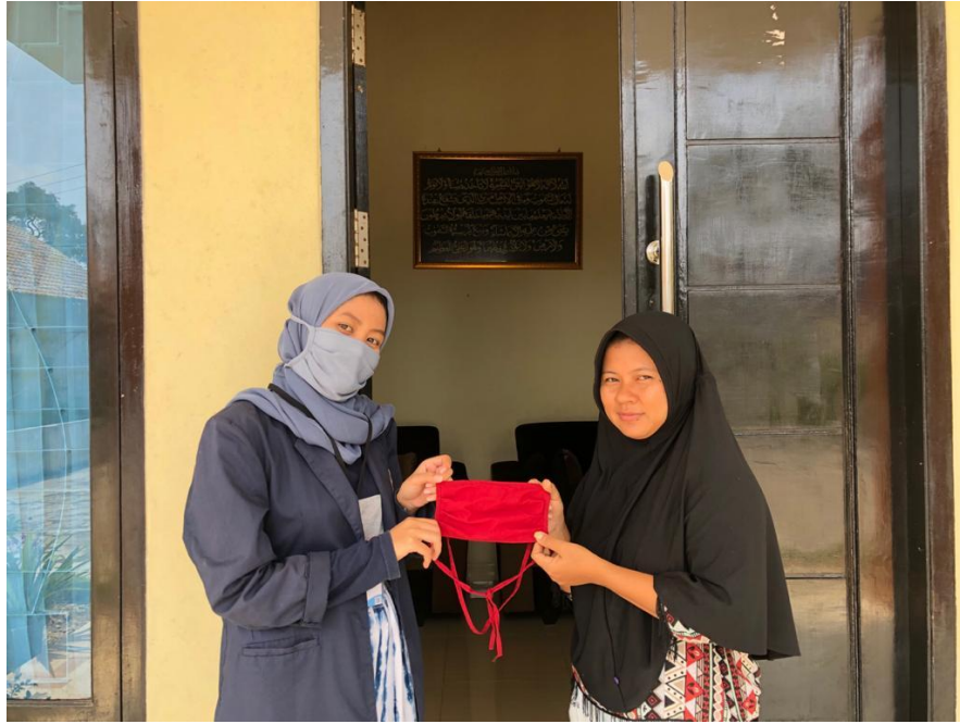
Gambar 3.1 membagikan masker kepada masyarakat sekitar.