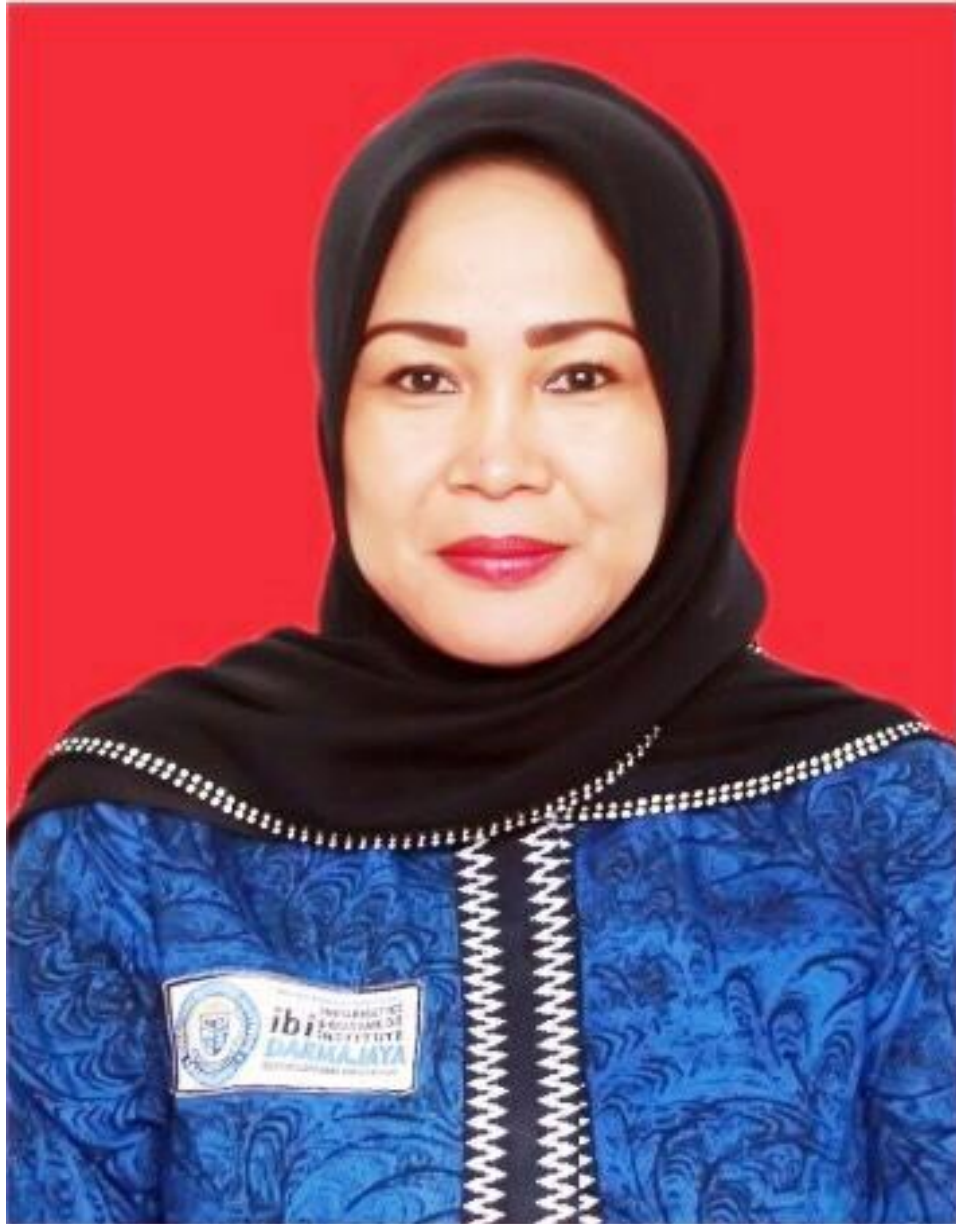
Zuriana, S.E., M.M