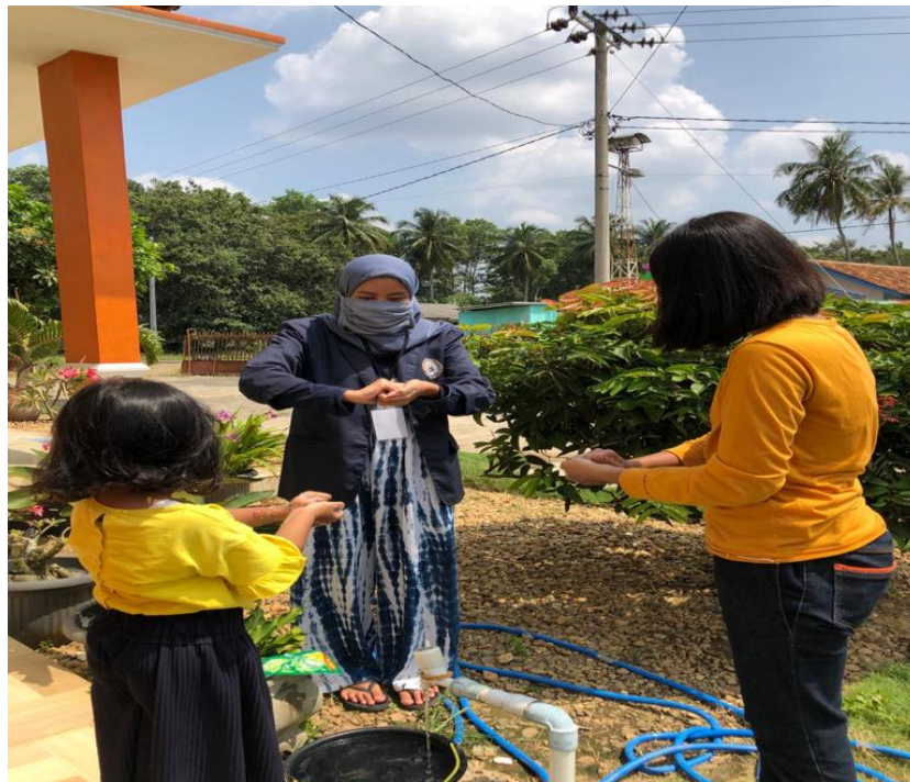
Gambar 2.8 cara mencuci tangan yang benar menurut WHO.