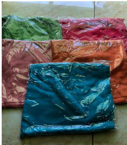
Gambar 2.5 sebelum dikasih merk dagang pada produk

Supaya lebih menarik dan meningkatkan efisiensi beli konsumen, penggunaan merk juga akan memudahkan pembeli mengingat produk kita, dan itu merupakan cara efektif dan efisien untuk menarik perhatian konsumen atas suatu produk kita dan memberikan keuntungan lebih.