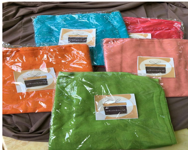
Gambar 2.2 sesudah inovasi produk