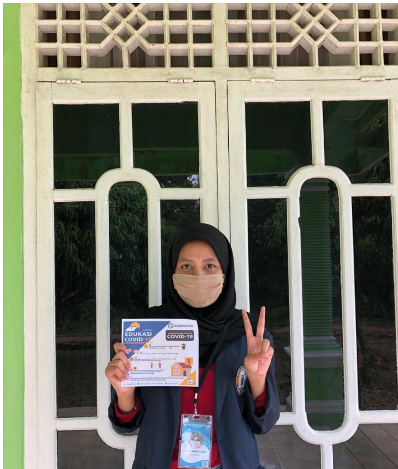
Gambar 2.9 membagikan brosur kepada masyarakat sekitar.

Saya juga membagikan masker, karena sampai saat ini masih ada saja masyarakat yang keluar rumah tapi tidak menggunakan masker, serta memberi tahu kepada masyarakat sekitar tentang cara mencuci tangan yang baik dan benar menurut WHO.