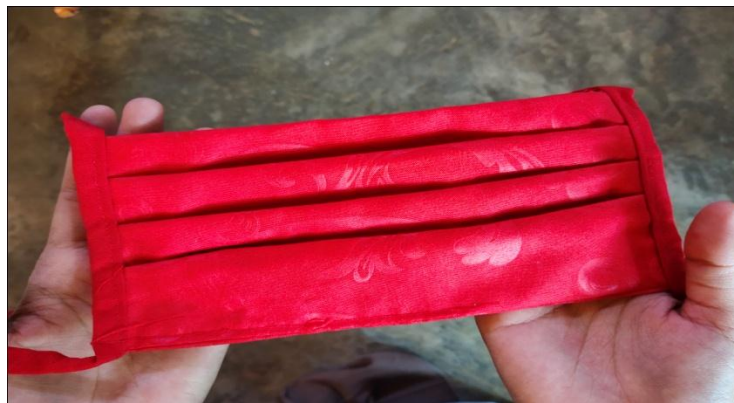
Gambar 2.1 sebelum inovasi produk

Sebelumnya, hasil kerajinan kain perca hanya di buat masker, spreii, keset dan lap saja kemudian saya memberikan ide untuk berinovasi untuk membuat produk yang lain yaitu seperti jilbab.