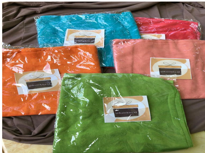
Gambar 2.6 sesudah dikasih merk dagang pada produk