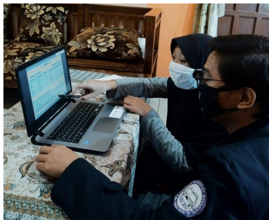
Proses saat membantu anak anak dalam daring.