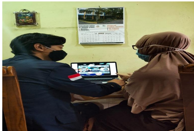
Gambar 2.1 Edukasi pentingnya inovasi produk