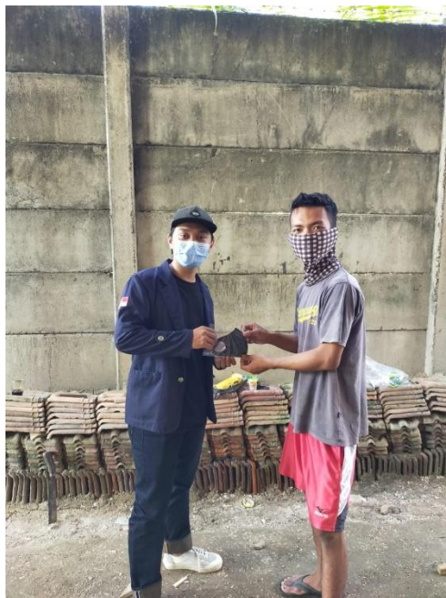
Saat pembagian masker kepada masyarakat Desa Branti Raya