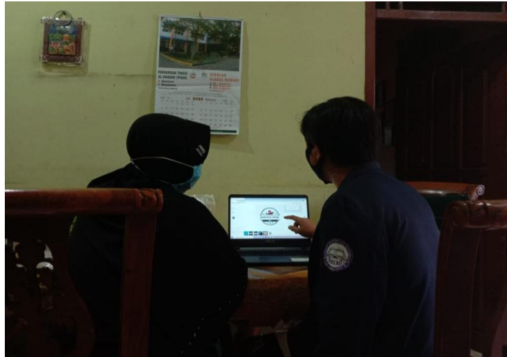
Gambar 2.2 Saat proses edukasi tentang pentingnya logo bagi suatu produk