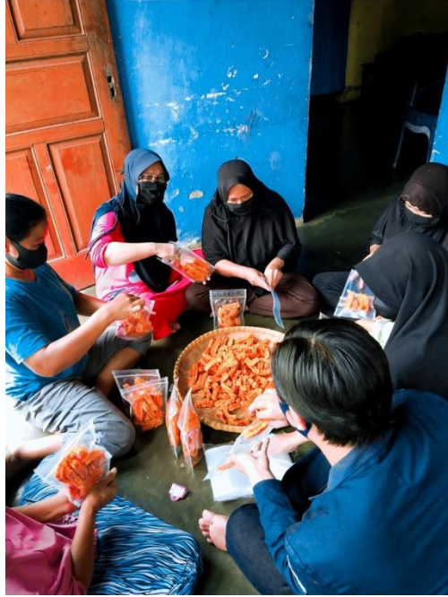
Foto bersama UMKM Kerupuk Civir