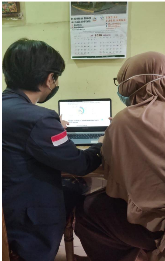
Gambar 2.4 Edukasi pemanfaatan e-commerce dalam sektor pemasaran dan penjualan.