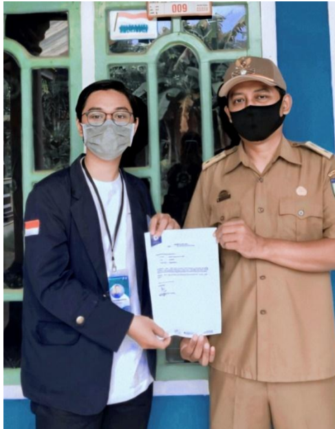
Foto bersama perangkat Desa Branti Raya