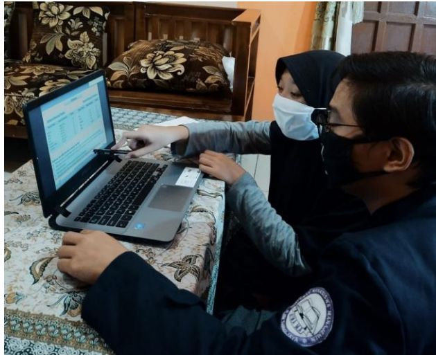
Gambar 2.6 Kegiatan saat mendampingi pembelajaran daring