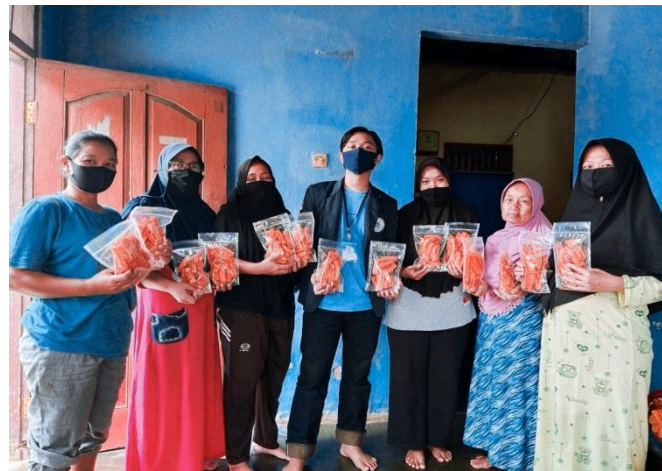
Foto bersama UMKM Kerupuk Civir