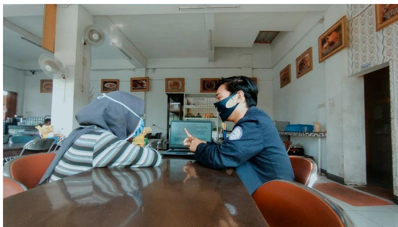
Gambar 2.7 Edukasi mengenai penerapan protokol kesehatan di RM Sate Kambing Muda