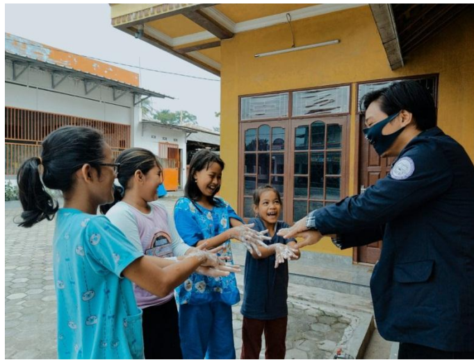
Gambar 2.5 Edukasi pentingnya penerapan hidup bersih dimasa pandemi Covid-19