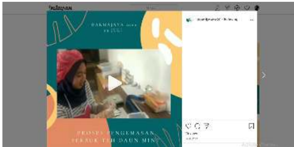
Gambar 22. Proses Pengemasan Serbuk Teh Daun Mint