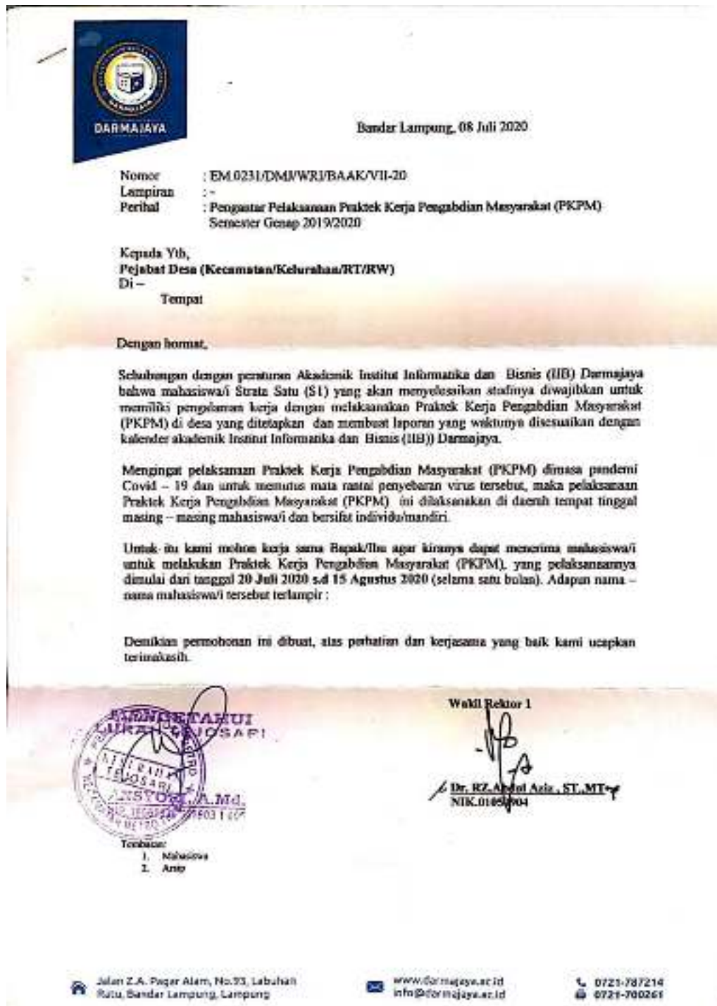
Gambar 18. Surat Pengantar yang Telah Dilegalisir oleh Pihak Kelurahan