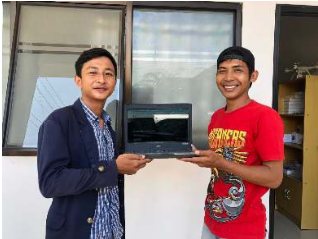
Gambar 25. Pelepasan Bersama Pihak UMKM sekaligus penyerahan Web Informasi