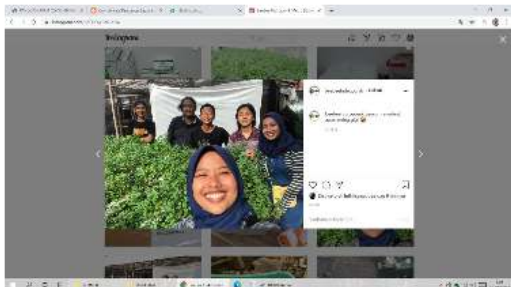
Gambar 20. Sesi Dokumentasi dengan Pihak UMKM Hidroponik