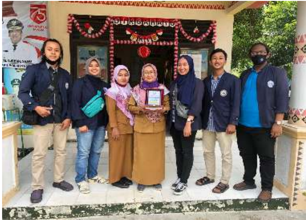
Gambar 23. Pelepasan Kegiatan PKPM Bersama Pihak Kelurahan Tejosari