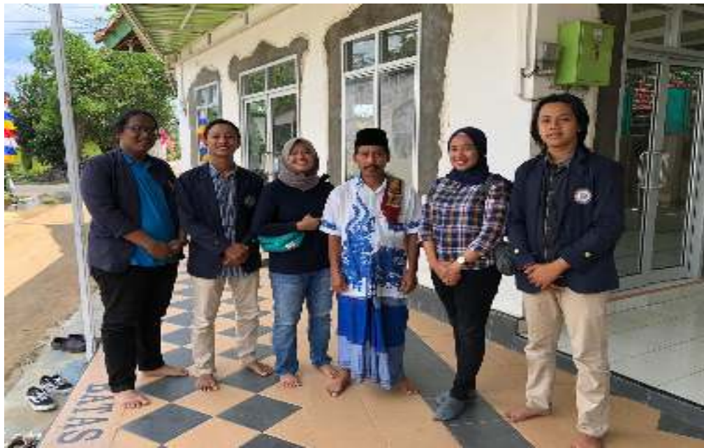
Gambar 24. Pelepasan Kegiatan PKPM Bersama Ketua RT. 017 Kelurahan Tejosari