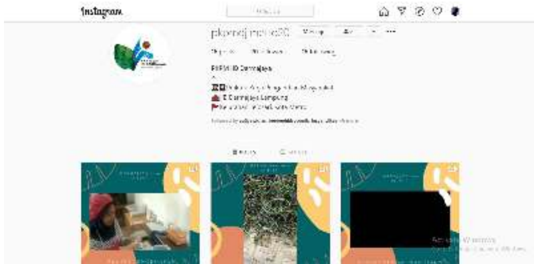
Gambar 21. Tampilan Sosial Media Instagram PKPM IHB Darmajaya