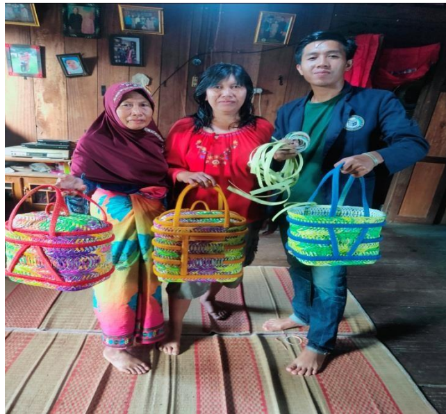
Gambar 2.2 Proses Produksi Tas

Kunjungan kegiatan dan proses produksi UMKM di laksanakan pada 31 juli 2020 jam 10.00 di kediaman rumah ibu handay kegiatan yang di lakukan adalah wawancara.