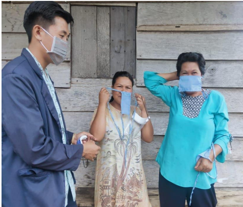
Gambar 2.6 Pembagian Masker kepada masyarakat di Desa