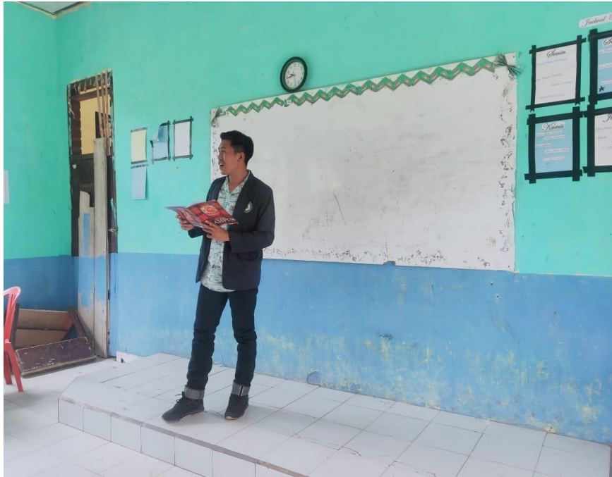
Gambar 2.4 Pendampingan Bimbingan Belajar anak-anak SD Desa Gn. Batu

Pada tanggal 28 juli 2020 jam 07.30 saya memberikan pembelajaran tentang apa itu komputer dan fungsi nya. Dapat dilihat pada gambar 2.3