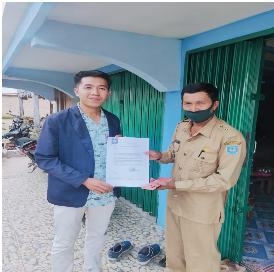
Gambar 2.1 Foto Dengan Kepala Desa

Pada tanggal 20 juli 2020, saya datang ke desa Gunung Batu dan disambut baik oleh Kepala Desa Gunung batu, kepala desa menjelaskan mengenai apa saja yang ada di Desa Gunung Batu, beliau menjelaskan bahwa semenjak adanya covid-19 masyarakat Desa Gunung batu kesulitan dalam beraktivitas sehari-hari contohnya adalah siswa/siswi SD 01 Desa Gunung Batu yang kegiatan pembelajarannya terganggu dan diharuskan untuk belajar dirumah, sehingga siswa/siswi masih kesulitan untuk menjalankan proses pembelajarannya. Saya juga diarahkan oleh Kepala Desa Gunung Batu agar kegiatan yang saya lakukan yaitu PKPM berjalan dengan lancar.