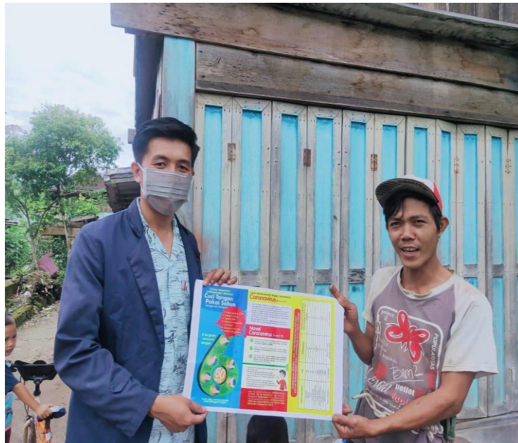
Gambar 2.5 Pembagian Pamflet tentang COVID-19 kepada masyarakat Desa.