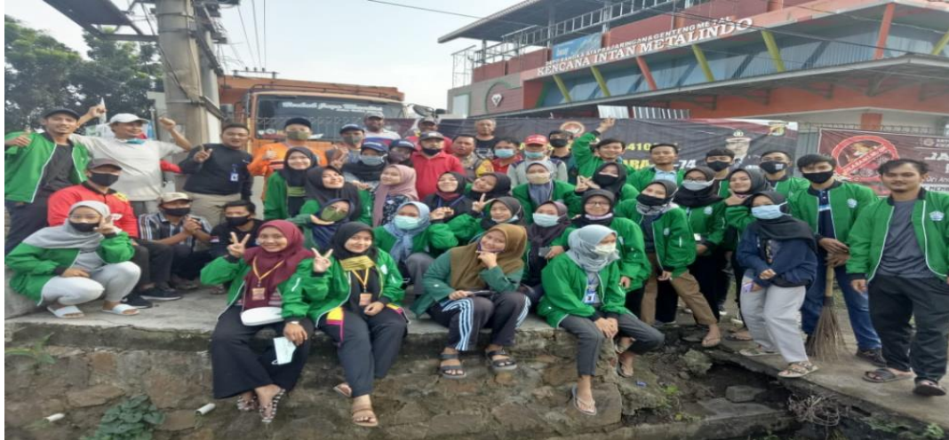
Gambar 2.1.3 Kegiatan Jum'at Bersih