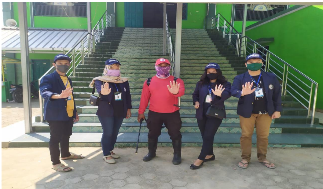
Gambar 2.1.4 Kegiatan Penyemprotan dan Pembagian Masker