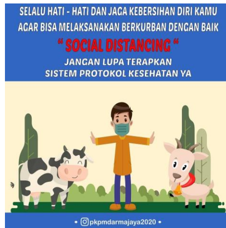
Gambar 3 Artikel Sosial Media 2