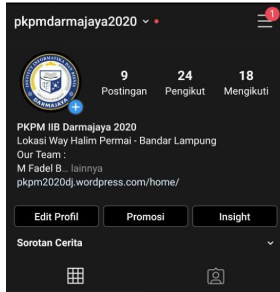
Gambar 1 Tampilan Halaman Sosial Media

media sosial yaitu meningkatkan kesadaran masyarakat mengenai COVID-19.