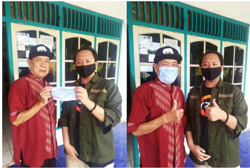
Gambar 7 Dokumentasi Pembagian Masker 1

adanya pembagian masker ini masyarakat dapat mematuhi protokol kesehatan pandemi COVID-19 seperti yang ditetapkan oleh pemerintah.