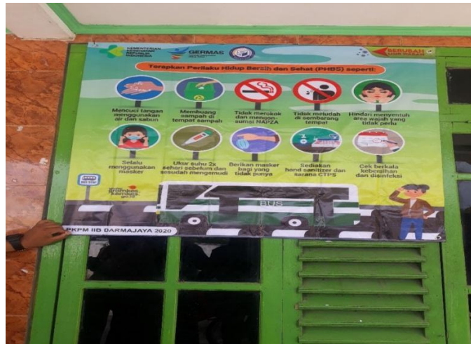
Gambar 2.3.4 Hasil Pembuatan Banner Protocol Kesehatan