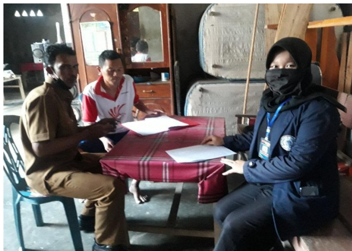
Gambar 2.3.1 Pendataan Bantuan Desa