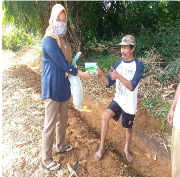
Gambar 2.3.3 pembagian masker dan hand sanitizer