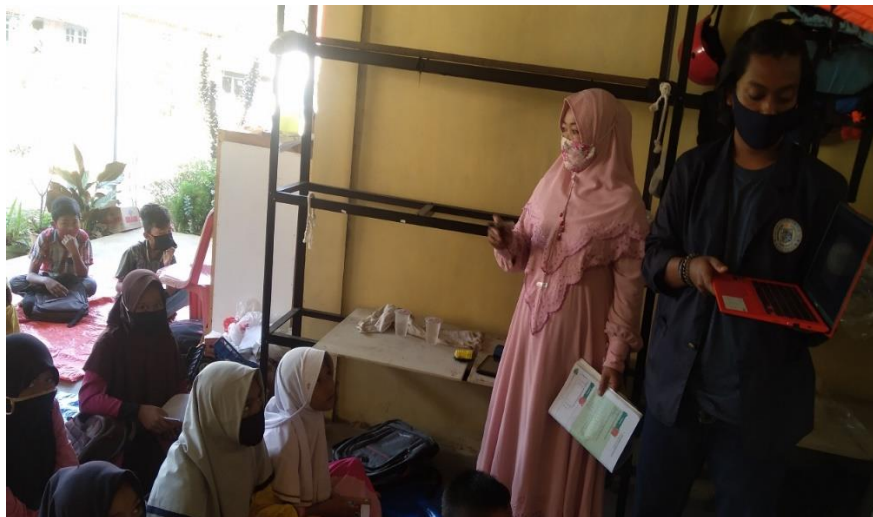
Gambar 3. Pelatihan Google Classroom