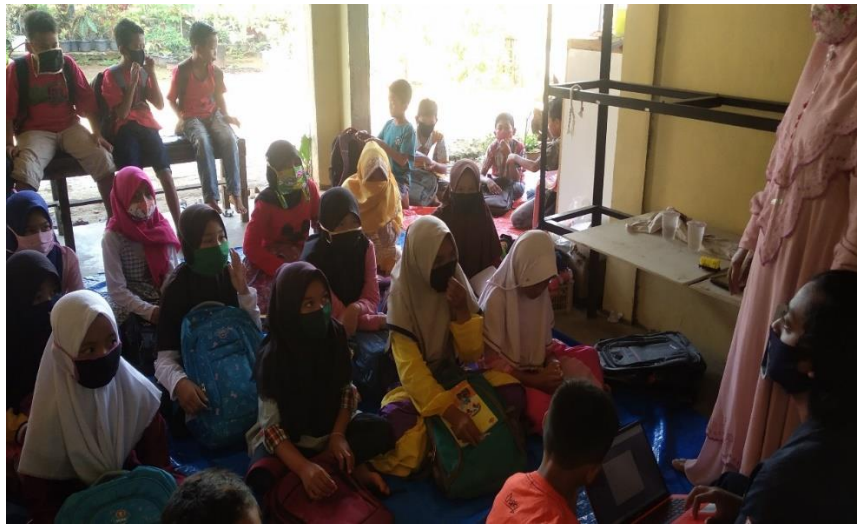
Gambar 4. Pelatihan Google Meet