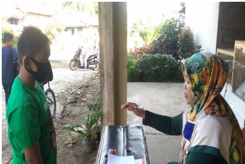
Gambar 10. Pengumpulan Tugas