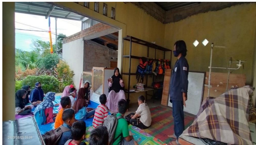
Gambar 7. Sosialisasi Covid-19