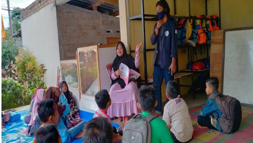
Gambar 6. Perkenalan dengan siswa