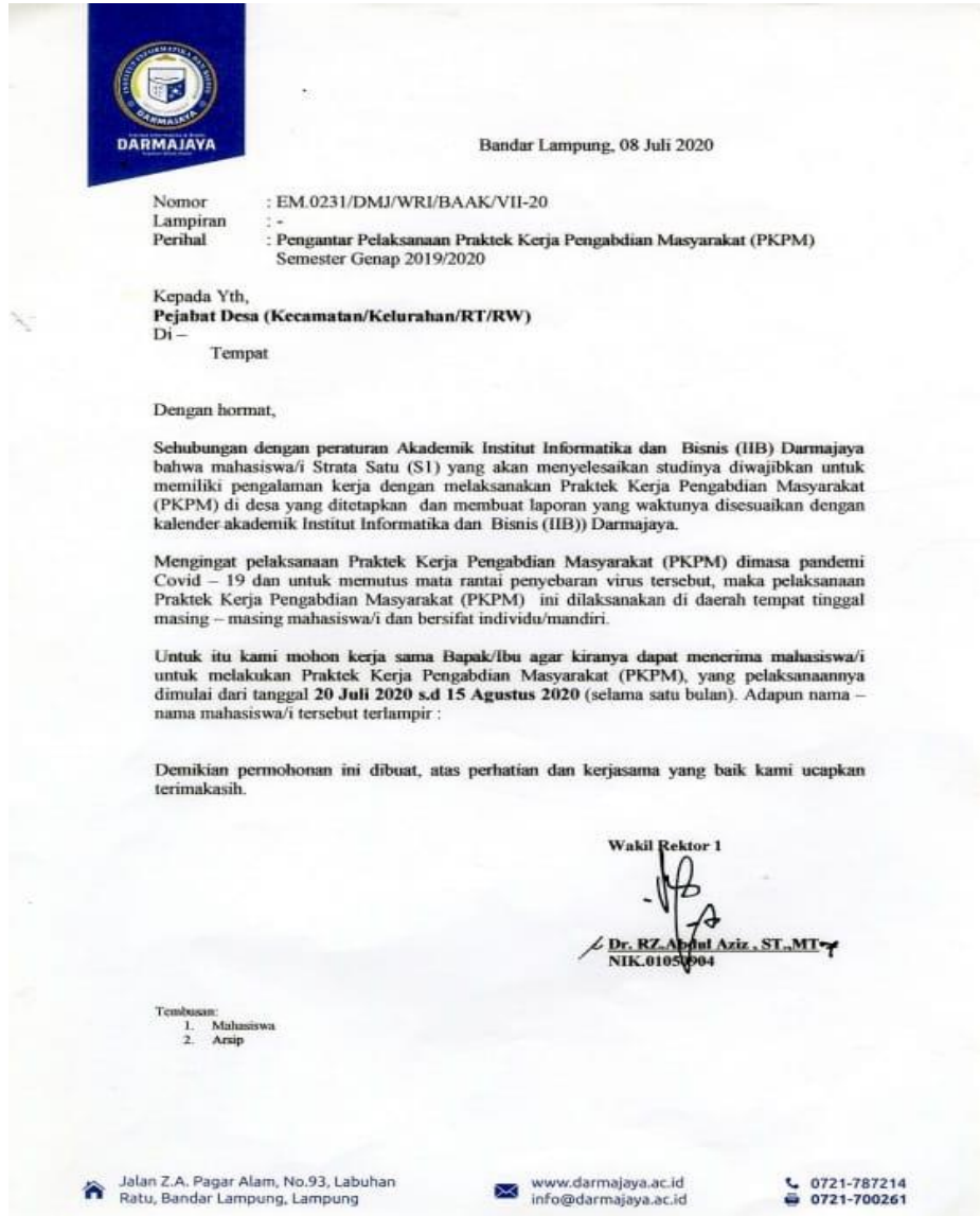
Gambar 5. Surat Pengantar PKPM