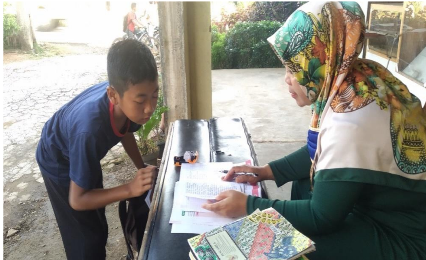
Gambar 9. Absensi Siswa