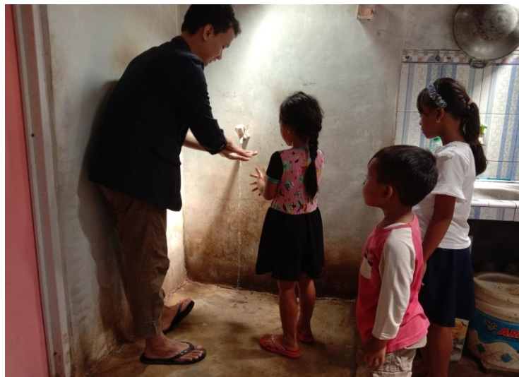
Gambar 2.5 Sosialisasi Cuci Tangan

Anak kecil sangat rentan terkena virus atau penyakit lain dikarenakan sistem imun yang belum kuat dan sifat anak kecil yang masih polos yang belum tahu mana yang baik dan benar sehingga mengedukasi cuci tangan sebelum dan sesudah beraktifitas sangat perlu di ajarkan sejak dini, kegiatan ini dilakukan pada tanggal 02 agustus jam 14.00 di kediaman saya dengan peserta anak-anak lingkungan sekitar.