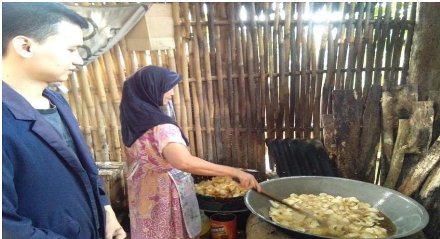
Gambar 1.5 Proses Pengorengan Singkong