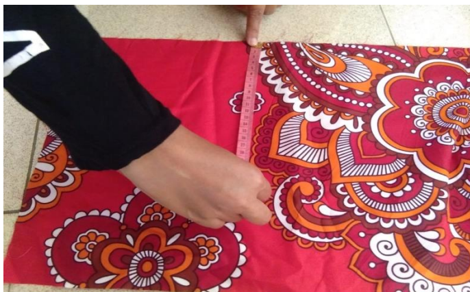
Gambar 2.2 Pembuatan Masker

Pertama bahan-bahan yang dibutuhkan seperti kain, meteran, gunting, dan jarum pentol. Langkah pertama gunting kain sesuai ukuran, kedua gunting kain untuk tali, ketiga selipkan jarum pentol ke dalam kain untuk membuat renda-renda lalu selipkan kain tali di dalam kain masker lalu di jahit di mesin jahit.