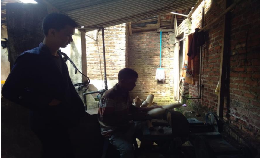
Gambar 1.4 Proses Pemotongan Singkong

Sehinga 6.300.000 - 1.800.000 = 4.500.000 . Jadi keuntungan dari satu kali produksi adalah Rp. 4.500.000.