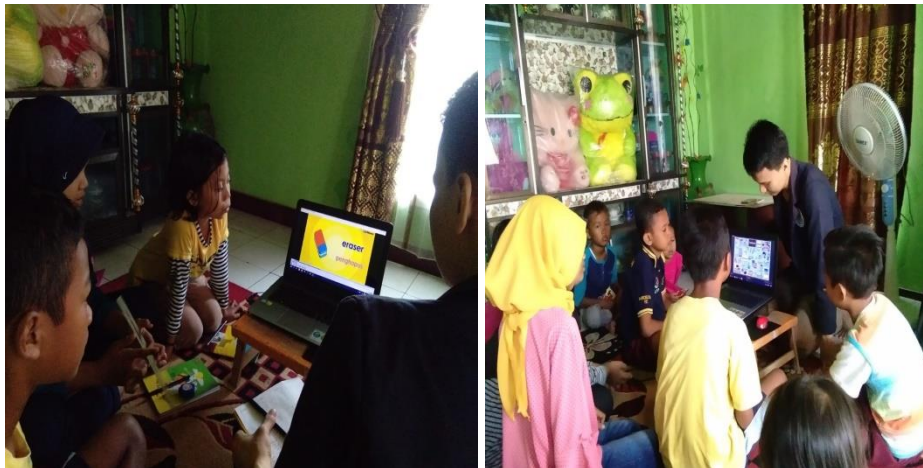
Gambar 2.1 Proses Belajar Bahasa Inggris