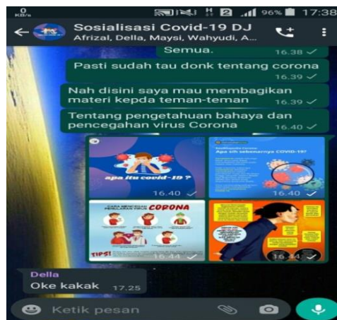
Gambar 2.4 Sosialisasi Covid Whatsapp Grup

Sosialisasi sangat penting dikalangan masyarakat terutama Anak sekolah SMP-SMA karena hampir semua memiliki telepon pintar, sehingga saya membuat Grup Whatsapp anak sekolah dilingkungan sekitar untuk dipahami lalu memberi tahu keluarga dan teman-teman terdekatnya, kegiatan ini dilakukan pada tanggal 06 agustus jam 13.00 dan dilakukan secara daring, pesertanya adalah anak-anak SMP dan SMA di Pejambon. Materi yang diberikan berupa pecegahan dan cara-cara untuk meminimalisir penularan Covid-19.