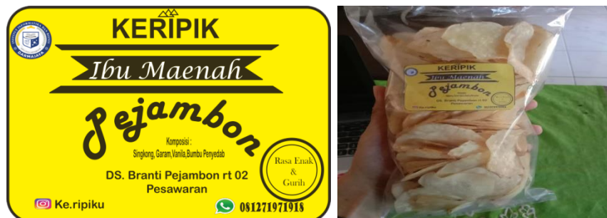
Gambar 1.7 Membuat Logo Ukm