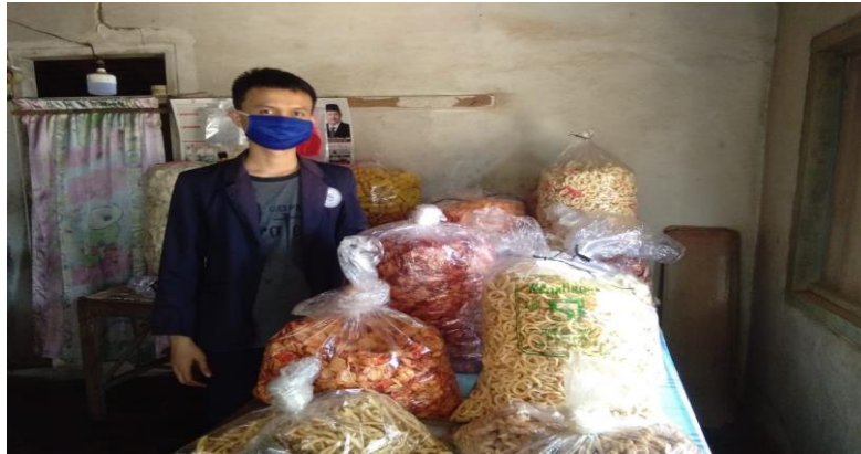
1.6 Hasil Produk Keripik Singkong