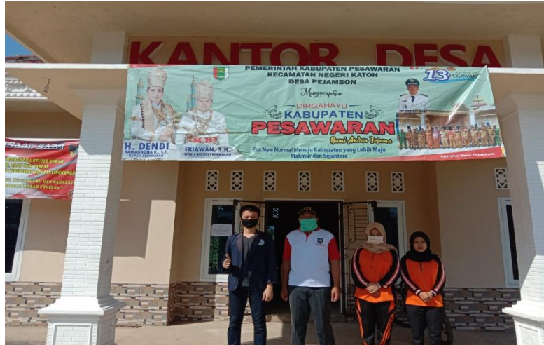
Gambar 2.6 Kegiatan foto bersama Kepala Desa Pejambon