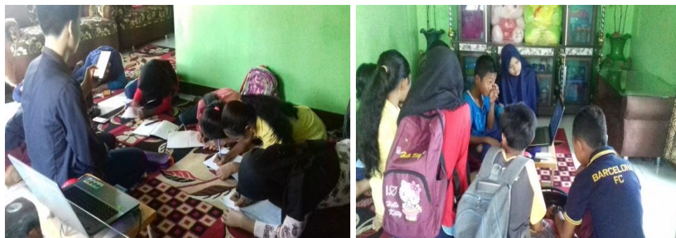
Gambar 2.0 Proses Belajar Tema 1