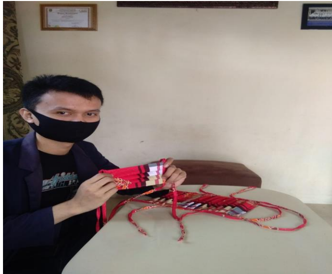
Gambar 2.3 Hasil Produksi Masker Kain