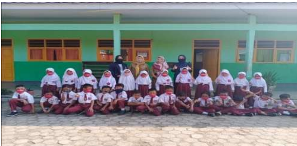
Gambar 2. Foto bersama Siswa/i dan Wali Kelas 2 dan 4