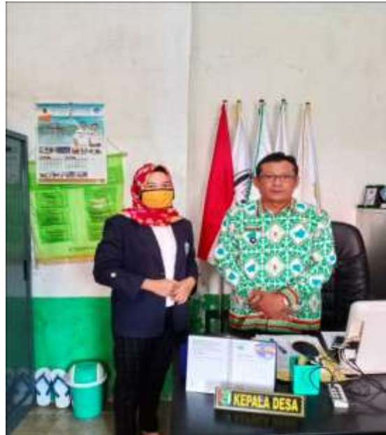
Gambar 2.6 Izin pulang Kepada Kepala Desa