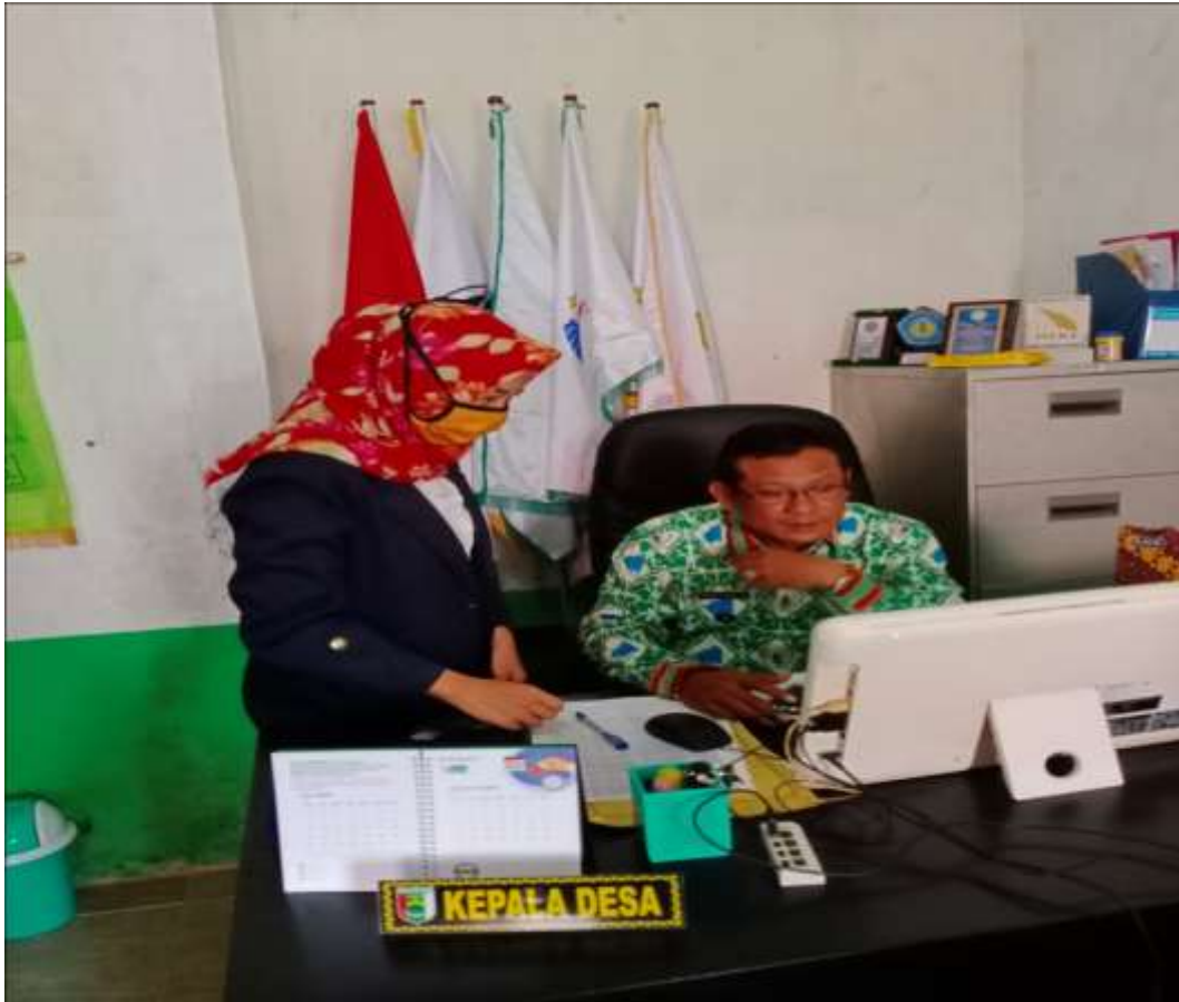
Gambar 5. Mempersentasikan hasil kegiatan PKPM kepada Kepala Desa