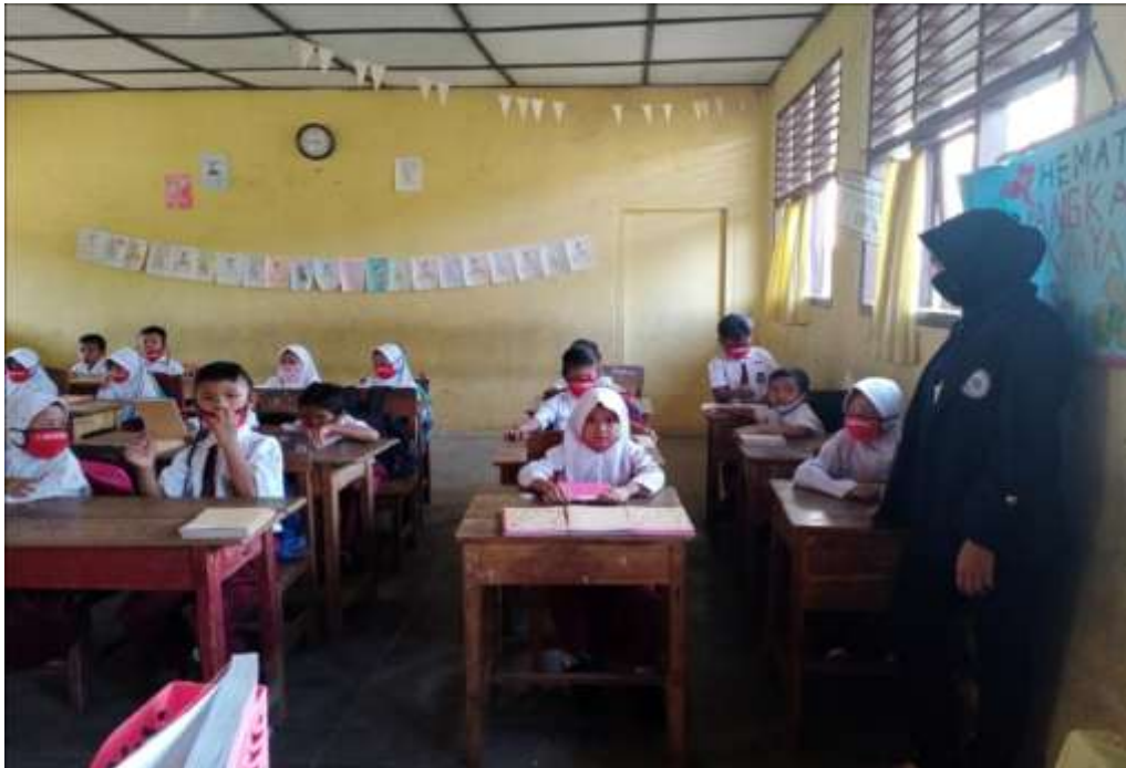
Gambar 1. Pendampingan siswa/i belajar secara daring

Adapun yang terlampir disini yaitu bukti aktivitas kegiatan dalam bentuk dokumentasi guna untuk melengkapi Praktek Kerja Pengabdian Masyarakat (PKPM) :