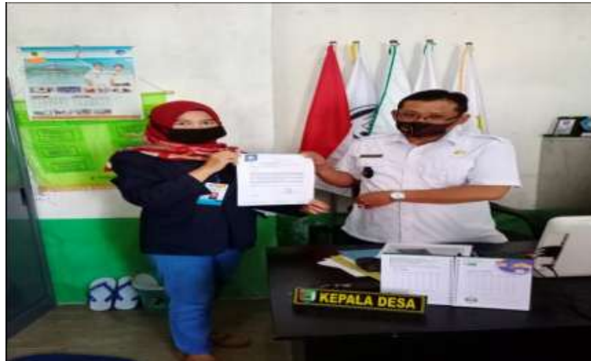
Gambar 2.1 Izin kepada Kepala Desa

melakukan PKPM di Desa Sungai langka dari tanggal 20 Juli-15 Agustus 2020.