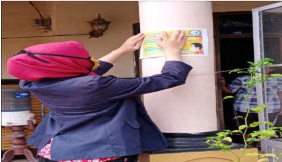
Gambar 3. Sosialisasi dan edukasi berupa brosur