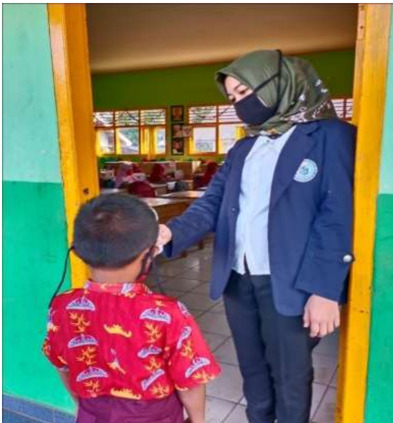
Gambar 4. Pemeriksaan suhu badan kepada Siswa/i