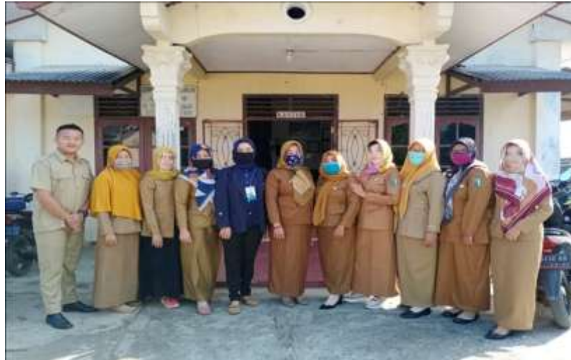
Gambar 2.2 Izin kepada Kepala Sekolah dan Wali Kelas

Optimalisasi pendampingan belajar daring kepada siswa/i di SDN 27 Gedong Tataan. Kegiatan ini pengabdian dilakukan agar mempermudah siswa/i dalam mengoperasikan pembelajaran daring via aplikasi WhatsApp.