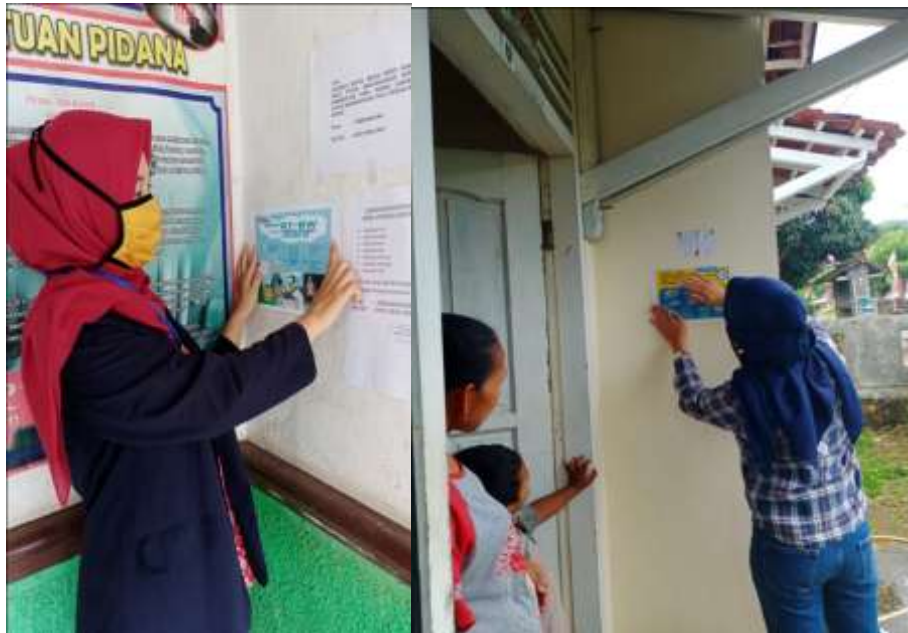
Gambar 2.5 Sosialisasi dan edukasi berupa brosur

Sungai Langka mematuhi protokol kesehatan covid-19 dan terhindar dari covid-19.