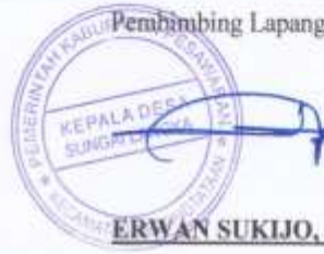
ERWAN SUKJO, S.P