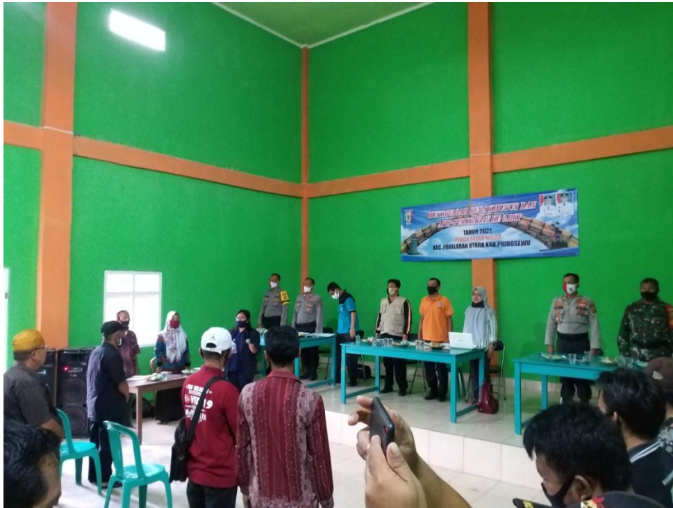
Gambar 2.14 kunjungan ke kantor camat setelah senam jumat