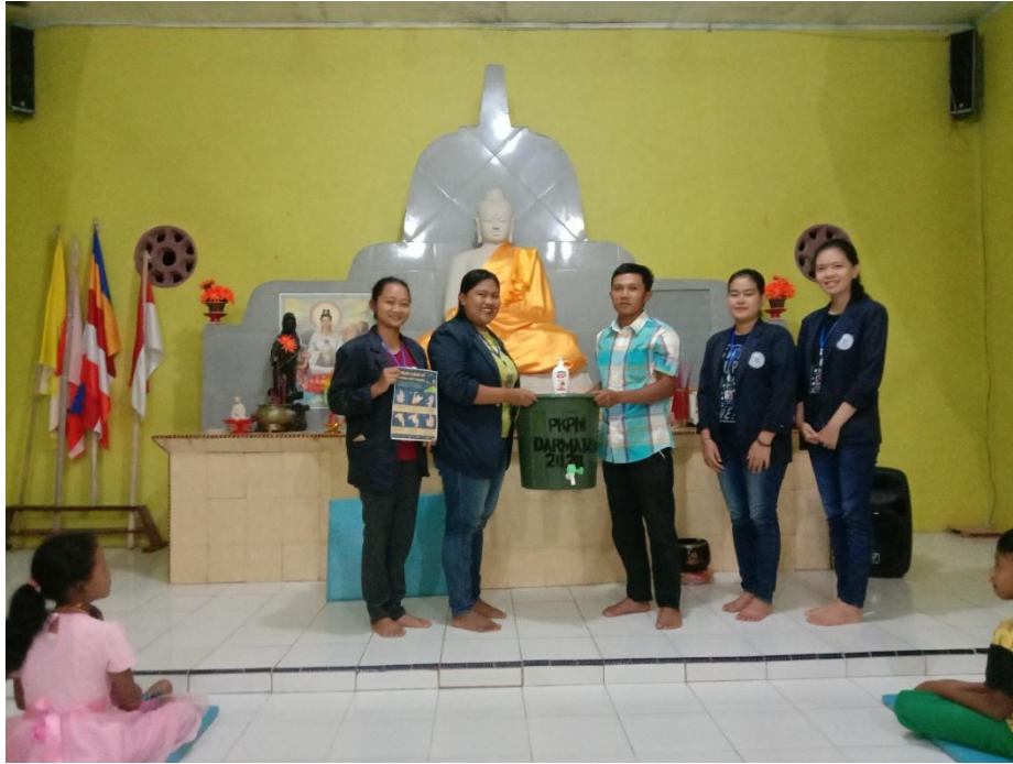
Gambar 2.19 penyerahan alat cuci tangan ke pengurus pura