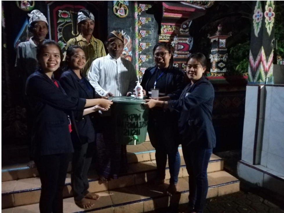
Gambar 2.20 penyerahan alat cuci tangan ke kantor Pekon Fajar Mulia