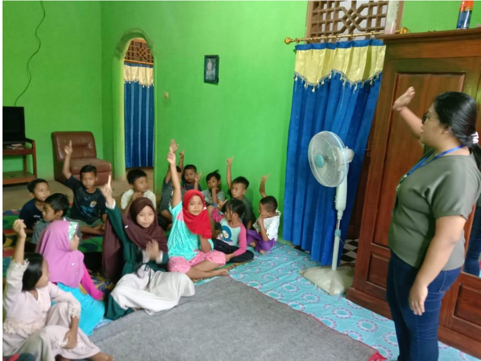
Gambar 2.12 pembagian hadiah pemenang lomba menyambut HUT RI ke 75