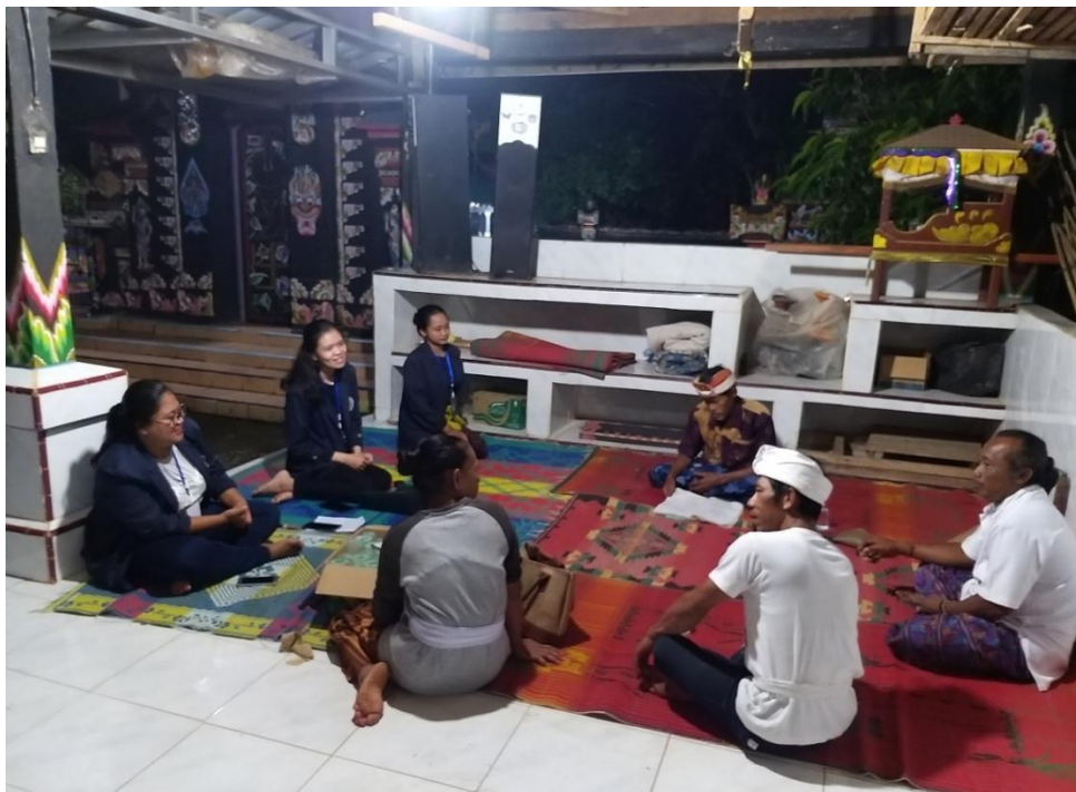
Gambar 2.4 Penyuluhan meningkatkan perekonomian masyarakat di Vihara