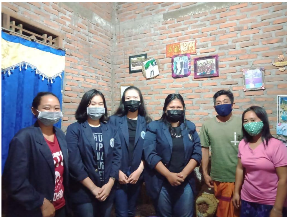
Gambar 2.1 Izin kegiatan ke Ketua RT 02 Pekon Fajar Mulia