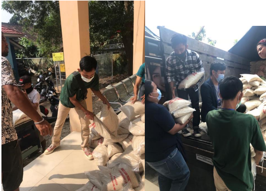
Gambar 1.5 Pembagian BNT

Membantu mendistribusikan bantuan non tunai di kecamatan tanjung karang pusat Bantuan Pangan Non Tunai (BPNT) adalah bantuan sosial pangan dalam bentuk non tunai (beras) dari pemerintah. Kegiatan ini kami masukkan dalam kegiatan program kerja atas permintaan Ibu Camat Tanjung Karang Pusat yang dilaksanakan pada tanggal 3 Agustus 2020. Mengingat banyaknya bantuan yang harus di salurkan ke masyarakat maka disini peran mahasiswa dibutuhkan untuk memantau agar pendistribusian ini tepat mendarat hingga ke rumah warga