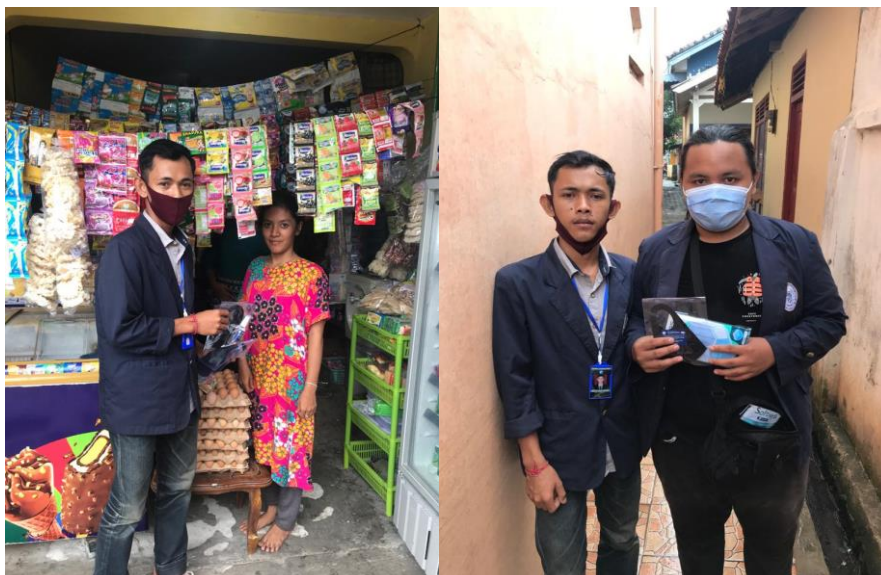
Gamabr 1.6 Pembagian Masker dan Handsanitezer

Membagikan masker dan hansanitezer kepada masyarakat guna untuk mencegah penularan virus corona Masker efektif dapat menangkal cipratan cairan dari saluran pernapasan, biang penularan virus corona. Hand sanitizer adalah cairan pembersih tangan yang digunakan sebagai alternatif untuk mencuci tangan selain menggunakan sabun dan air