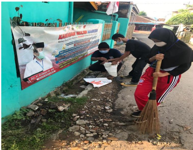
Gambar 1.2 Kegiatan Kerja Bakti

Kegiatan riutin bersih bersih dikelurahan kaliawi yang dilaksanakan setiap hari jum'at. Dalam rangka meningkatkan kebersihan dan kesehatan lingkungan sekitar di tengah pandemi, kerja bakti sangat dianjurkan untuk dilakukan