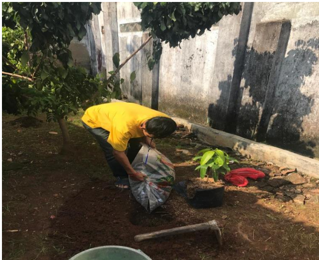
Gambar 1.8 Penghijauan di RT . 06

Menghijaukan kelurahan kaliawi khususnya RT 06 berguna untuk menanggulangi banjir di keesokan tahun. Penghijauan merupakan satu diantara program dalam bidang lingkungan hidup yang bertujuan untuk mengurangi dampak pemanasan global, memperindah lingkungan sekitar dan dapat dipanen pada waktunya