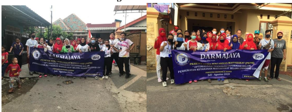
Gambar 1.7 Senam Bersama Warga RT.06

Senam bersama ibu camat dan ibu-ibu pkk untuk menjaga kekebalan tubuh . Guna meningkatkan imun dan kebugaran jasmani di masa pandemi selain itu juga dengan diadakannya senam sore ini maka akan semakin mempererat hubungan kemasyarakatan antar warga