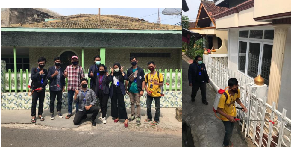
Gambar 1.4 Penyemprotan Desinfektan

Penyemprotan desinfektan dilakukan dengan tujuan memutus mata rantai penyebaran virus covid-19 Dilakukannya penyemprotan desinfektan diharapkan dapat membunuh atau meminimalisir penyebaran virus COVID-19. Penyemprotan ini dilakukan di lingkungan RT 06 Kaliawi dan Masjid, penyemprotan ini juga dilakukan satu hari sebelum Hari Raya Idul Adha pada tanggal 30 Juli 2020 guna memutus mata rantai dan membuat masyarakat sekitar lebih aman saat menjalankan Ibadah Salat Idul Adha