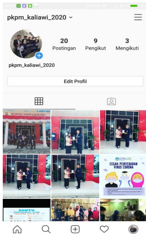
Gambar 1.9 membuat media edukasi

Pembuatan media edukasi berguna untuk kita sebagai salah satu menggunakan teknologi yang baik Melakukan pendataan masyarakat sekaligus pembaruan data di RT 06 Kelurahan Kaliawi yang dilakukan pada tanggal 21 Juli 2020. Sebelum melakukan pendataan masyarakat, mahasiswa berkonsultasi dengan Ketua RT 06 terkait keadaan warganya guna beradaptasi dalam melakukan sensus. Program kerja ini dimaksudkan untuk membantu pemutakhiran data yang dibutuhkan didalam upaya untuk mencegah penyebaran COVID-19 di lingkungan sekitar dan sebagai dasar dalam penindaklanjutan program PKPM COVID-19 IIB Darmajaya. Adapun jenis-jenis pendataan aktivitas