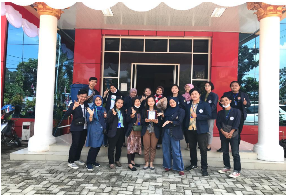
11. Absensi kegiatan pkpm di kelurahan kaliawi