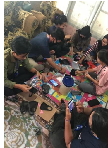
Gambar 1.3 Membuat Masker dan Handsenitizer membagikan masker dan handsanitizer kepada warga kaliwi supaya selalu septi di luar rumah Pembuatan masker dan hand sanitizer untuk masyarakat merupakan sasaran program terutama bagi masyarakat yang rentan terkena COVID-19.