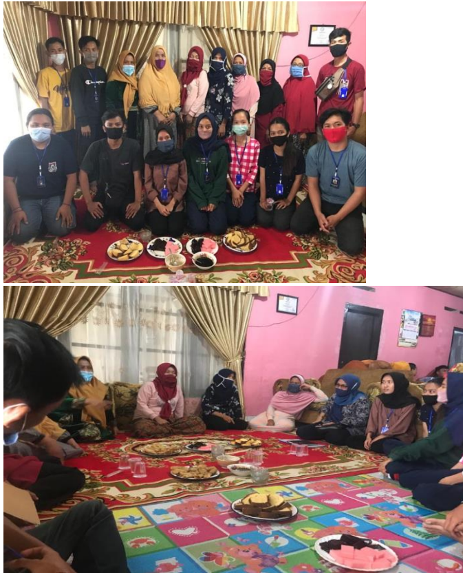
Gambar 1.10 memberikan strategi pemasaran dan mengajarkan penggunaan teknologi untuk memasarkan jasa konveksi