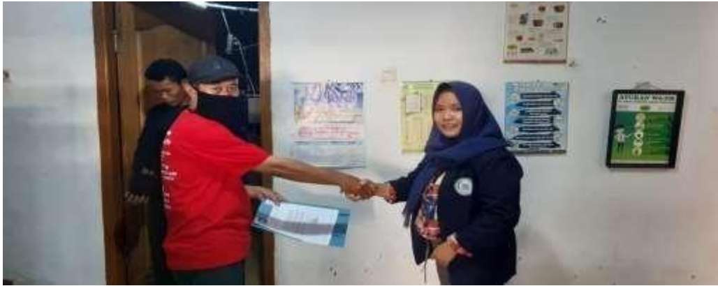
penyerahan surat kepada umkm tempe