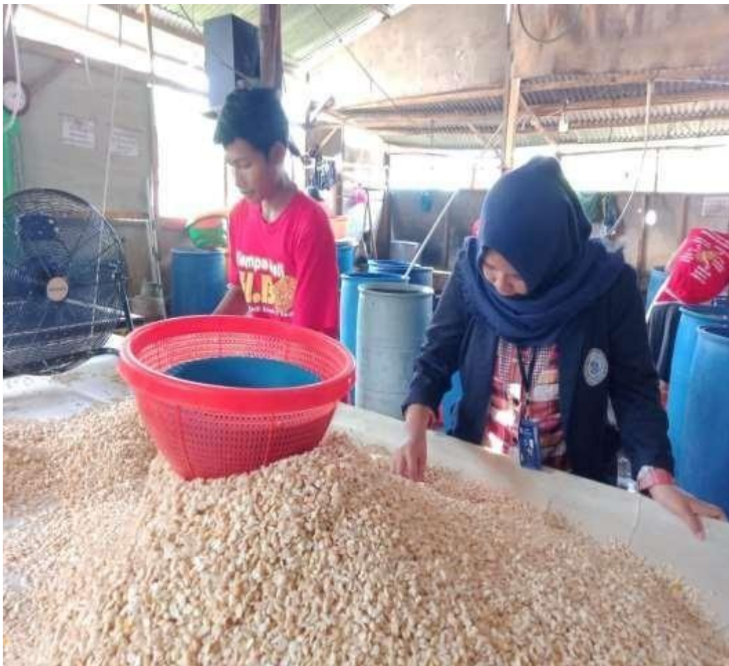
Gambar 2.3.1 program berkunjung ke umkm tempe

program berkunjung ke umkm tempe yang saya lakukan ini saya dapat meningkatkan kreativitas dari karyawan tempe ini yang mana mereka hanya tau cara membuat tempe tetapi mereka sekarang tau bagaimana cara memasarkan tempe secara online dan membuat makan ringan yang terbuat dari tempe dimasa pandemi ini sehingga walaupun kondisi sekarang masih pandemi ,keuangan mereka pun stabil walaupun karyawan diliburkan mereka bisa menghasilkan uang dari bisnis kecil kecilan mereka tersebut yang terbuat dari tempe.