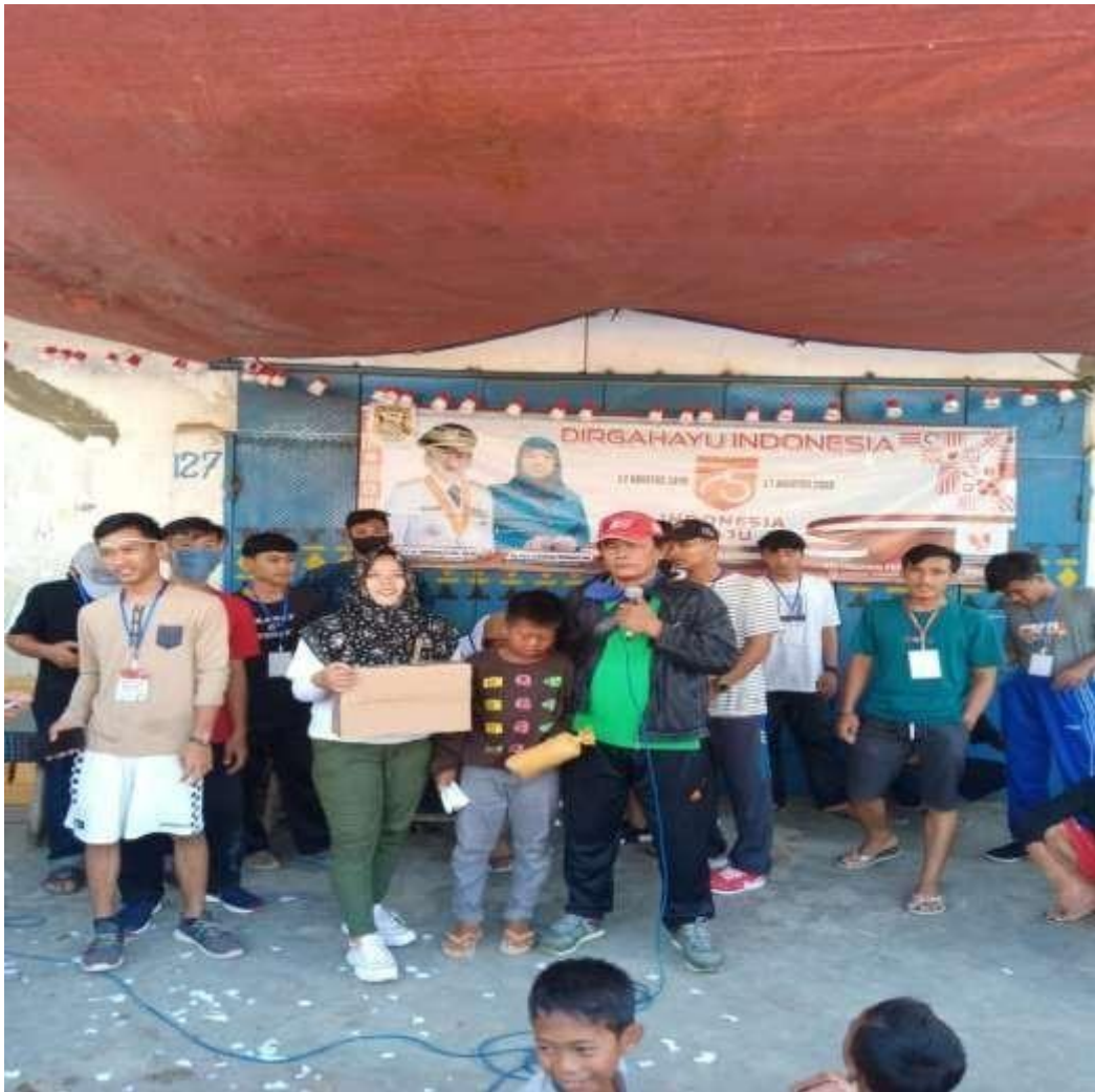
Gambar 2.3.5 program ikut serta menjadi panitia 17 agustus

hasil kegiatan dari program kerja yang saya lakukan ini saya bisa menumbuhkan rasa nasionalisme dari setiap warga desa teluk dari kalangan remaja, anak2 hingga ibu ibu dan bapak bapak yang tadinya mereka tidak mengerti apa itu nasionalisme dan sekarang mereka bisa ikut serta dalam memperingati para pahlawan yang gugur demi memerdekakan indonesia ,dari segi positif dari remaja mereka yang tadinya di kampung mereka tidak aktif setelah ada ajakan dan pengetahuan yang saya berikan mereka menjadi aktif menjadi panitia hingga mewujudkan acara yang meriah sebagai bukti sikap nasionalisme mereka ada pada diri mereka.