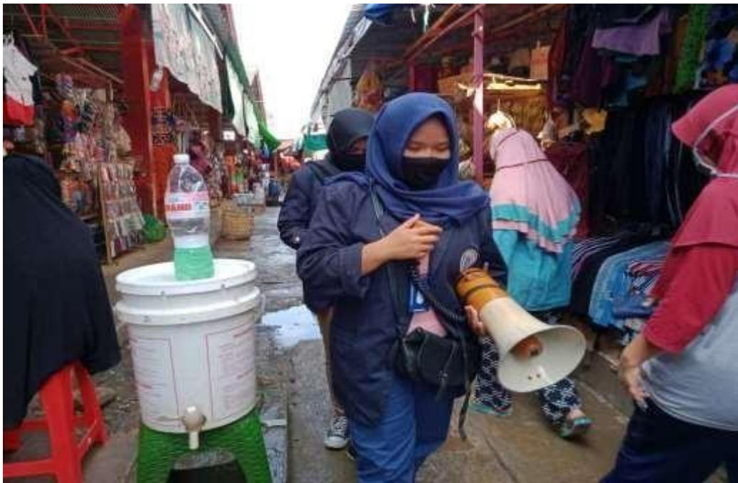
Sosialisasi harus menggunakan masker dan slalu cuci tangan di pasar cimeng