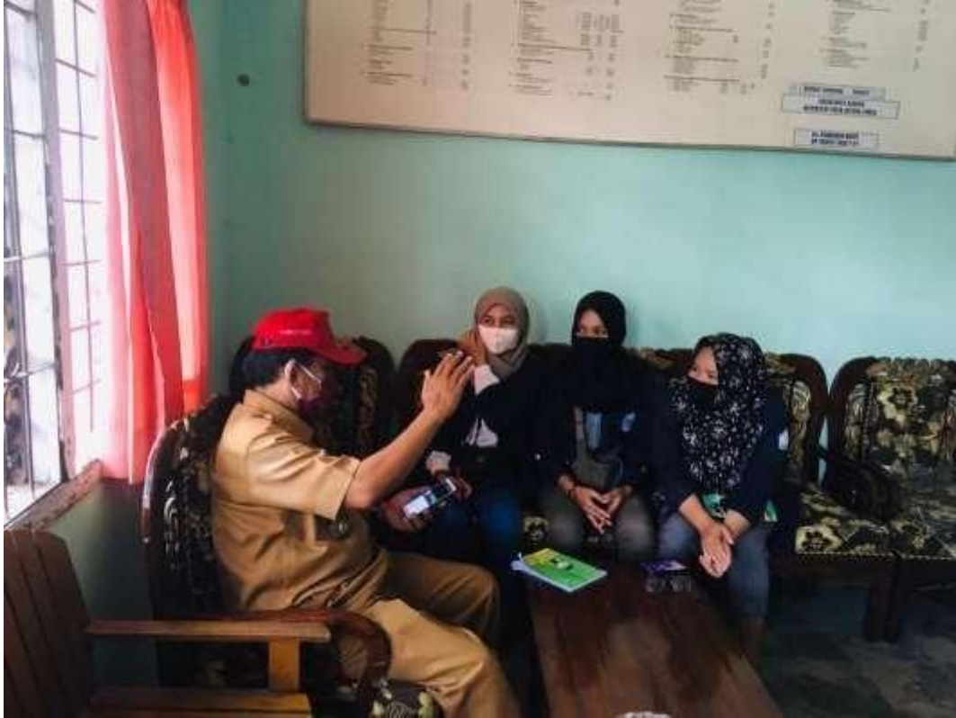
Memberi pengetahuan serta motivasi dari lurah desa teluk secara tatap muka