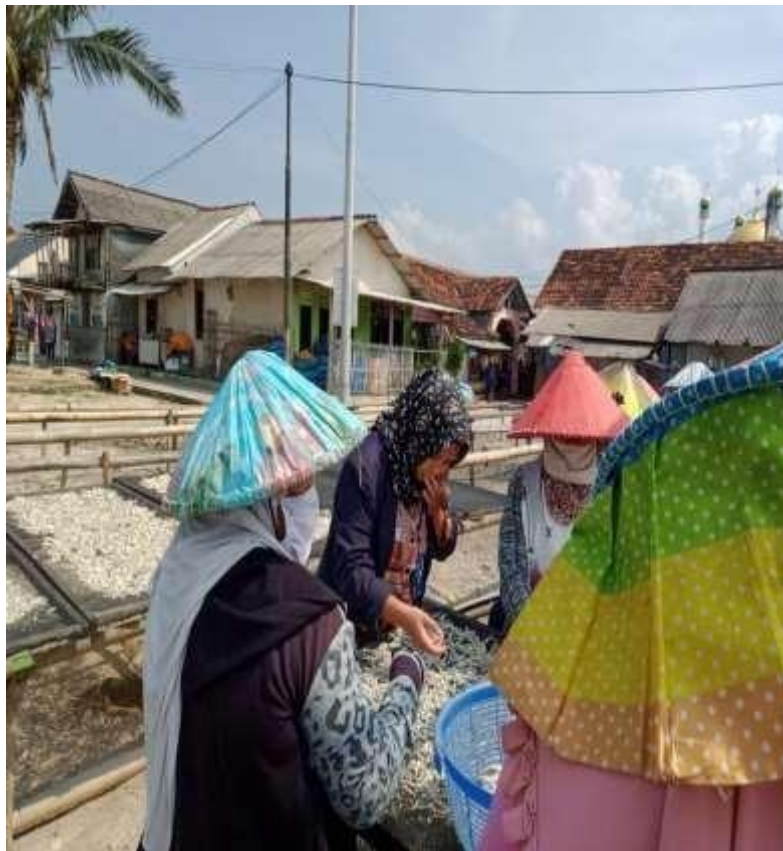
Gambar 2.3.3 berkunjung ke umkm ikan asin

program berkunjung ke umkm ikan asin yang saya lakukan saya juga membantu meningkatkan pengetahuan mereka tentang apa itu berbisnis secara online dari mereka yang tidak mengetahui apa itu bisnis online mereka menjadi tau, dan bagaimana menggunakan bisnis online tersebut. program berkunjung ke umkm ikan asin yang saya lakukan ini saya mendapatkan banyak ilmu pengetahuan contohnya saya yang tidak tau cara menjemur ikan dari proses pengeringan, pembersihan dan pengaraman saya jadi tau dan pemilik umkm ikan asin pun banyak memberikan motivasi, memberikan tips cara berbisnis yang baik sehingga bisnis ikan asin mereka laku pesat, dan saya juga membantu meningkatkan pengetahuan mereka tentang apa itu berbisnis secara online dari mereka yang tidak mengetahui apa itu bisnis online mereka menjadi tau, dan bagaimana menggunakan bisnis online tersebut.