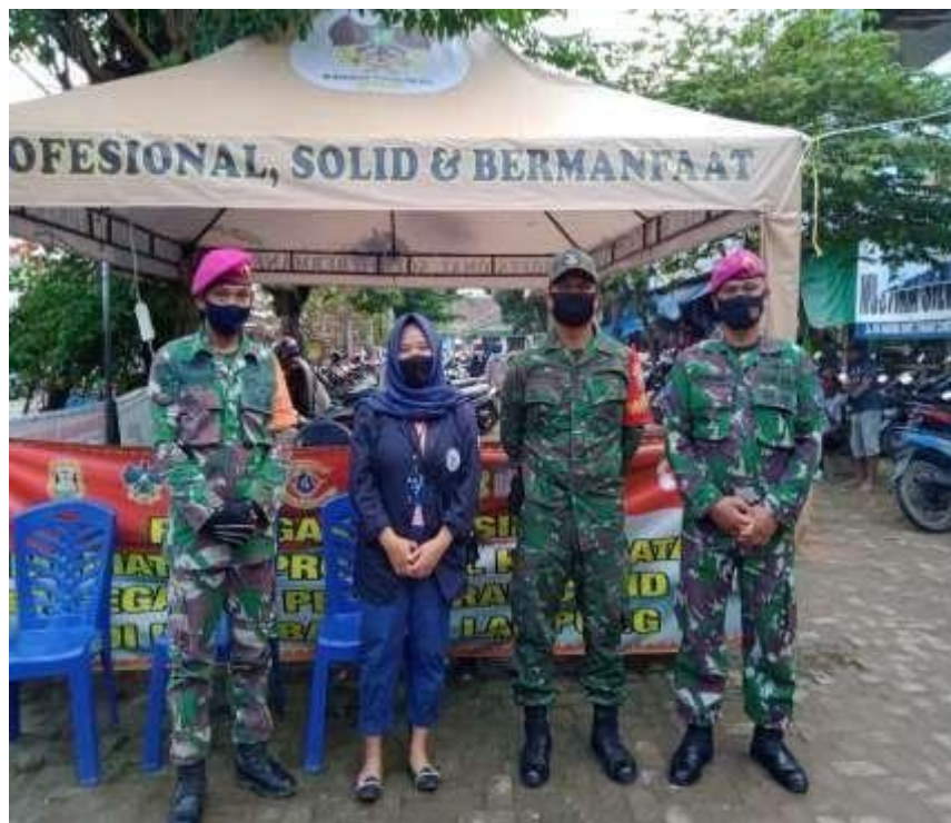
Gambar 2.3.2 Program kerja sosialisasi pencegahan covid 19

Program kerja sosialisasi pencegahan covid 19 yang saya lakukan ini saya dapat membantu meningkatkan kesadaran anak-anak remaja tentang cara pencegahan penyebaran serta bahaya virus corona (Covid-19). di masa pandemi ini anak remaja mulai membiasakan hidupnya dengan beradaptasi kebiasaan baru dengan tetap memperhatikan protokol kesehatan sesuai anjuran pemerintah. Pelaksanaan program kerja ini berjalan lancar tanpa adanya kendala, yang saya lakukan yaitu mengajarkan cara mencuci tangan dengan benar dan cara memakai masker dengan baik. disini saya mengambil beberapa sampel anak remaja di desa setempat, karna saya mengurangi untuk mengumpulkan banyak orang disaat pandemi virus corona (Covid-19), dan saya juga memberikan informasi ini dengan menggunakan sosial media online (bagi anak remaja yang tidak mengikuti kegiatan yang saya berikan).