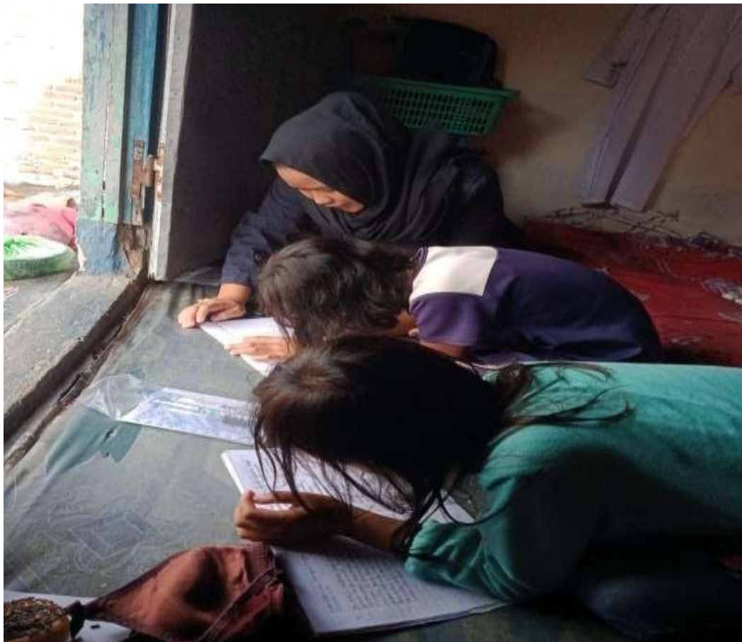
Gambar 2.3.4 program mendampingi siswa belajar daring

Hasil kegiatan dari program kerja yang telah saya lakukan ini yaitu saya dapat mendampingi dan membantu adik-adik dalam belajar online disaat pandemi viruscorona (Covid-19). karena mereka sangat mengalami kesulitan disaat hanya belaja dari rumah. setelah saya melakukan kegiatan ini mereka senang mendapatkan ilmu tentang cara menggunakan handphone maupun laptop untuk belajar online di rumah saja. Dan merasa lebih mudah dalam memahami pelajaran yang diberikan oleh gurunya. Pelaksanaan program kerja ini kurang berjalan lancar karena adanya kurang alat untuk belajar online yaitu handphone maupun laptop, dikarenakan adik-adik tersebut tidak semua nya memiliki alat komunikasi tersebut untuk melakukan belajar online dirumah saja, tetapi mereka tetap bersemangat untuk mendapatkan sedikit ilmu dari saya.