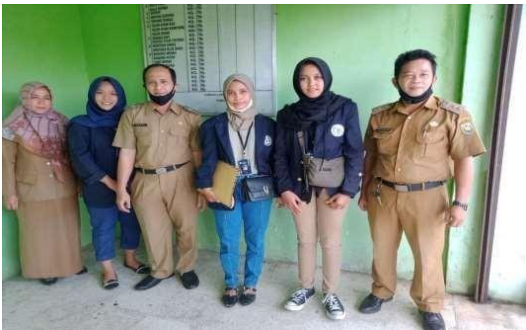
Foto bersama panitia pencegahan covid 19