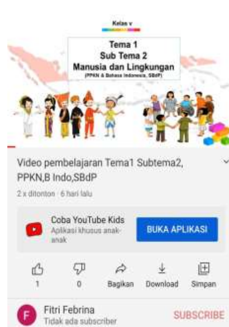
Gambar pemanfaatan media sosial youtube sebagai pembelajaran online