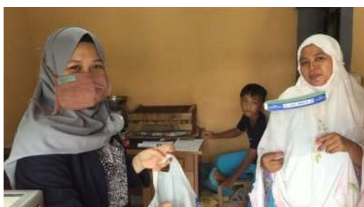
Gambar 2.14 Pembagian Face Shield

Program kerja yang terakhir adalah pembagian Alat Perlindungan Diri atau APD berupa face shield. Kegiatan ini bertujuan untuk membantu masyarakat dalam mempersiapkan alat perlindungan diri jika hendak beraktifitas.