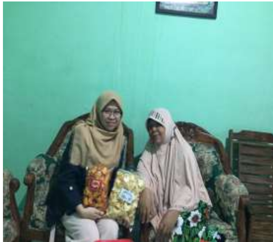
Gambar bersama pemilik UMKM Keripik Singkong Istiqomah