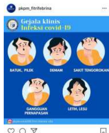
Gambar 2.2 poster edukasi