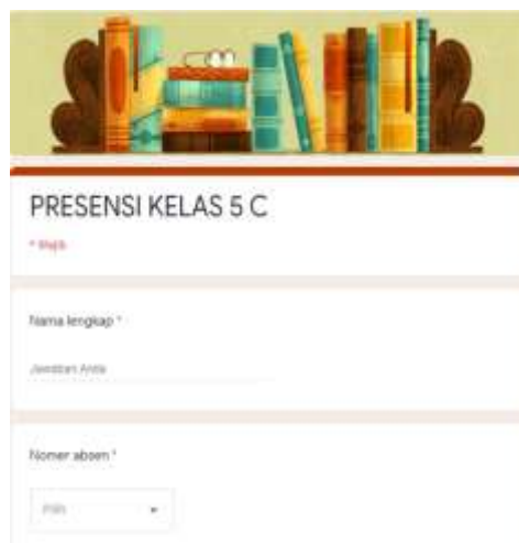
Gambar 2.5 Presensi Online

Pembuatan presensi online bertujuan untuk memudahkan guru dalam merekap presensi siswa dalam 1 semester, dan menilai keaktifan siswa dalam pembelajaran secara daring /online serta mengenal teknologi kepada siswa dalam pembelajaran.