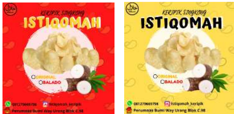
Gambar 2.8 Label Keripik Singkong Istiqomah

Selain membuat media pemasaran online saya juga membuat label baru yang bertujuan untuk membuat tampilan keripik Singkong yang menarik sehingga konsumen tertarik.