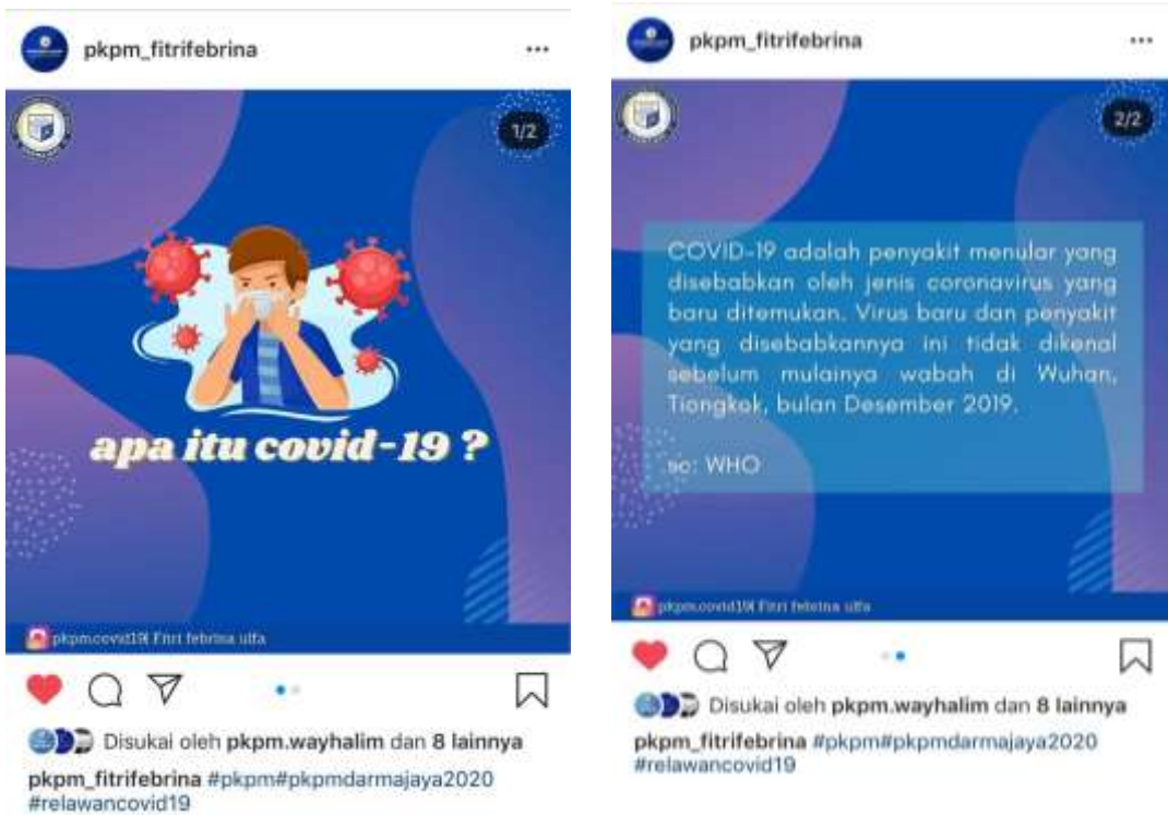
Edukasi dan sosialisasi covid-19 melalui media sosial