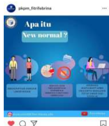
Gambar 2.4 poster edukasi