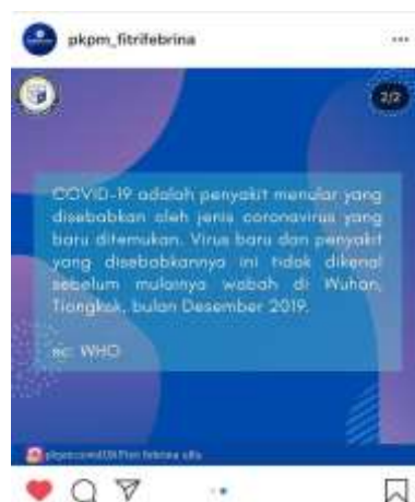
Gambar 2.1 poster edukasi

Program kerja pembuatan poster edukasi Covid-19 dan New Normal merupakan salah satu kegiatan bentuk edukasi kepada masyarakat tentang pemahaman tentang Covid-19. Pembuatan poster dibuat berdasarkan sumber-sumber informasi yang tepat dan akurat seperti website resmi pemerintah dan media berita. Berita tersebut kemudian didesain menjadi poster yang menarik dan mudah dipahami oleh masyarakat, kemudian poster edukasi Covid-19 dan New normal dibagikan lewat media sosial instagram dan whatsapp.