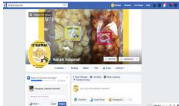
Gambar 2.9 Facebook Keripik Singkong Istiqomah