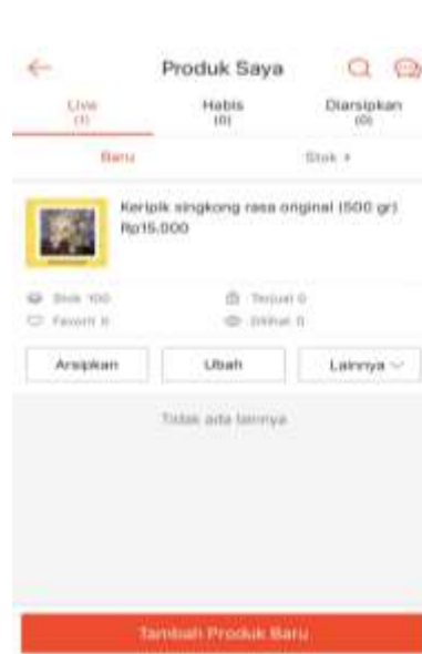
Gambar 2.11 shopee Keripik Singkong Istiqomah

Penggunaan platform penjualan online pada saat ini sangat digandrungi masyarakat karna penggunaannya yang mudah dan praktis tanpa harus berpergian ke luar rumah. Maka dari itu saya memasarkan produk ke shopee dengan harapan pemasaran produk Keripik Singkong Istiqomah secara luas.