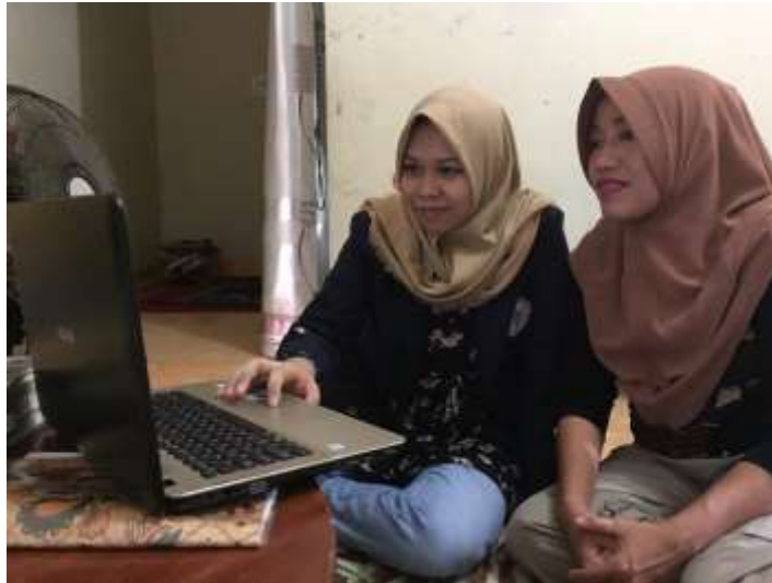
Gambar bimbingan kepada guru dalam menggunakan teknologi infomasi