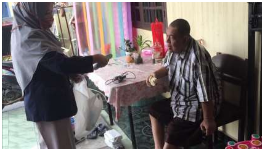
Gambar pembagian face shield