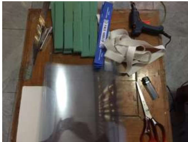
Gambar 2.12 Bahan dan Alat Face Shield