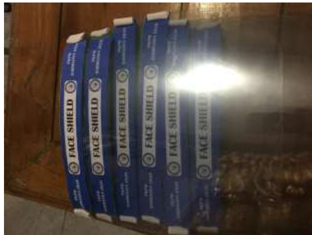
Gambar face shield