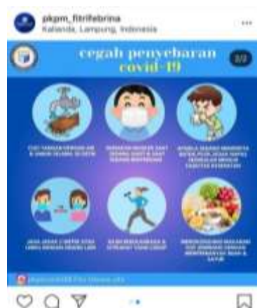
Gambar 2.3 poster edukasi