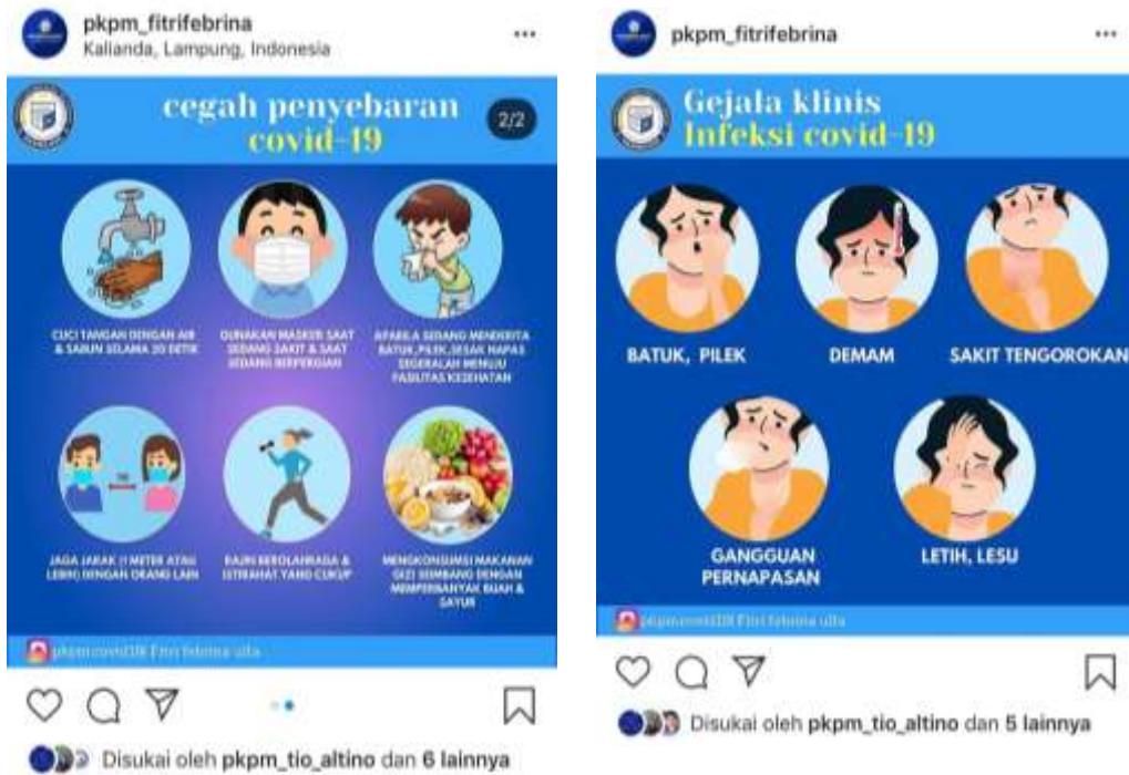
Gambar edukasi dan sosialisasi pencegahan covid-19