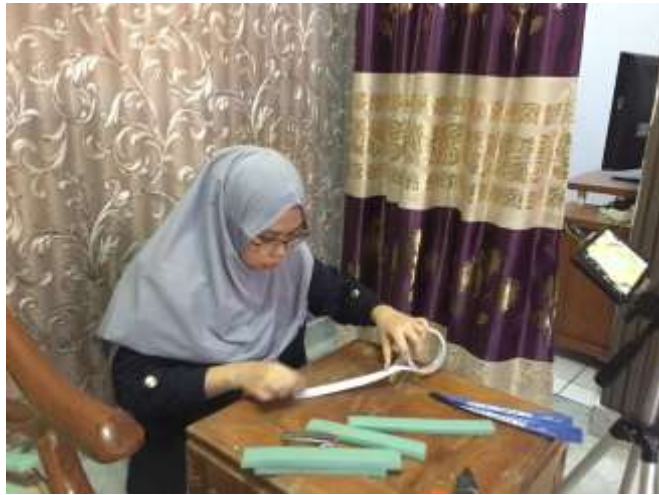
gambar proses pembuatan face shield