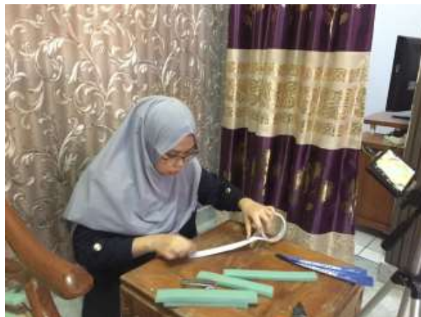
Gambar 2.13 Proses pembuatan Face Shield