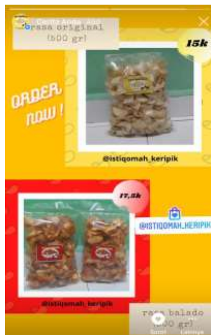
Gambar kegiatan promosi pruduk melauli media sosial