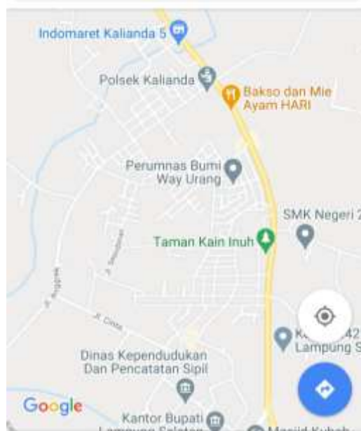
Gambar denah lokasi PKPM