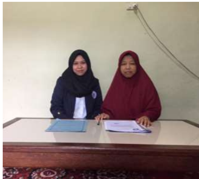
Gambar penyerahan surat izin PKPM Kepada RT.02 Perumnas Bumi Way Urang