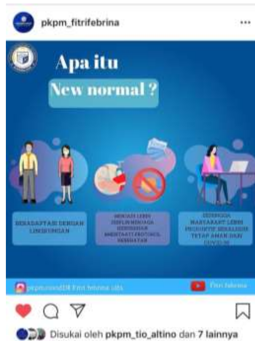
Edukasi dan sosialisasi new normal