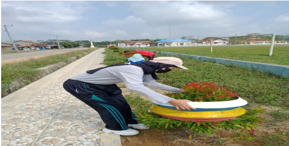
Gambar 14. Kegiatan Gotong Royong dan perbaikan taman