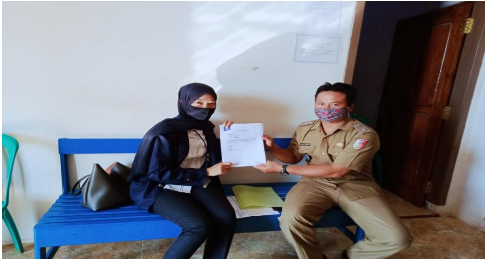
Gambar 1. Penyerahan surat pengantar Praktek Kerja Pengabdian Masyarakat.