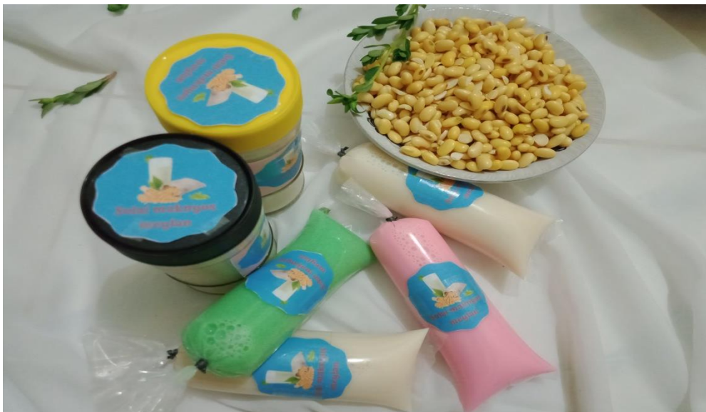
Gambar 6. Pembuatan logo produk susu kedelai

Didalam pembuatan produk susu kedelai ini tentunya kita akan memikirkan packaging dari produk susu kedelai ini, yaitu dengan memberikan logo produk pada kemasan susu kedelai.