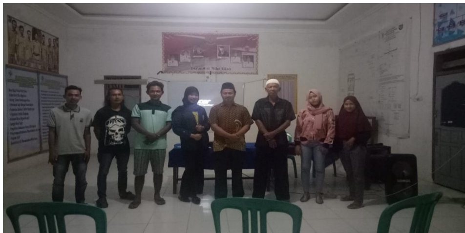
Gambar 8. Foto bersama dalam kegiatan pelatihan kewirausahaan