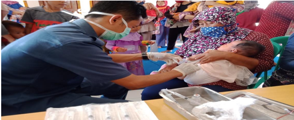
Gambar 9. Kegiatan pemberian suntik dan vitamin balita.

Kegiatan imunisasi balita ini dilakukan setiap bulan satu kali secara rutin yang dilakukan oleh bidan desa kampung Trijaya bersama dengan kader desa beserta staff kesehatan dari puskesmas Penawartama. Bagi anak dibawah lima tahun untuk pemberian vitamin, penimbangan berat badan, pengukuran tinggi badan, dan untuk menghindari stunting. Serta pemberian sosialisasi dan edukasi untuk tetap mengikuti protokol kesehatan disaat melakukan imunisasi.