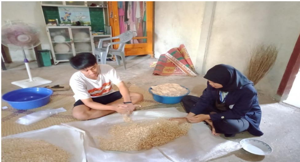
Gambar 3. Membantu kegiatan pembuatan tempe

Di desa Trijaya ini terdapat UMKM tahu dan tempe dimana dalam kegiatan ini bertujuan untuk membantu pengusaha tahu dan tempe dalam pembuatan tahu dan tempe.