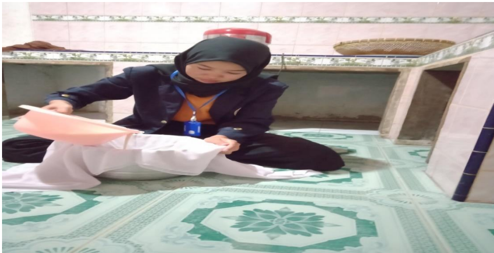
Gambar 5. Pembuatan susu kedelai

Serta melakukan inovasi produk dari bahan baku kedelai yang dapat dimanfaatkan untuk pembuatan susu kedelai.