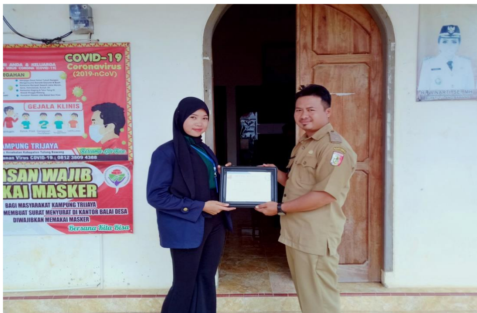
Gambar 17. Penyerahan plakat bersama Kepala Desa Trijaya

Dalam penutupan dan pelepasan peserta Praktek Kerja Pengabdian Masyarakat (PKPM) 2020 ini peserta memberikan kenang-kenangan yang diserahkan kepada Kepala Desa Trijaya.