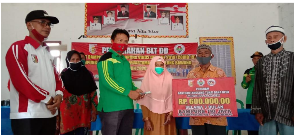
Gambar 13. Kegiatan penyerahan Bantuan Langsung Tunai Dana Desa

Kegiatan penyerahan BLT DD (Bantuan Langsung Tunai Dana Desa) Kampung Trijaya yang dihadiri oleh pihak kecamatan dan pendamping desa.