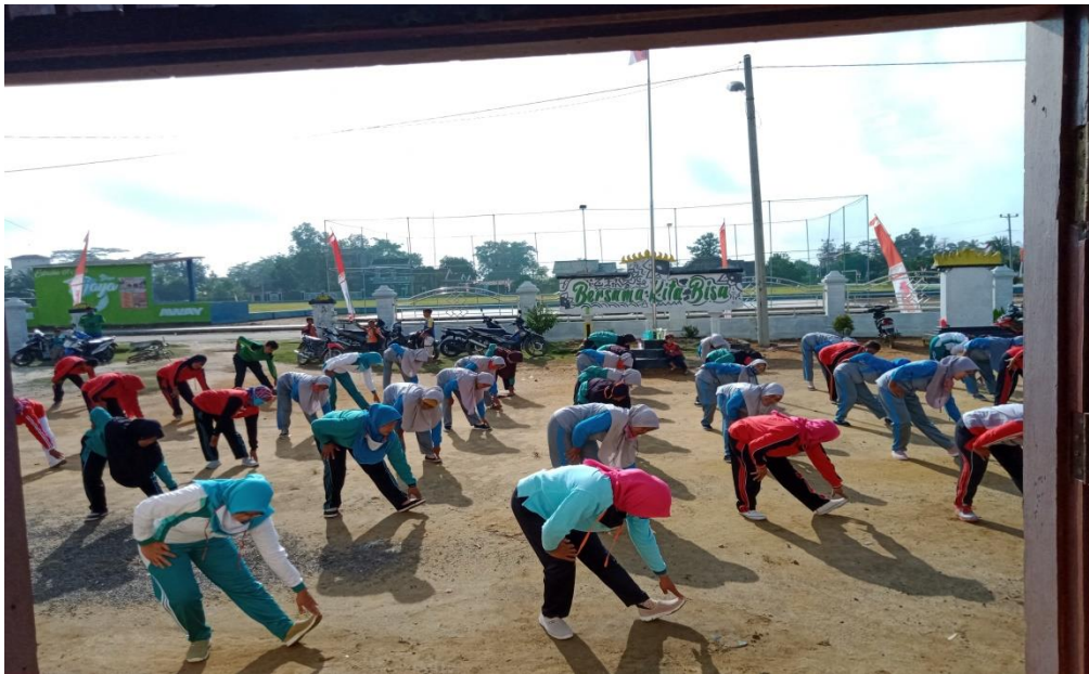
Gambar 16. Senam Bersama

kebugaran badan. Dalam pelaksanaannya dilakukan dengan mengikuti protokol kesehatan, yaitu tertib memakai masker.