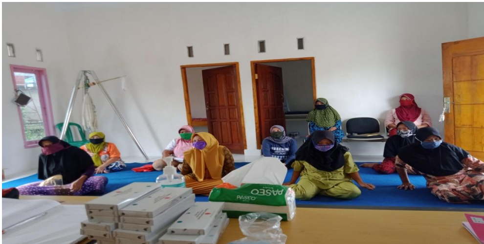
Gambar 11. Kegiatan imunisasi ibu hamil

Kegiatan imunisasi ibu hamil ini dilakukan setiap bulan satu kali secara rutin yang dilakukan oleh Bidan Desa kampung Trijaya bersama dengan kader desa beserta staff kesehatan dari puskesmas Penawartama. Kegiatan imunisasi ibu hamil meliputi pengecekan berat badan, tensi darah, cek lila, dan pemeriksaan keadaan bayi dan ibu.