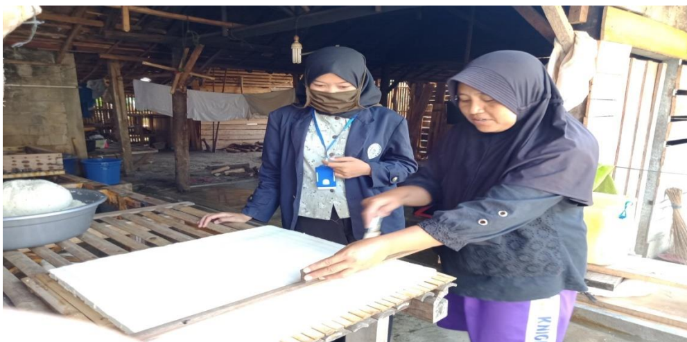
Gambar 4. Membantu kegiatan pembuatan tahu

Di desa Trijaya ini terdapat UMKM tahu dan tempe dimana dalam kegiatan ini bertujuan untuk membantu pengusaha tahu dan tempe dalam pembuatan tahu dan tempe.