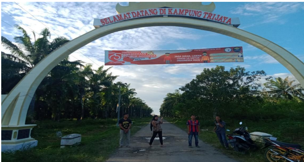
Gambar 15. Pemasangan Banner HUT-RI dan Covid-19

Tujuan pemasangan banner ini untuk memperingati hari Ulang Tahun Indonesia dan ajakan kepada masyarakat akan tetap patuh terhadap protokol kesehatan dengan membantu upaya pemerintah untuk memutus mata rantai penyebaran COVID-19.