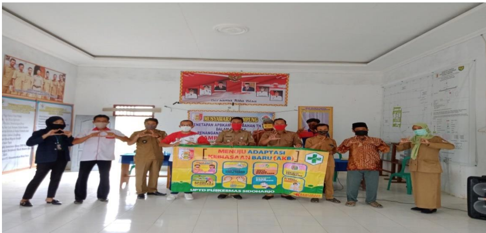
Gambar 2. Sosialisasi dan Edukasi Covid-19 menuju Adaptasi Kebiasaan Baru

Implementasi dalam kegiatan edukasi dan sosialisasi tentang bahaya COVID-19 kepada masyarakat di kampung Trijaya yang disampaikan secara langsung bersama dengan team kesehatan dari puskesmas Sidoharjo yang dilaksanakan secara luring dikarenakan keterbatasan jaringan, serta kurangnya pengetahuan masyarakat tentang teknologi yang tidak memungkinkan untuk melaksanakan secara daring.