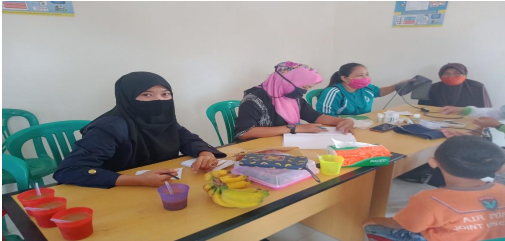
Gambar 10. Kegiatan imunisasi lansia