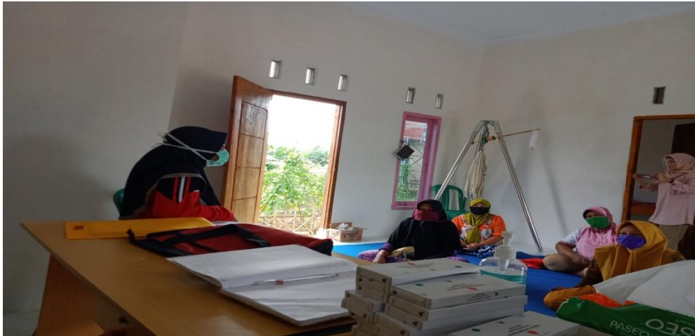
Gambar 12. Kegiatan sosialisasi bahaya covid-19 kepada ibu hamil