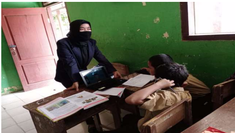
Gambar 2.3.2 presentasi penjelasan COVID-19

Dalam membagikan masker maka agar siswa/siswi tetap menggunakan masker disetiap hari nya di sekolah maupun di rumah, supaya tetap menjaga kesehatan dan terjaga dari COVID-19.