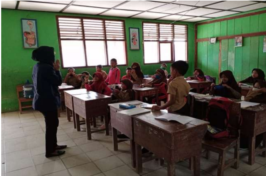
Gambar 2.3.4 kegiatan pendampingan di sekolah

dalam melakukan pendampingan siswa/siswi di sekolah maka pengabdian juga memberikan sedikit penjelasan sedikit tentang materi yang di beri oleh guru di sekolah.