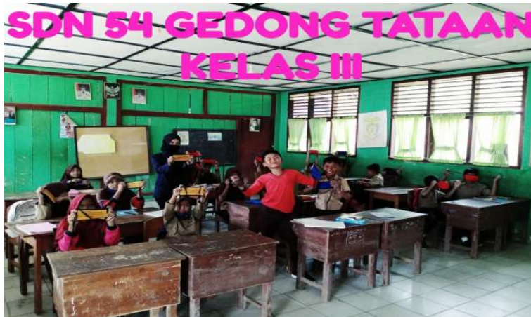
Gambar 2.3.1 membagi masker kepada siswa

COVID-19, pengabdian melakukan penyaluran media edukasi dan sosialisasi pencegahan COVID-19 kepada anak-anak berupa memberikan masker dan penjelasan materi COVID-19 dan pengabdian menempelkan pamflet di dinding rumah warga. Kegiatan ini dilakukan agar masyarakat yang ada di Desa Sungai Langka mematuhi protokol kesehatan COVID-19 dan terhindar dari COVID-19.