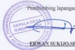
ERWAN SUKLIO, SP