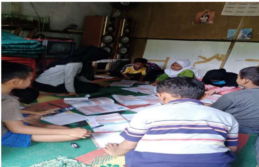
Gambar 2.3.5 pendampingan siswa-siswi di rumah

dalam melakukan pendampingan siswa/siswi di sekolah maka pengabdian juga memberikan sedikit penjelasan sedikit tentang materi yang di beri oleh guru di sekolah.