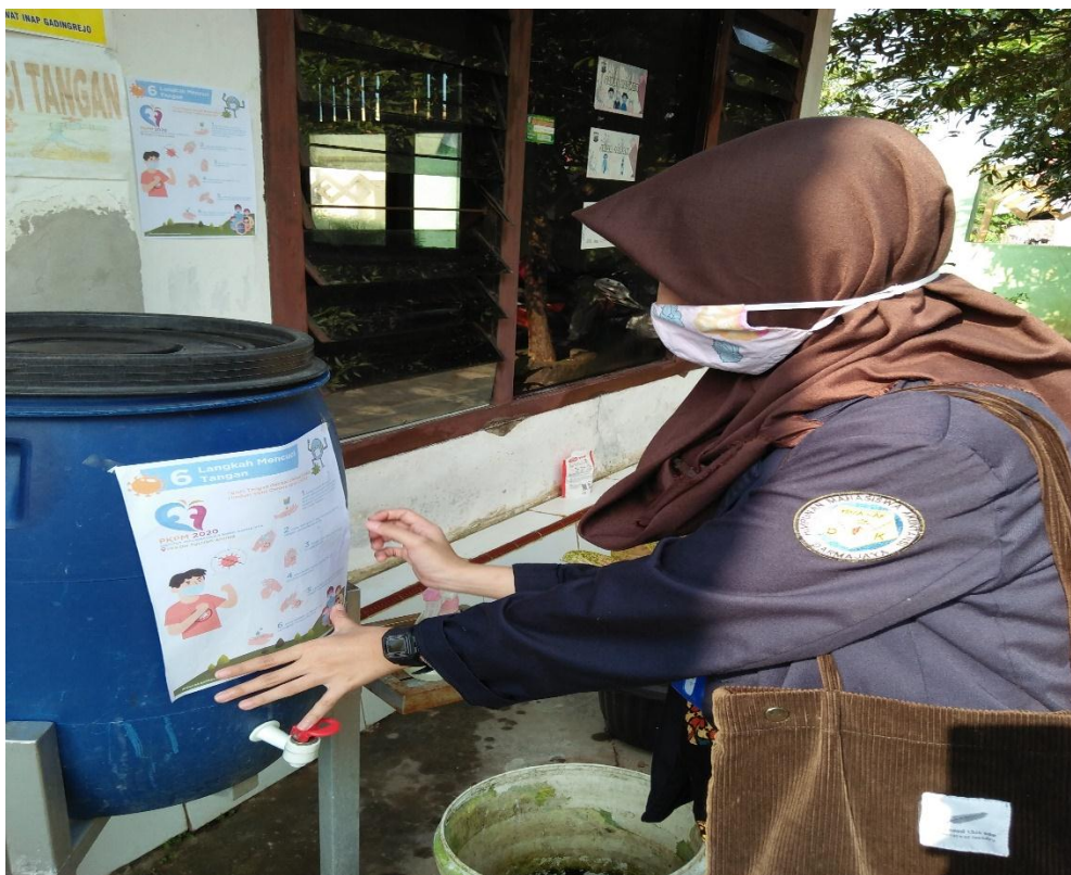
Gambar 6: Membagikan Pamflet mengenai Cuci Tanga