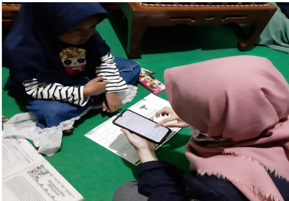
Gambar 4: Bimbingan Belajar daring