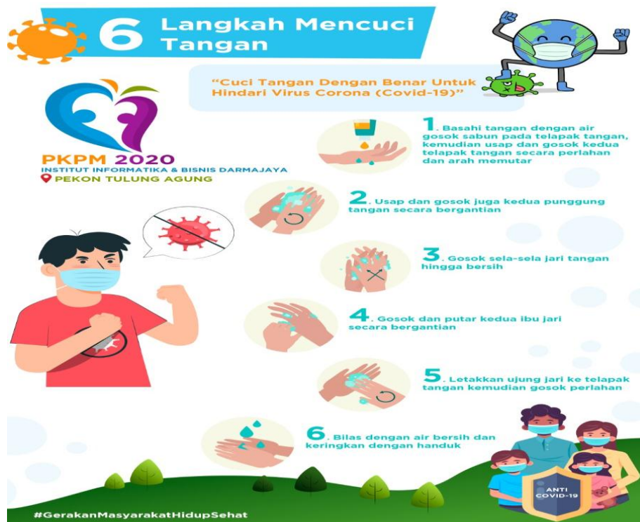
Gambar 2: Pamflet Langkah Cuci Tangan