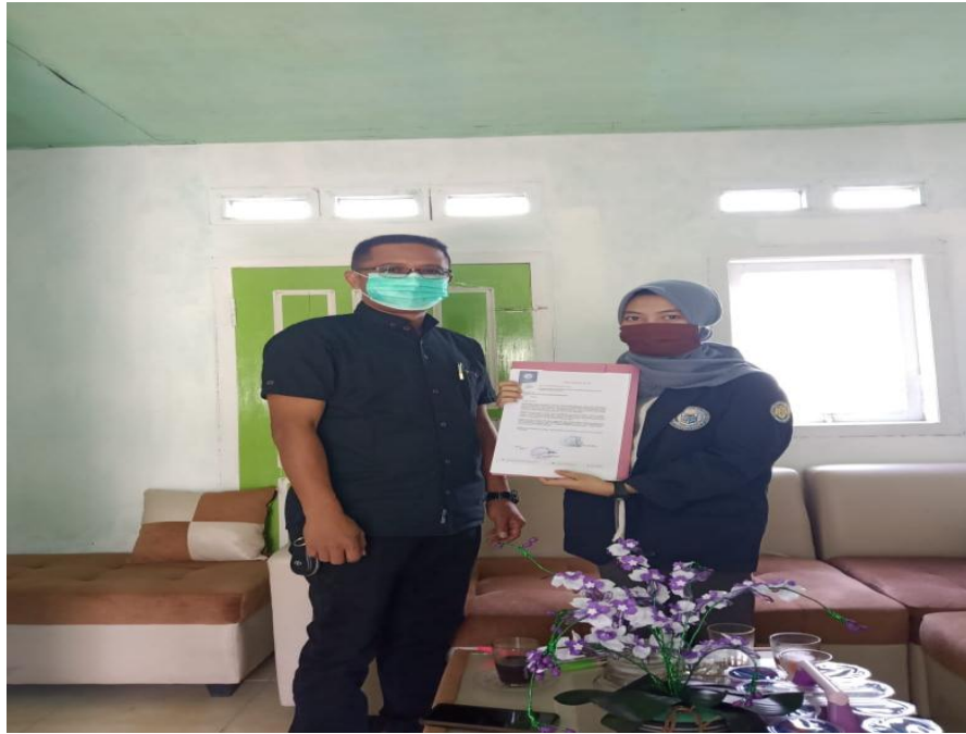
Gambar 1: Izin Pelaksanaan PKPM dengan Kepala Pekon Tulung Agung Bapak