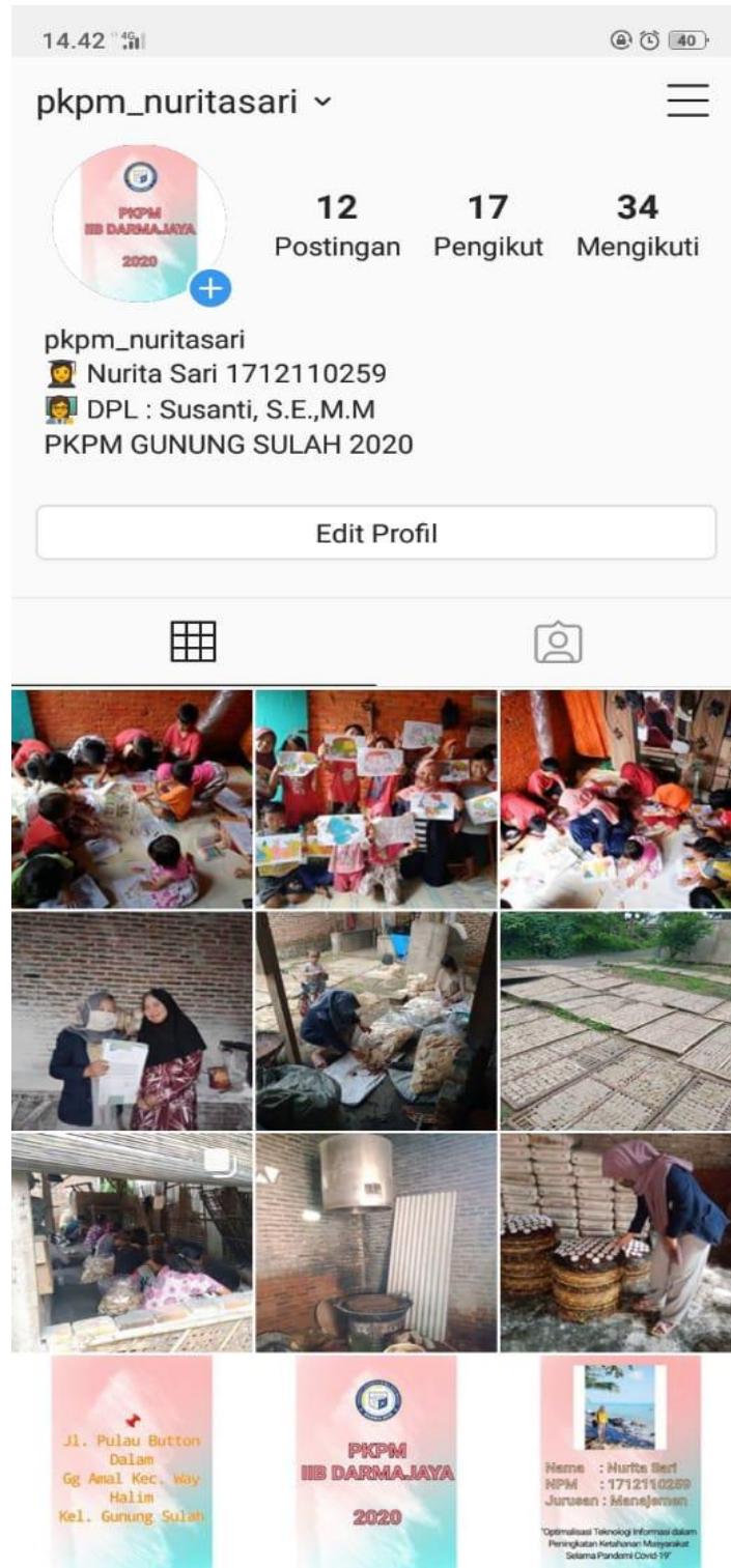
Gambar 2.11 Akun Sosial Media