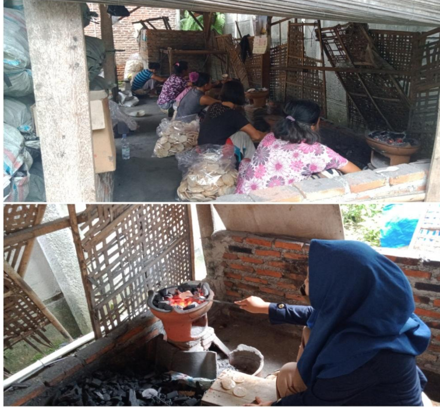
Gambar 2.9 Proses Pemanggangan