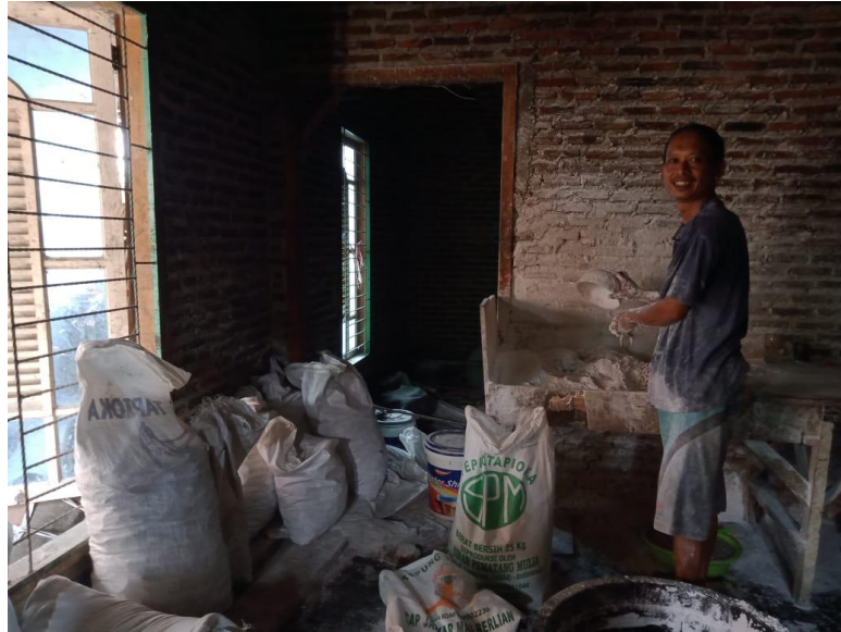
Gambar 2.5 Proses Pengadonan