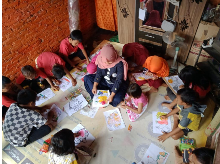
Gambar 2.3 Belajar Bersama