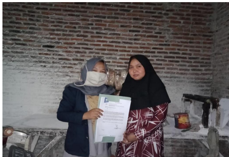
Gambar 2.2. Izin Kegiatan