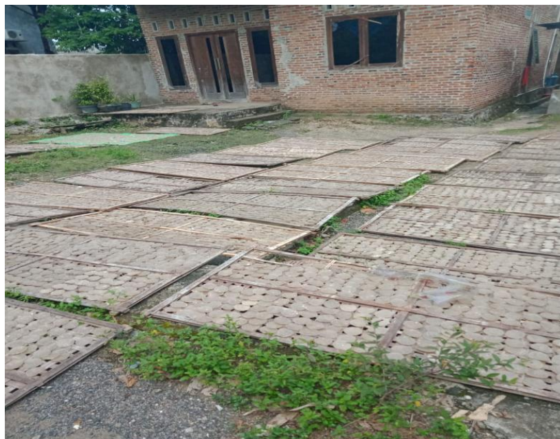
Gambar 2.8 Proses Penjemuran