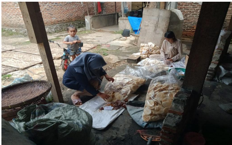
Gambar 2.10 Proses Pembungkusan