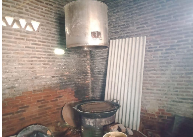
Gambar 2.7 Poses Perebusan