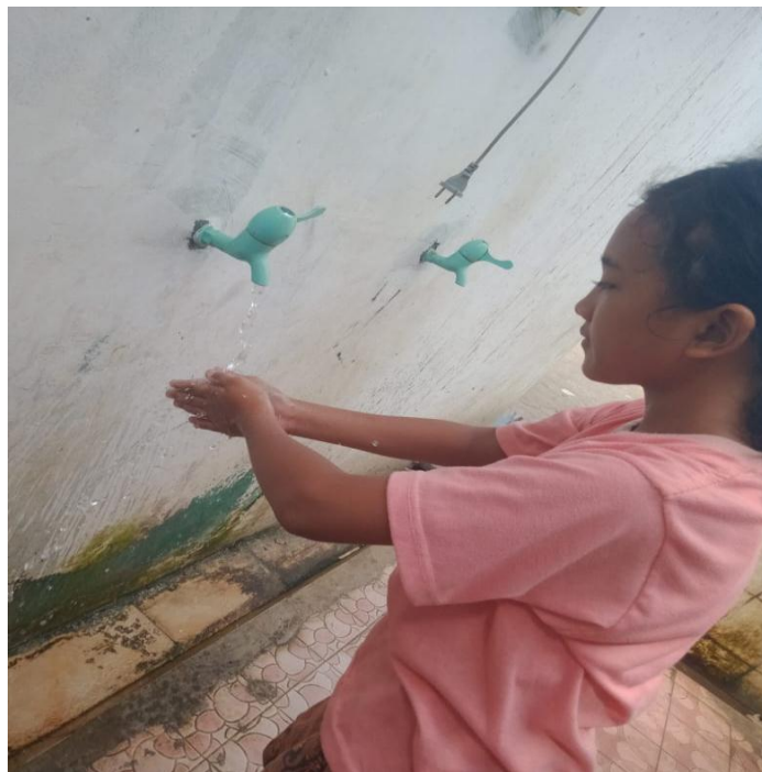
Gambar 2.4 Belajar cuci tangan