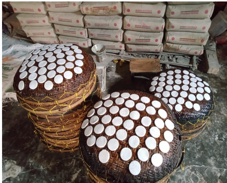
Gambar 2.6 Proses Pembentukan