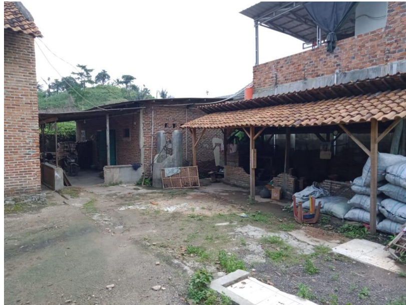
Gambar 2.1 Lokasi Kegiatan