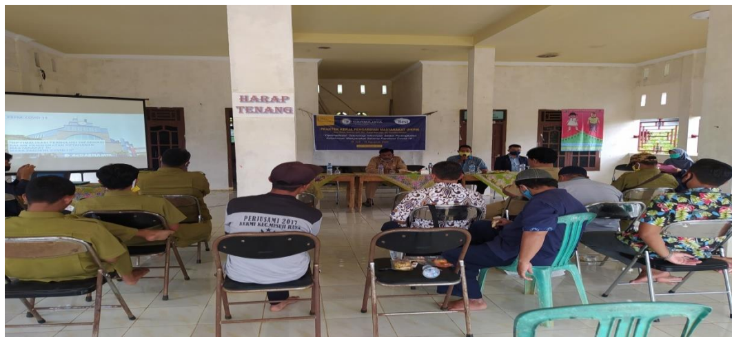
Gambar 12. Pembukaan acara PKPM di kantor Desa Balian Makmur

Kegiatan ini merupakan pembukaan dan meminta ijin kepada masyarakat Desa Balian Makmur untuk melakukan PKPM sekaligus menerapkan protocol kesehatan dan sosialisasi dengan masyarakat setempat untuk lebih memperhatikan protocol kesehatan di tempat umum.