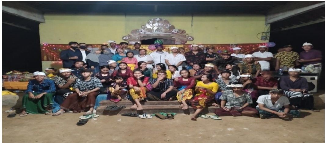
Gambar 13. Sosialisasi dengan karang taruna

Kegiatan adalah universary karang taruna yang ada di Balian Makmur sekaligus memperkenalkan kepada pemuda pemudi di sana kampus IIB Darmajaya dan sosialisasi ini merupakan karang taruna bali timur yang memang mayoritas semua warga suku bali.