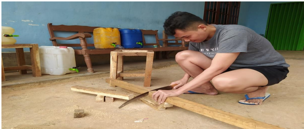
Gambar 15. Proses pembuatan APD cuci tangan

Kegiatan ini merupakan proses pembuatan APD cuci tangan untuk di berikan pada tempat yang ramai seperti tempat ibadah dan pasar, pembuatan kami lakukan dengan menggunakan drigen bekas yang kami lubagi bawah nya untuk di buat kan kerang air serta dudukan drigen atau alat cuci tangan dari kayu dan tak lupa kami membuat famplet cuci tangan untuk panduan cuci tagan yang baik dan benar.