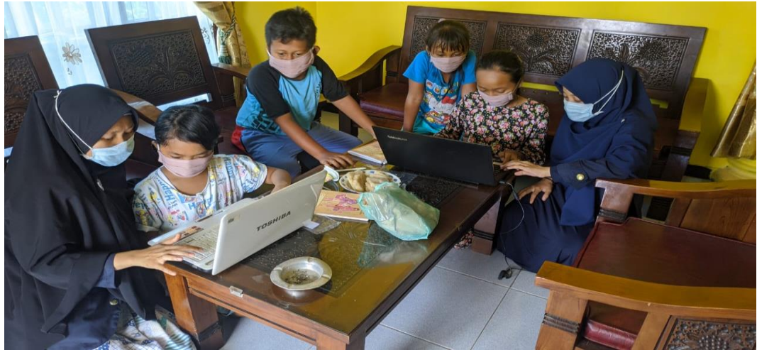
Gambar 21. Pendampingan siswa belajar daring

Kegiatan ini merupakan pendampingan siswa/siswi belajar dalam masa pandemic mereka harus menggunakan cara belajar daring di karenakan sekolah mereka belum boleh melakukan pembelajaran secara offline, kami mengajarkan cara menggunakan watsapp apk sebagai media yang di sarankan sekolah mereka untuk melakukan pembelajaran mengajarkan cara mengirim gambar dan membuat video serta mengirim rekaman suara dan file di watshapp apk.