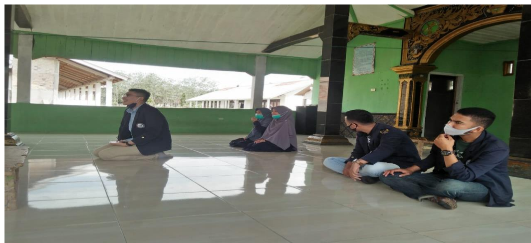
Gambar 14. Sosialisasi pondok pesantren yang ada di Desa Balian Makmur