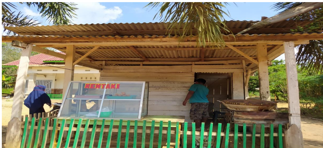
Gambar 17. Pendampingan UMKM

Kegiatan ini merupakan pendampingan UMKM kentaki jair, kami mencoba menawarkan penjualan dengan sistem online dan baner sehingga kapan pun ada orang yang memesan akan bisa menerima orderan dari melalui via telepon kami juga memberikan inofasi rasa dan tempat yang menarik sehingga meningkatkan