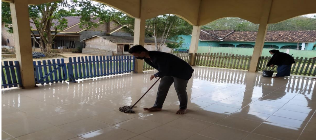
Gambar 20. Gotong royong di lingkungan Desa Balian Makmur

Kegiatan ini merupakan pembersihan di tempat ibadah dan di lingkungan kantor Desa kami juga memperindah halaman Desa dengan menggunakan ban bekas yang kami cat sebagai media tanam bunga dan mengecat pagar serta taman.