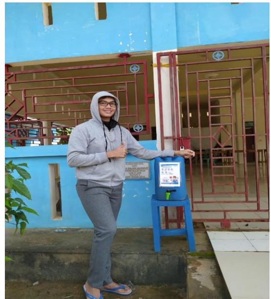
Gambar 16. Pembagian APD

Kegiatan ini merupakan pembagian APD di pusat keramaian di tempat ibadah seperti Masjid, Pure, Gereja serta di kantor Desa dan di Pasar, Kami juga membagikan masker kepada masyarakat Desa Balian Makmur serta aparat Desa yang terus bekerja melayani masyarakat seperti di kantor dan di sekolah.