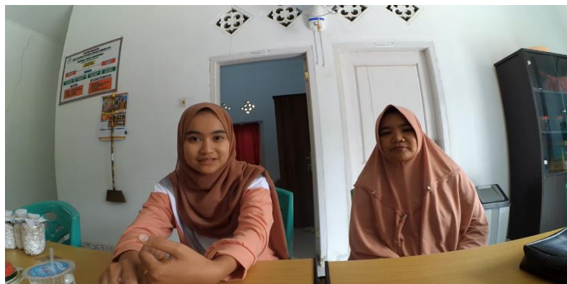
Gambar 10. Wawancara dengan Pelanggan Tetap P4S Budidaya Jamur Tani Mitra Mandiri