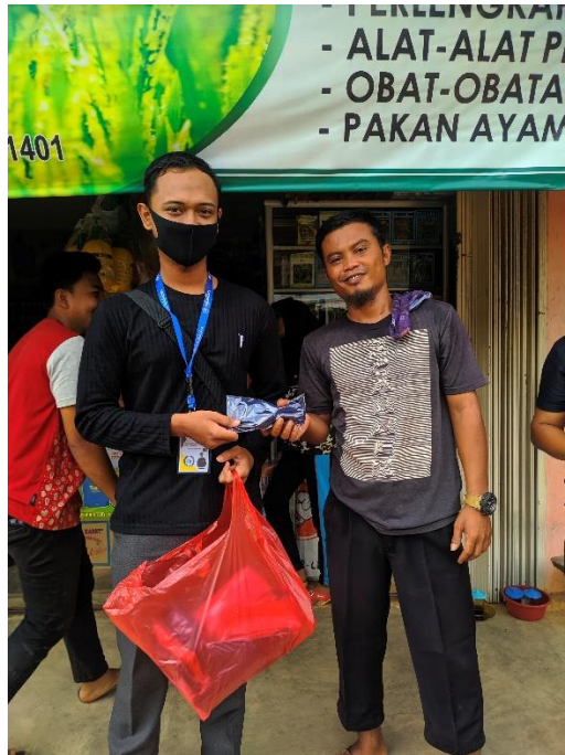
Gambar 3 . Pembagian APD ( Masker)

Kegiatan ini dilaksanakan pada minggu kedua, pada hari Minggu, 2 Agustus 2020. Masker didapatkan dari salah satu E-Commerce besar di Indonesia yaitu Shopee. Kurang lebih sekitar 95 masker telah dibagikan di sekitar pasar Bangunrejo.