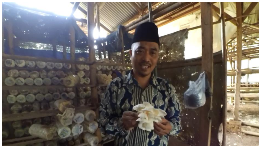
Gambar 7. Pembuatan Konten Pengembangan UMKM P4S Budidaya Jamur Tani Mitra Mandiri