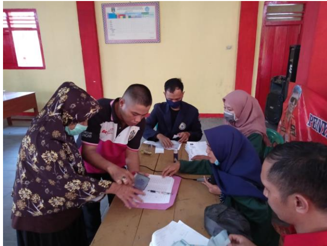
Gambar 1 . Pendataan Penduduk