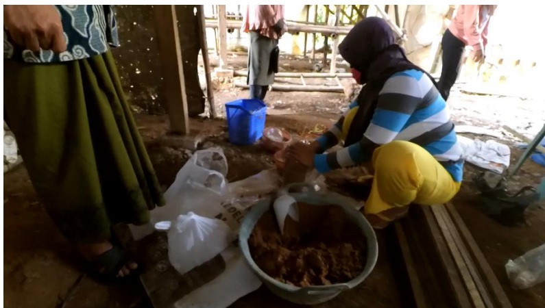
Gambar 8. Pembuatan Bibit Jamur