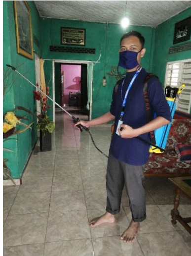
Gambar 4 . Penyemprotan Desinfektan di Area Rumah