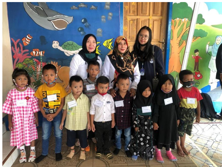
Gambar 1.4 Foto Bersama Anak-Anak Berserta Kepala Sekolah dan Guru