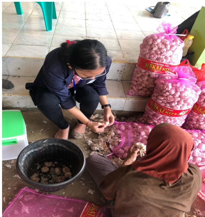
Gambar 1.1 Proses Membersihkan kulit Bawang Putih