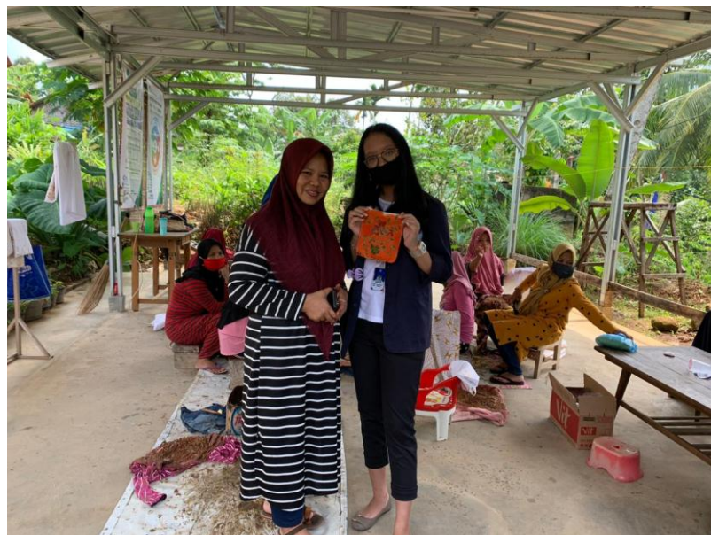
Gamabar 3.2 Foto Bersama Pemilik Batik Tulis