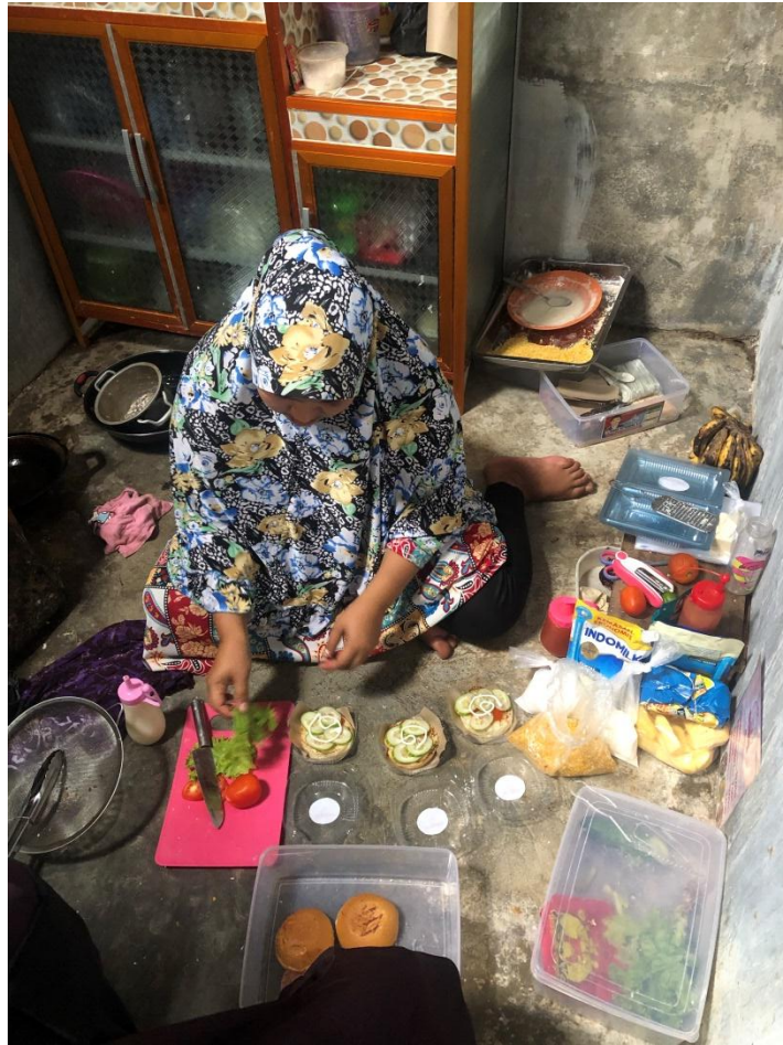
Gambar 2.4 Proses Pembuatan Makanan