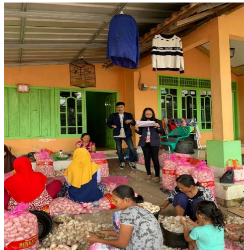
Gambar 1.2 Memberikan arahan tentang COVID-19