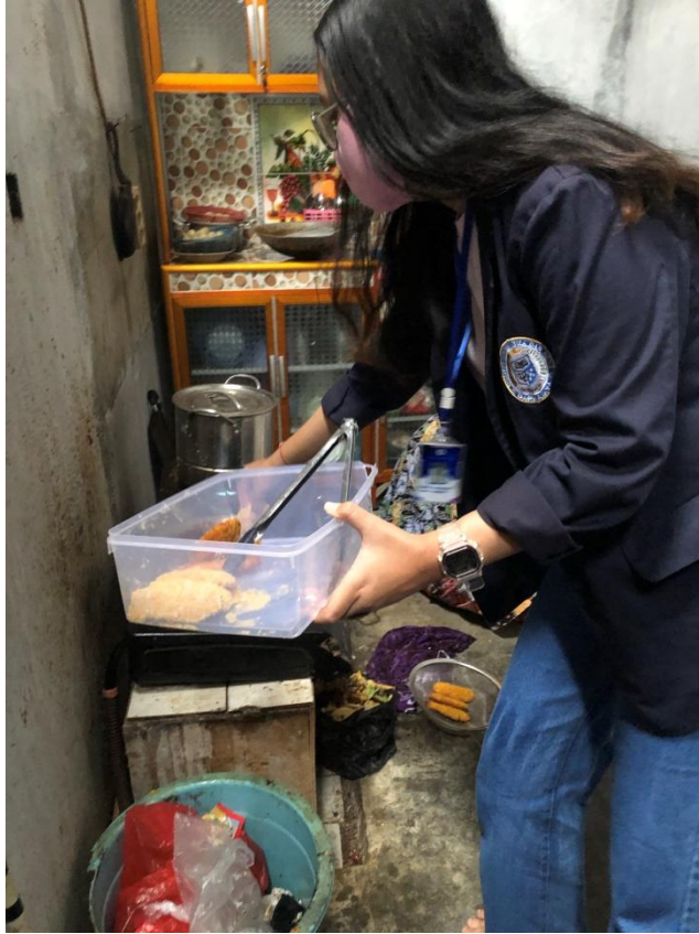
Gambar 2.5 Proses Penggorengan