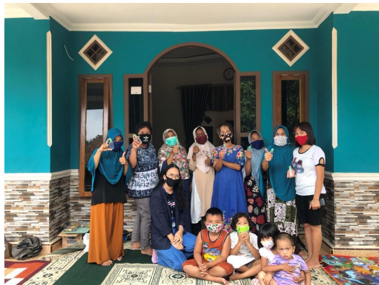
Gambar 2.2 Foto bersama ibu-ibu