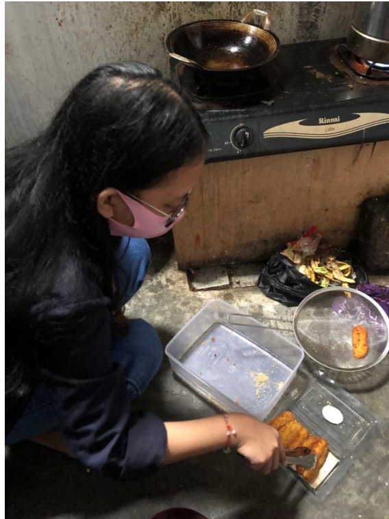
Gambar 2.6 Proses Pembukusan