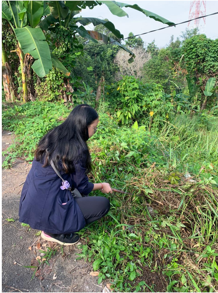
Gambar 2.3 Membersihkan tanaman liar