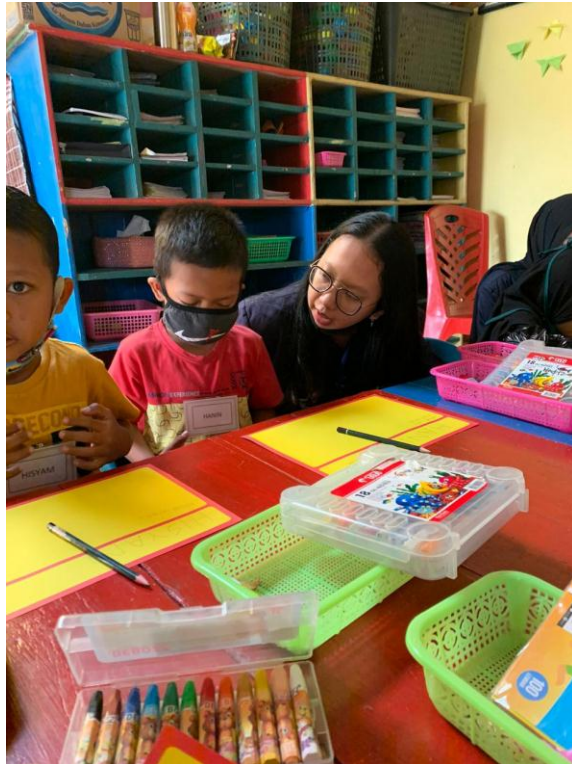
Gambar 1.3 Proses Belajar di Paud