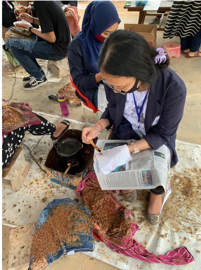
Gambar 3.1 Proses MenCutting