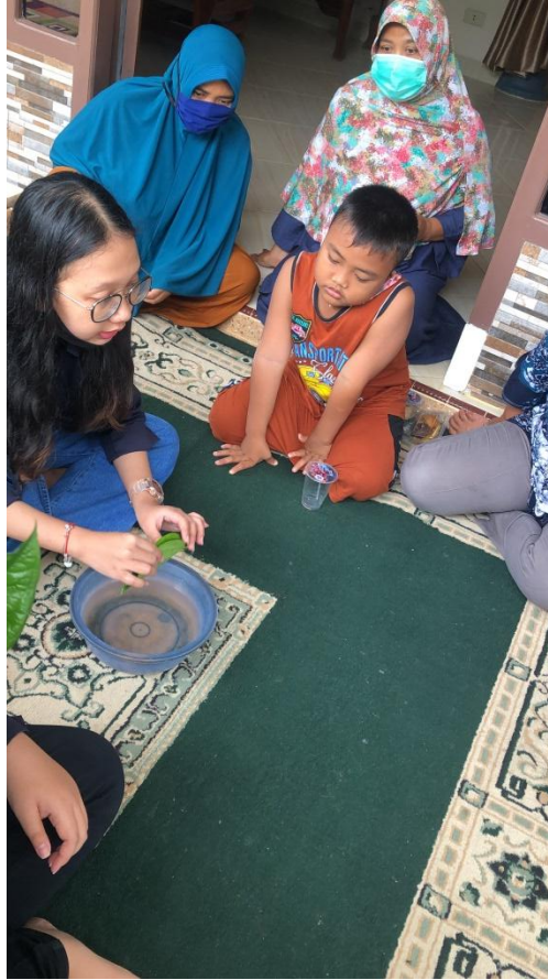
Gambar 2.1 Menjelaskan Cara Pembuatan Handsanitezer