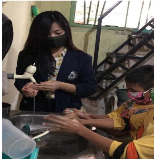
Gambar 2.3 6 Sosialisasi Gerakan Cuci tangan