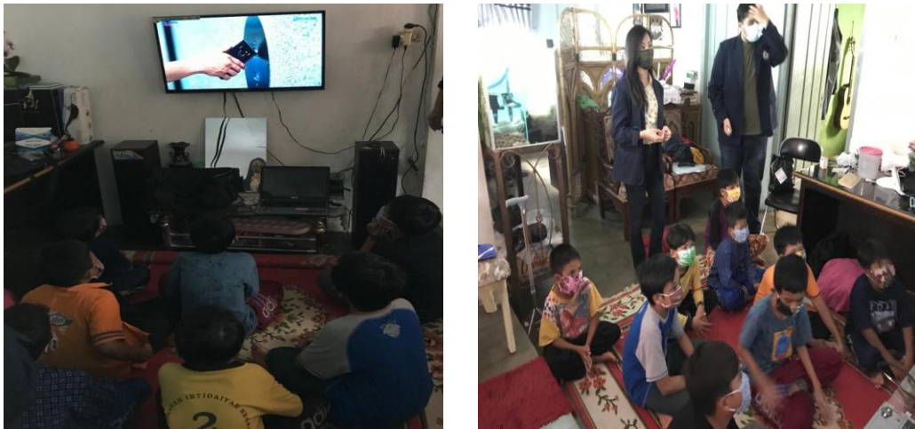
Gambar 2.3 4 Sosialisasi memberi vidio Edukasi Pencegahan COVID-19