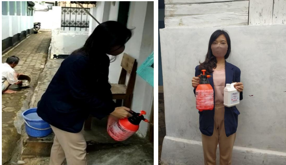
Gambar 2.3 3 Penyemprotan Disinfektan di rumah warga

penyebaran COVID-19 karna dapat mensterilkan lingkungan sekitar.