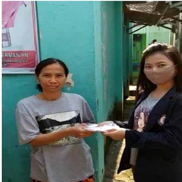
Gambar 2.3 2 Pembagian Alat Pelindung Diri berupa Masker

satu upaya terbaik yang dilakukan guna memutus rantai penyebaran COVID-19. Pembagian masker ini juga diharapkan dapat membuat warga agar lebih disiplin untuk selalu menggunakan masker setiap keluar rumah atau melakukan kegiatan lainnya.