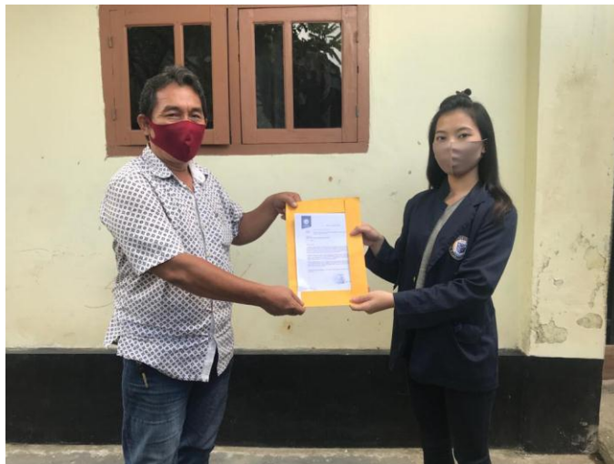
Gambar 2.3 1 Melakukan perizinan kepada RT

Dalam kegiatan keberlangsungan Praktek Kerja Pengabdian Masyarakat (PKPM) diperlukan adanya perizinin terlebih dahulu agar kegiatan PKPM yang akan dilaksanakan berjalan dengan lancar dan warga sekitar juga dapat mengetahui kegiatan yang dilakukan oleh mahasiswa/I Praktek Kerja Pengabdian Masyarakat (PKPM).