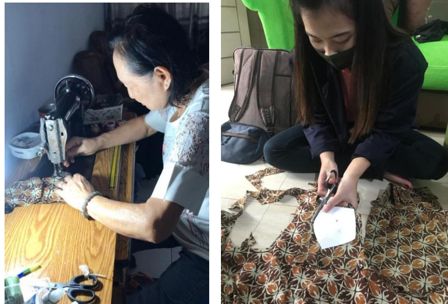
Gambar 2.3 5 Mengikuti kegiatan proses Pembuatan Masker