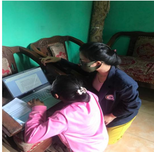
Gambar 2.3 7 Kegiatan Pendampingan Belajar di rumah

proses belajar daring dirumah serta menambah ilmu pengetahuan bagi anak-anak warga sekitar.