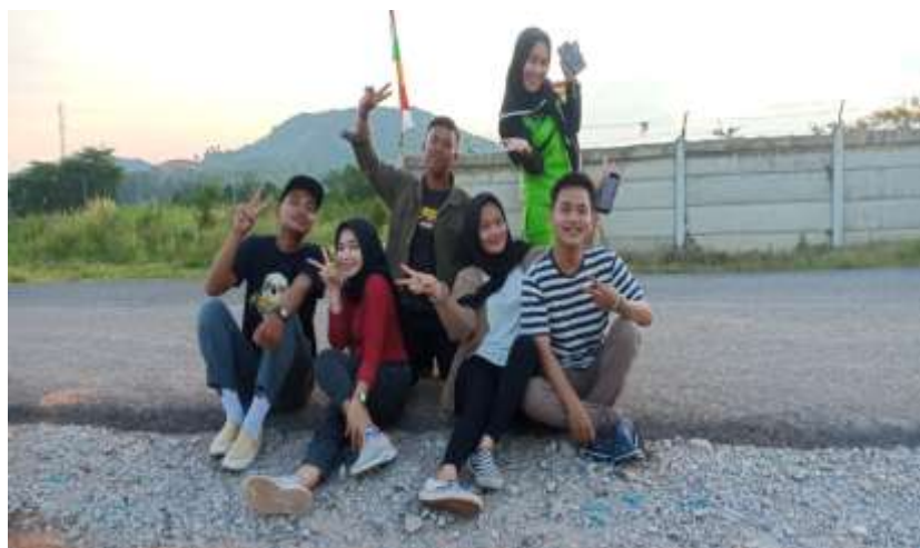
( Bersama Ibu RT sehabis senam, BalaiDesaLematang )