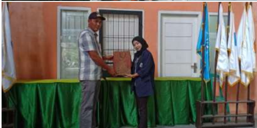
( Pemberian Cendramata Kepada Kepala Desa, BalaiDesaLematang )