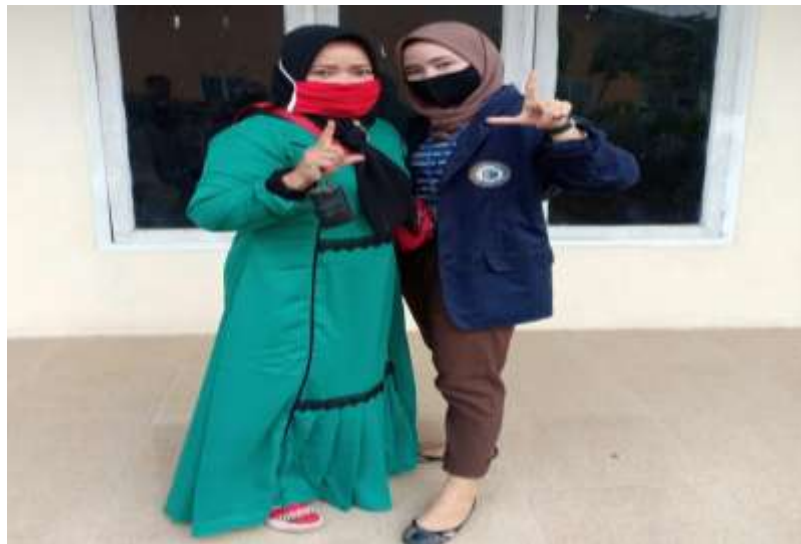
( Kegiatan Sosialisasi, Balai Desa Lematang )