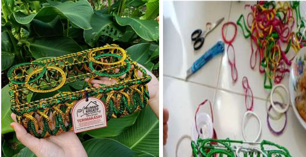
Gambar 2.3.3 Inovasi Kerajinan Tangan Dengan Percampuran warna

Membantu Ibu-Ibu PKK dalam mengelola limbah sampah plastik menjadi kerajinan tangan dengan inovasi perpaduan warna