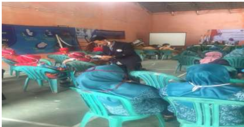
(Kegiatan Musdes Sekaligus Pembagian Masker dan Antis, Balai Desa Lematang)