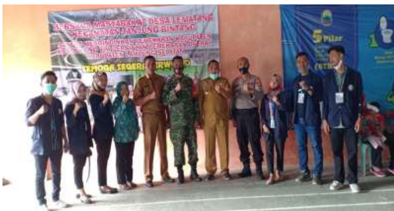
( Bersama Jajaran Dalam Acara Penyuluhan, Balai Desa Lematang )