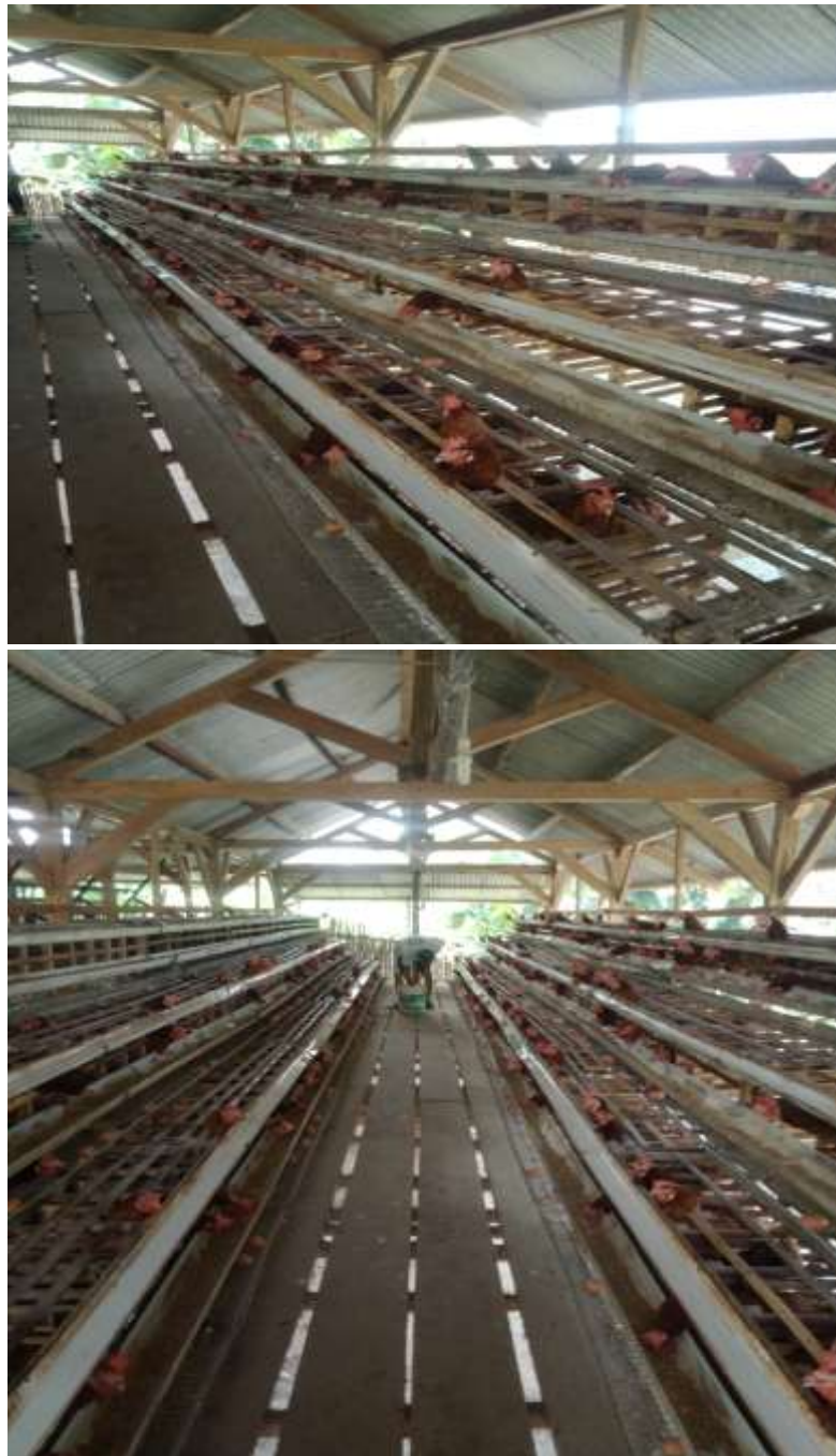
(Proses Pemanenan UMKM Peternak Ayam Ras Petelur 2020, Desa Lematang )