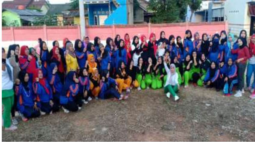
(Kegiatan Senam Jantung, Balai Desa Lematang)