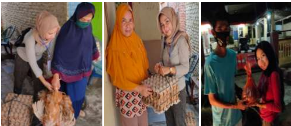
Gambar 2.3.6 Mengantarkan Pesanan Yang Memesan Lewat Media Sosial

Membantu pemilik UMKM dalam mengantarkan pesanan Ayam dan Telur kepada konsumen yang memesan lewat media sosial dan mengantarkan pesanan ke warung/toko.