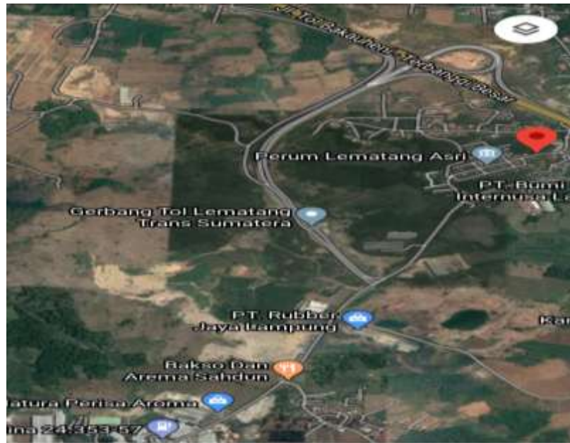
(Denah Lokasi Desa Lematang)