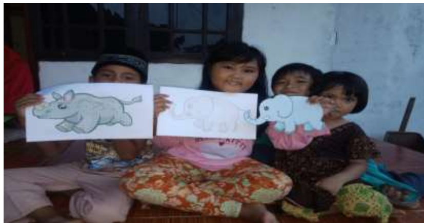
( Perbantuan Pembelajaran Online Menggambar, Posko/RumahWarga )