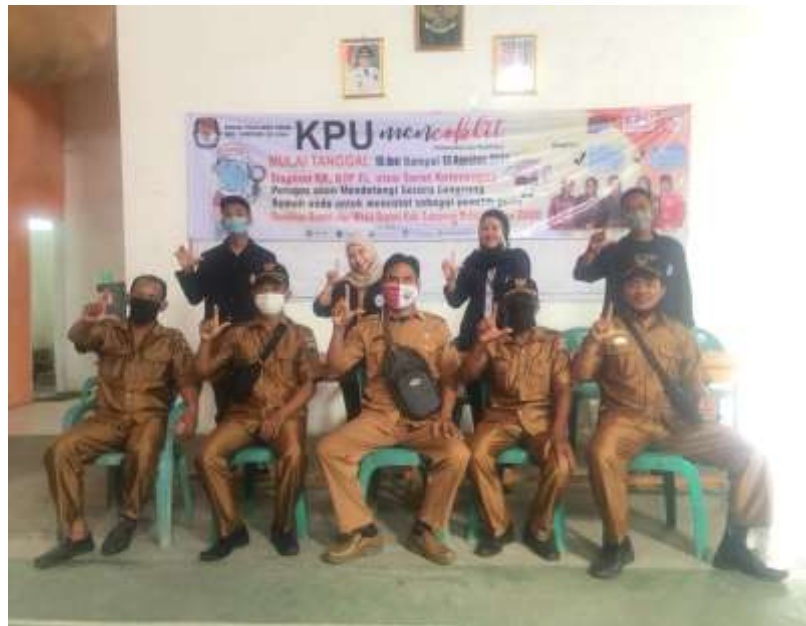
( Penyerahan Mahasiswa PKPM 2020, Balai Desa)