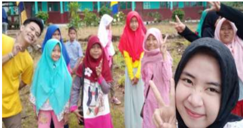
( Perbantuan Melatih Paduan Suara, SekolahanDesaLematang )