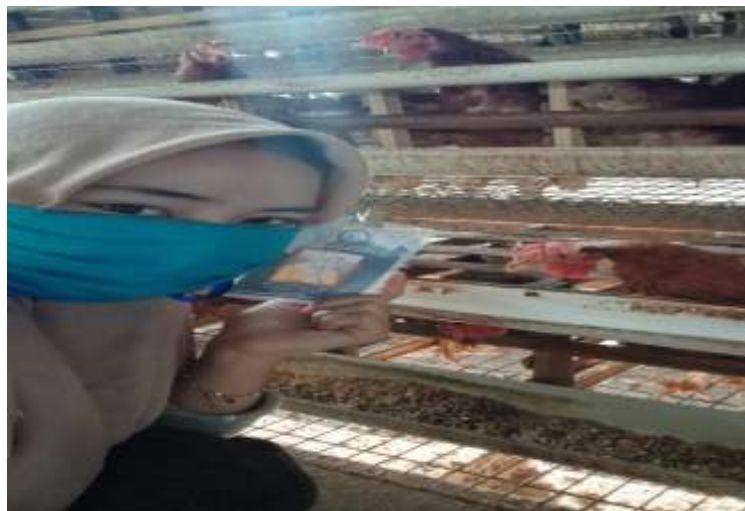
( Perkenalan dan hari pertama PKPM 2020, DesaLematang )