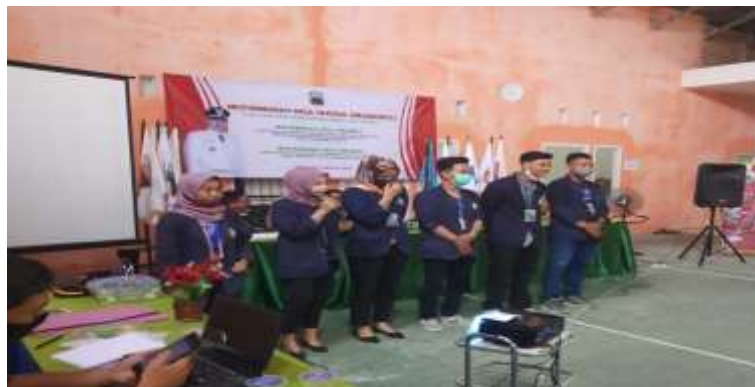
( Pemaparan Hasil Kegiatan UMKM, BalaiDesaLematang )