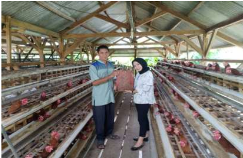
( Pemberian Cendramata Kepada Pemilik UMKM Peternak Ayam Ras Petelur, KandangAyamRasTelurDesaLematang )