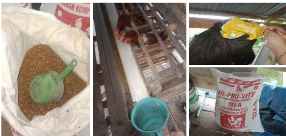
Gambar 2.3.4 Memberikan Makanan, Minuman Ayam dan Vitamin Telur

Memberikan Masker Dan Handstaitezer kepada pemilik UMKM Ayam Ras Petelur merupakan perlengkapan yang selalu dipakai ketika melakukan aktivitas di (kandang ayam) , dan membantu kegiatan dari memberikan makanan, minuman, vitamin dan membersihkan kandangnya.