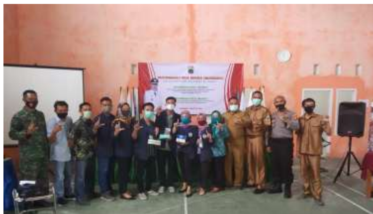
( Pembagian Masker Sekaligus Pamitan Berakhirnya PKPM, BalaiDesaLematang )