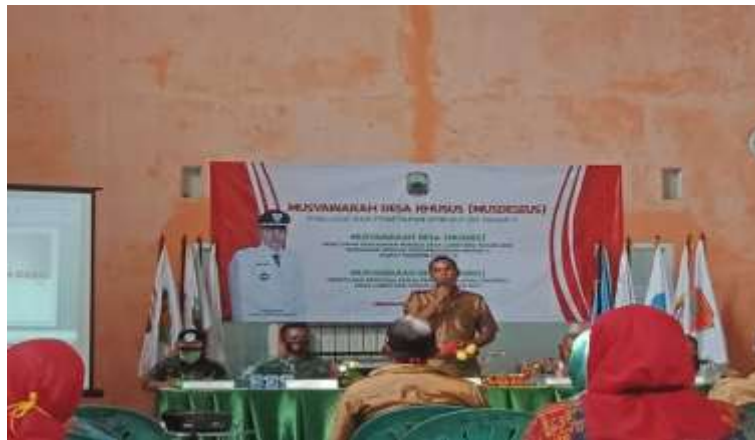
(Musyawarah Desa Khusus, BalaiDesaLematang )