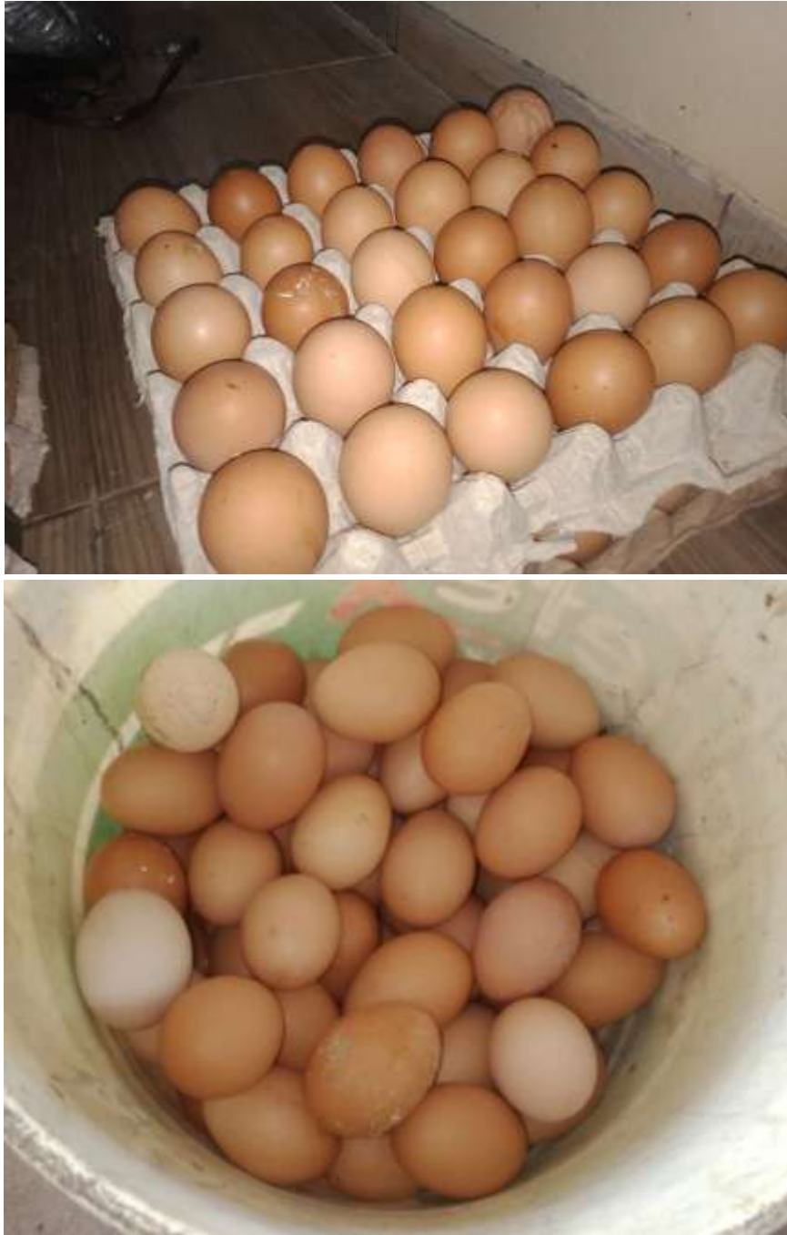
(Hasil Panen UMKM Peternakan Ayam Ras Petelur 2020, DesaLematang )