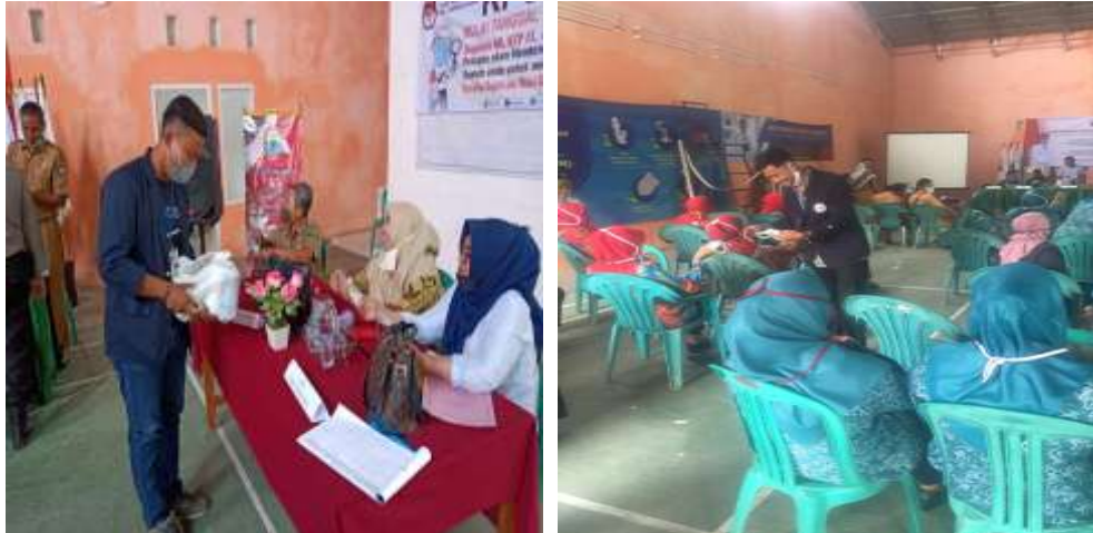
Gambar 2.3.1 Membagikan Masker dan Handstaitezer

Membagikan Masker dan Handstaitezer kepada masyarakat Desa Lematang dalam kegiatan acara rapat Musyawarah Desa dalam rangka kegiatan Penyuluhan Covid-19.