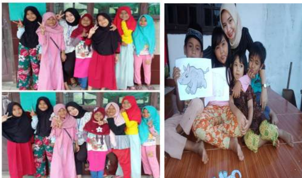
Gambar 2.3.2 Perbantuan Pembelajaran Online dan Paduan Suara

Membantu anak-anak dalam mengerjakan tugas online dari sekolah dan melatih anak-anak paduan suara untuk acara Upacara 17 Agustus.