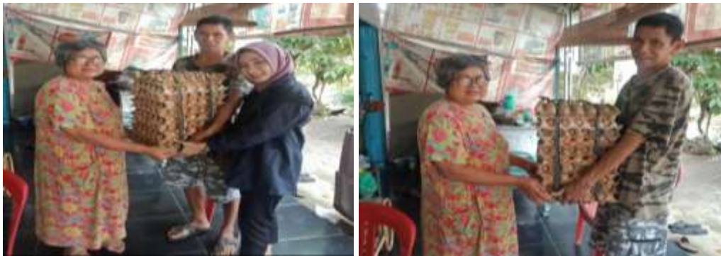
Gambar 2.3.7 Mengantarkan Pesanan Ke Toko/Warung