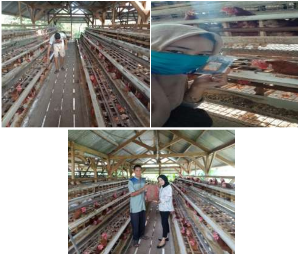
Gambar 2.3.5 Membersihkan Kandang dan Memberikan APD