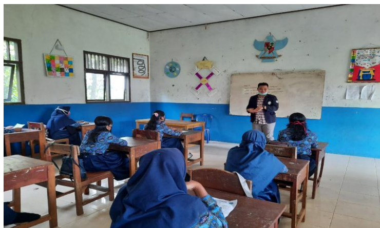
Gambar 2.1. Sosialisasi pencegahan Covid-19 secara langsung

Sosialisasi adalah upaya untuk memasyarakatkan sesuatu sehingga menjadi dikenal, dipahami, dihayati oleh masyarakat. sosialisasi pencegah penularan COVID-19 yang dimaksudkan adalah upaya yang dilakukan agar masyarakat paham dengan cara-cara terhindar dari potensi tertularnya COVID-19. Sosialisasi dapat dilakukan secara langsung ataupun tidak. Pencegahan Penularan COVID-19 berbasis sosialisasi dan edukasi merupakan salah satu cara trbaik dalam upaya pemutusan rantai penyebaran COVID-19.