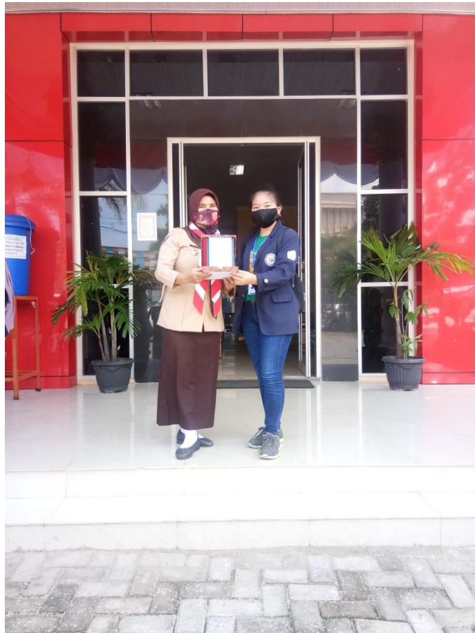
Saat penyerahan plakat kepada Kecamatan