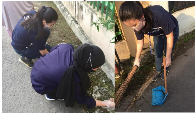
Gambar 11. Kegiatan Jumat Bersih