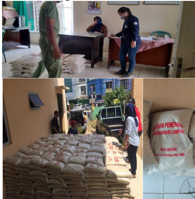
Gambar 13. Kegiatan Pendistribusian Beras