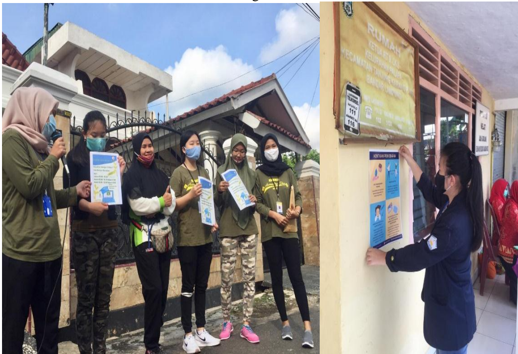
Gambar 9. Kegiatan Sosialisasi