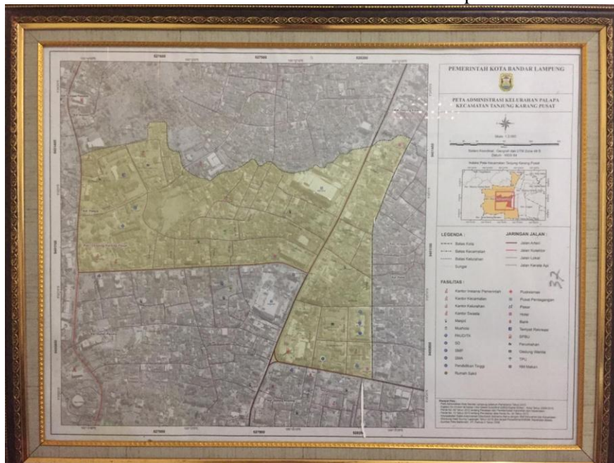
Gambar 1. Peta Lokasi Kelurahan Palapa