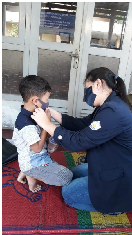
Saat pembagian masker anak-anak