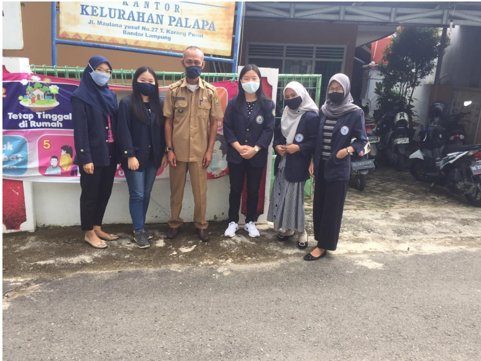
Perizinan PKPM ke Kelurahan Palapa