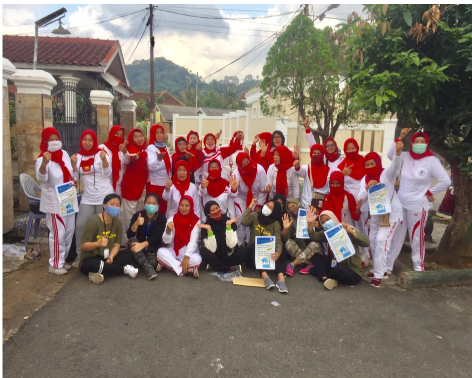
Foto bersama ibu-ibu senam sehat