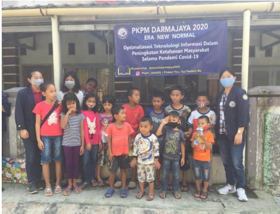
Foto bersama adik-adik pendampingan