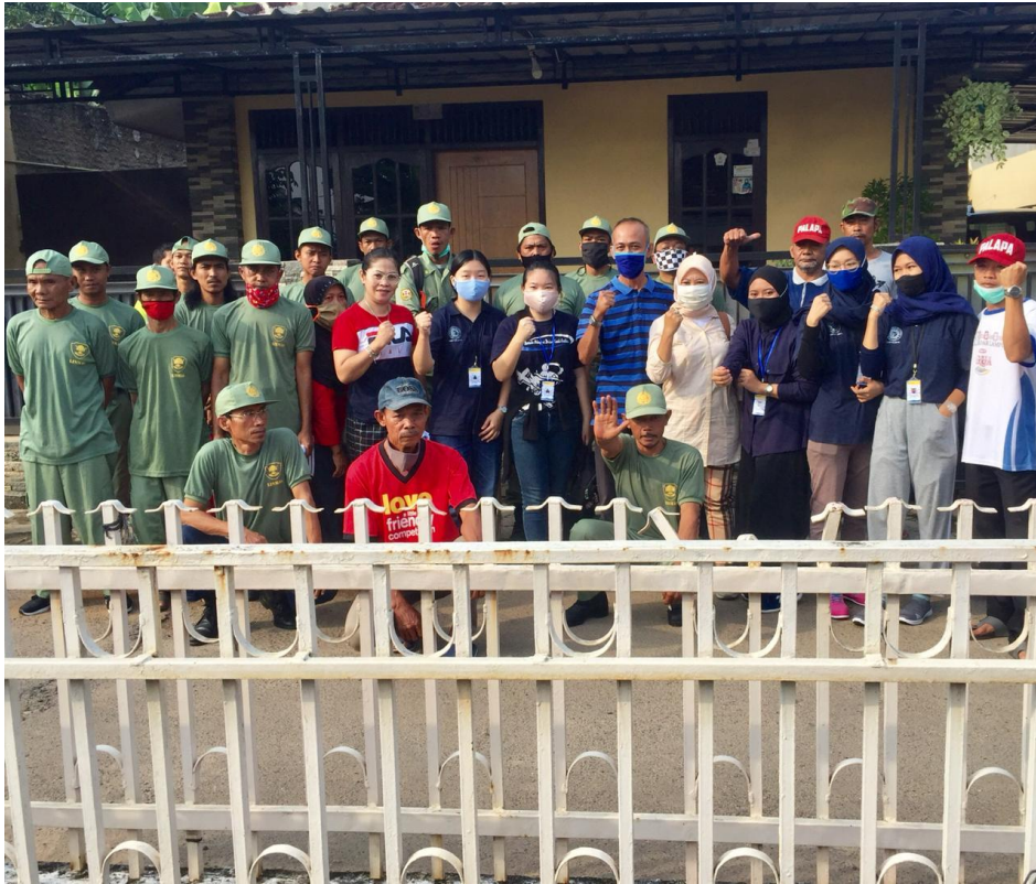
Foto bersama setelah kegiatan Jumat Bersih