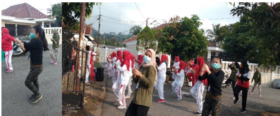
Gambar 12. Kegiatan Senam Sehat