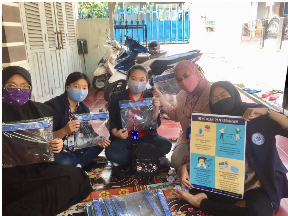
Pada saat persiapan faceshield