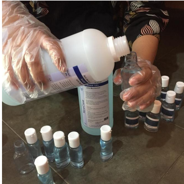
Pada saat persiapan Hand Sanitizer