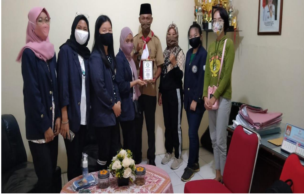
Saat penyerahan Plakat kepada Kelurahan