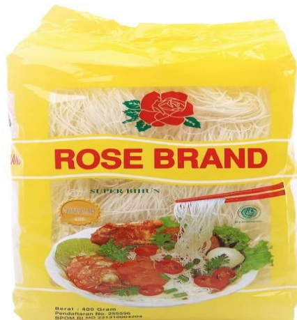
Bihun Rose Brand