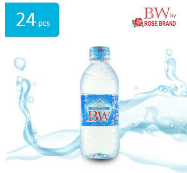
Gambar 2.3 Air Mineral Botol 600 ML