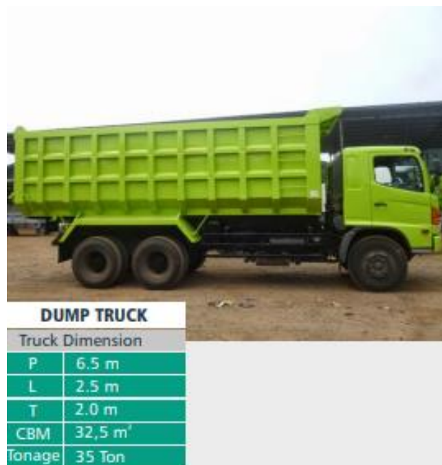
Gambar 2.1 Dump Truck