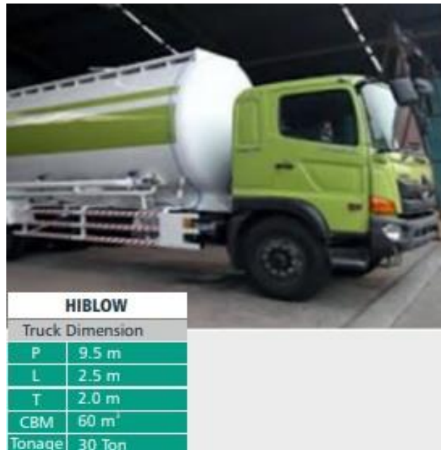
Gambar 2.3 Trailer Hiblow