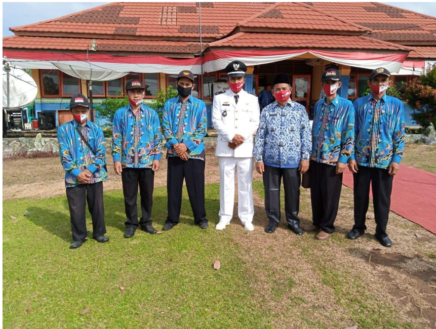
Gambar 2.14 Kepala Desa bersama staf melaksanakan upacara peringatan HUT