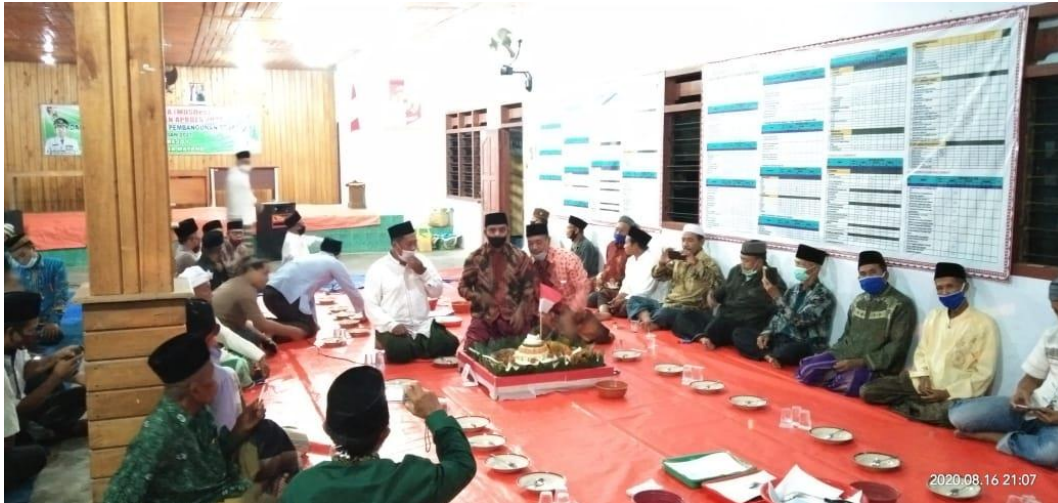
Gambar 2.12 Doa bersama serta pemotongan tumpeng dalam acara memperingati HUT RI ke 75