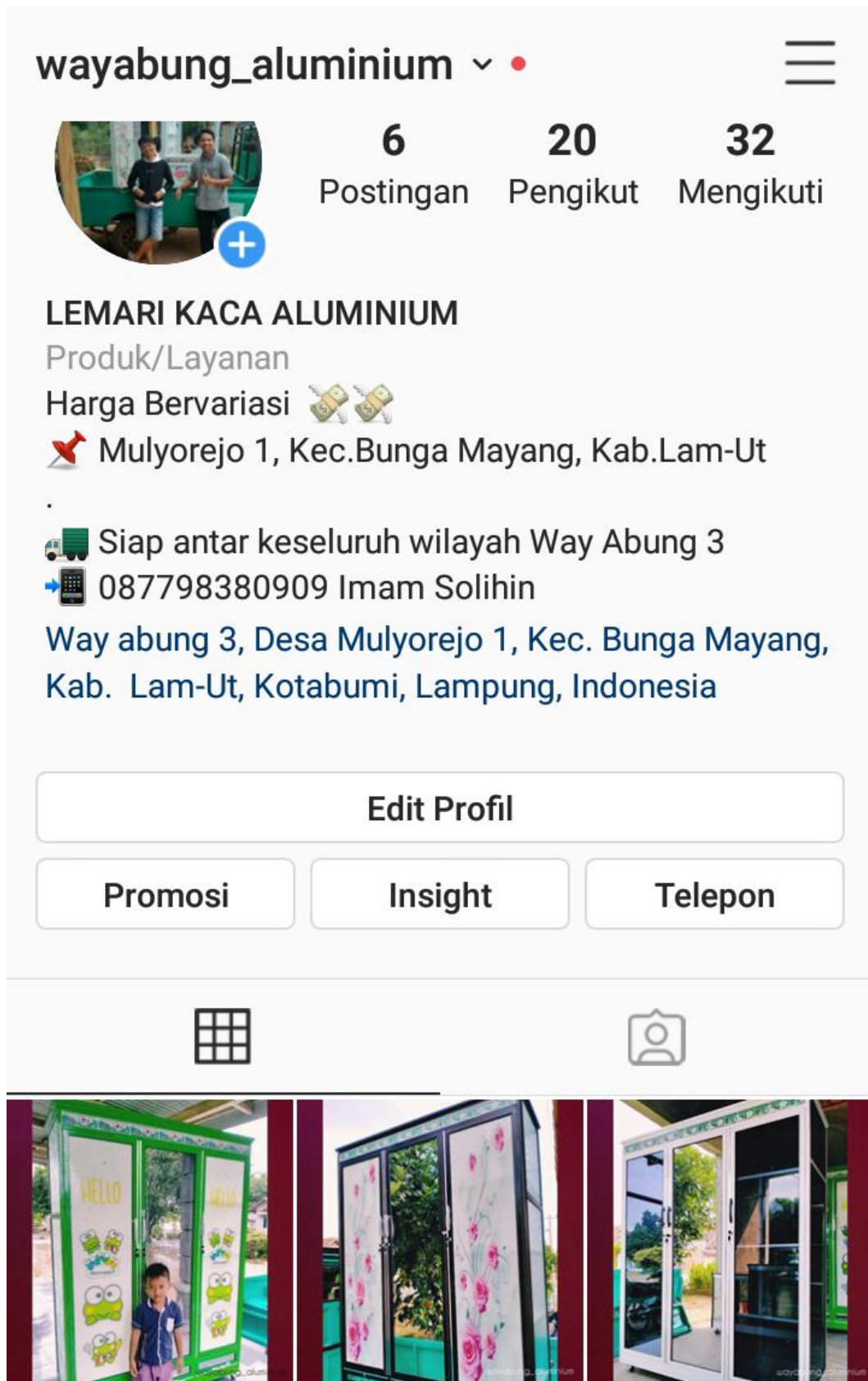
Gambar 2.5 Akun Instagram untuk mempromosikan produk