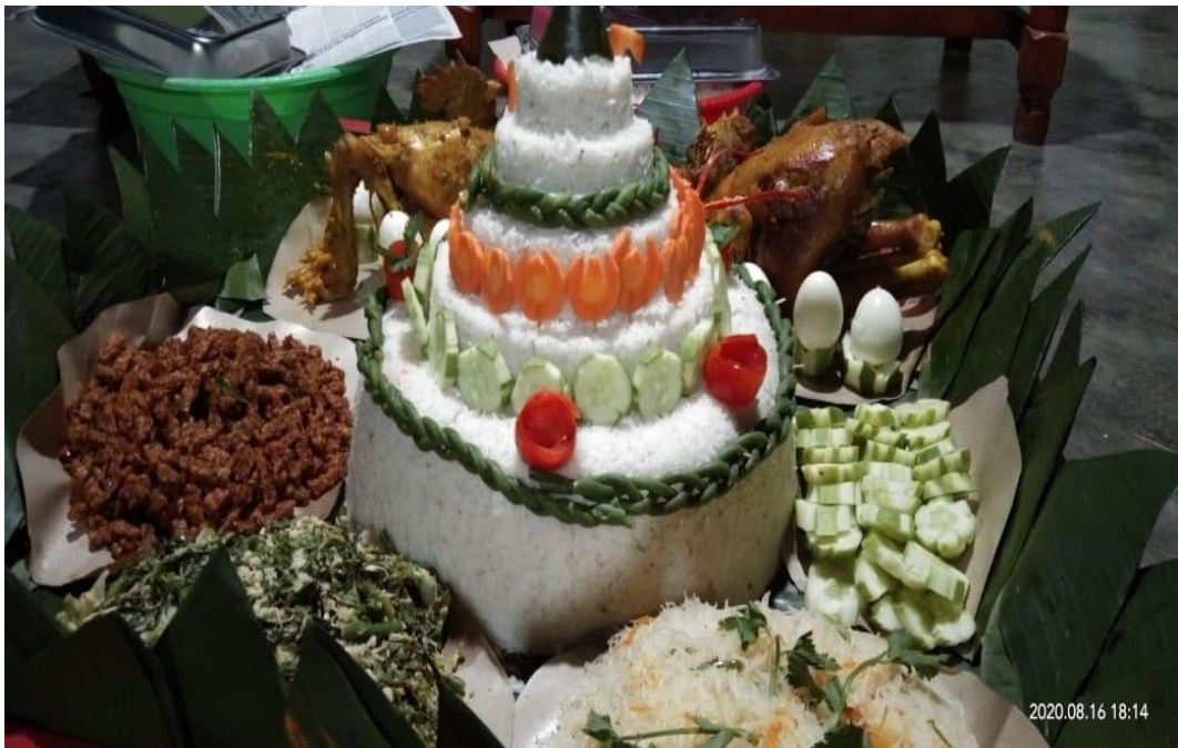
Gambar 2.11 Tumpeng