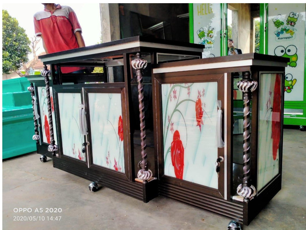
Gambar 2.9 Contoh produk dari UKM Lemari Kaca Aluminium