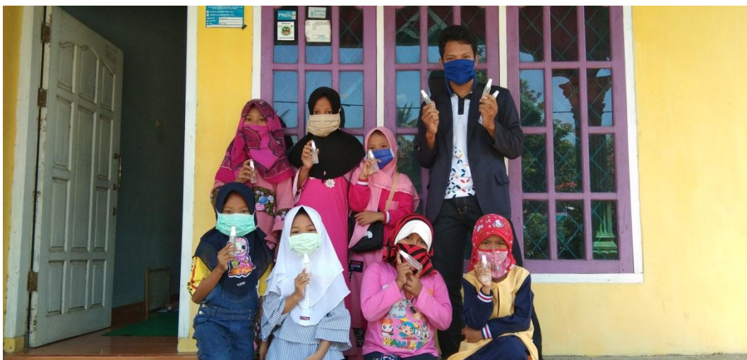
Gambar 2.6 Pembagian Hand Sanitizer kepada kelompok belajar