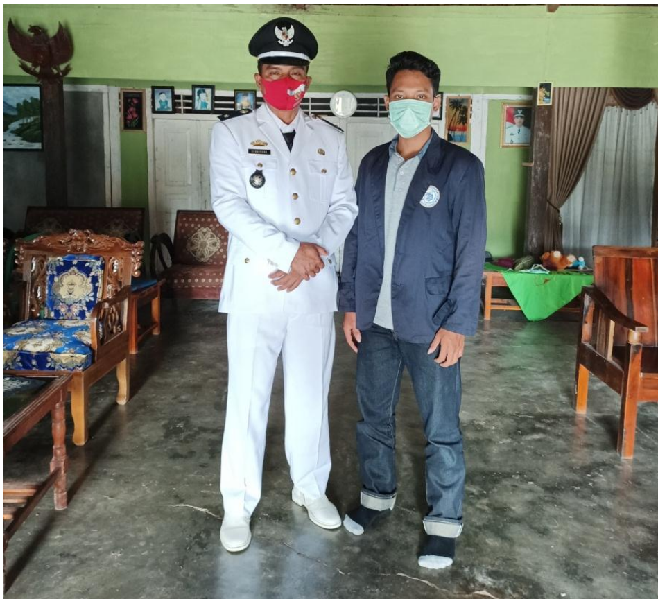
Gambar 2.13 Foto bersama Kepala Desa sebelum upacara di kecamatan