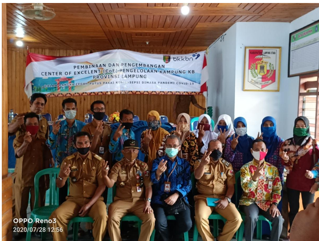
Gambar 2.4 Acara dari BKKBN Provinsi Lampung