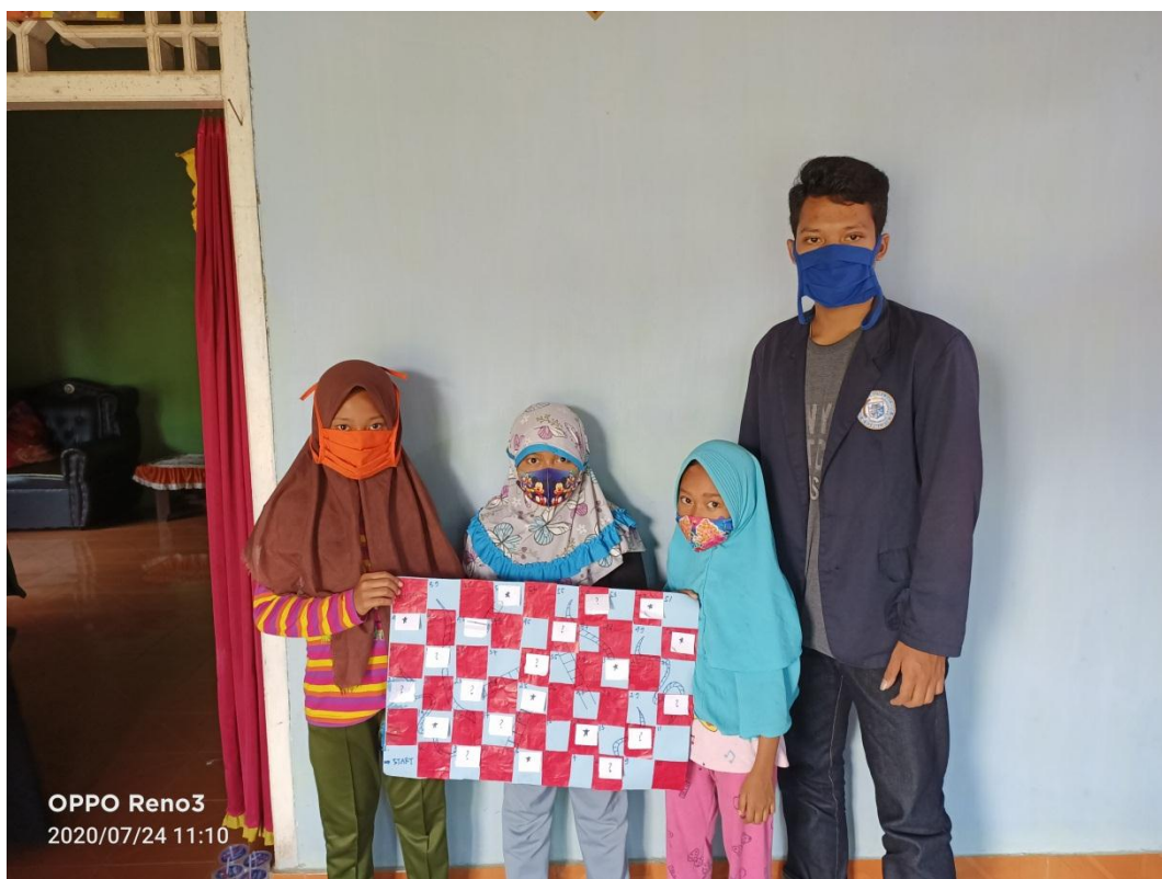
Gambar 2.2 Melakukan pendampingan kelompok belajar