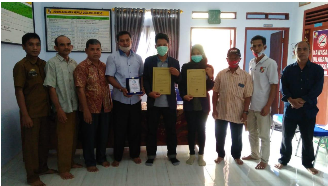
Gambar 2.16 Foto bersama Kepala Desa beserta staf