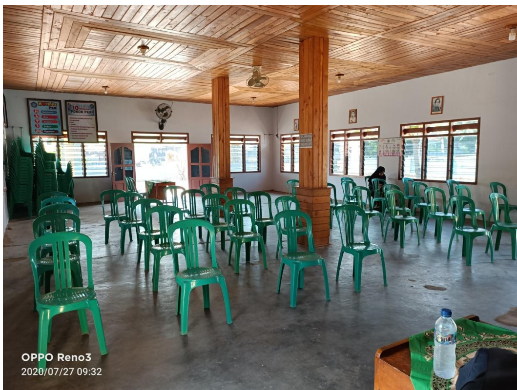
Gambar 2.3 Persiapan acara dari BKKBN Provinsi Lampung