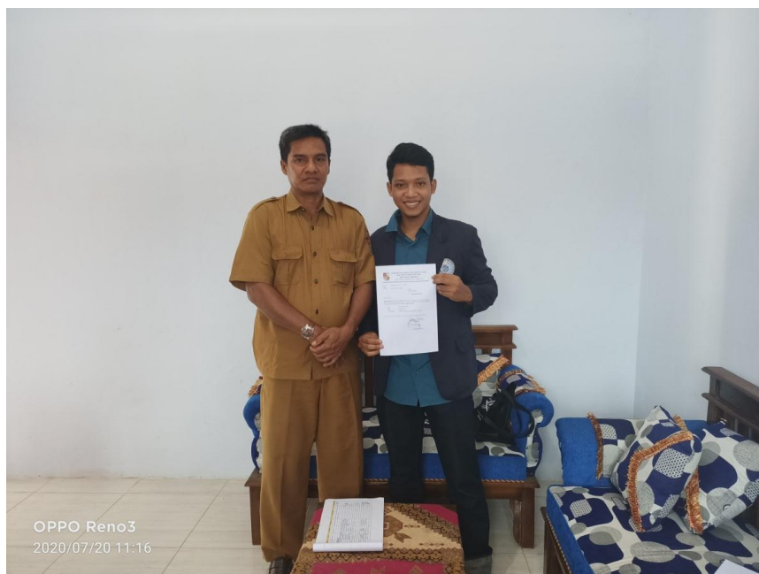
Gambar 2.1 Penyerahan surat pengantar dari kampus