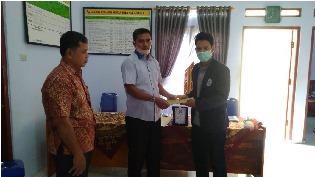
Gambar 2.15 Penyerahan laporan penilaian PKPM dari Kepala Desa