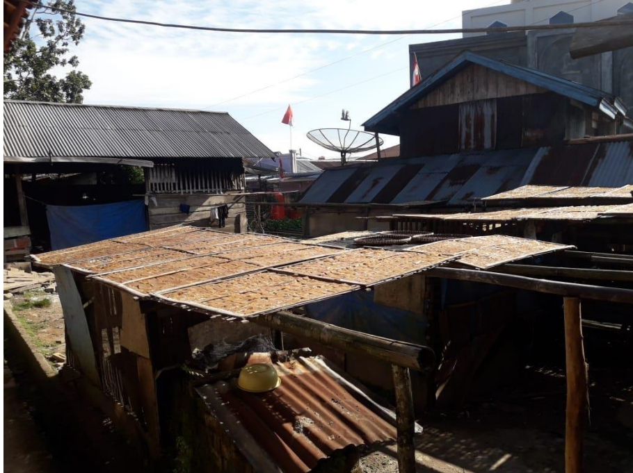
Gambar 1. 9 Proses pembuatan kerupuk