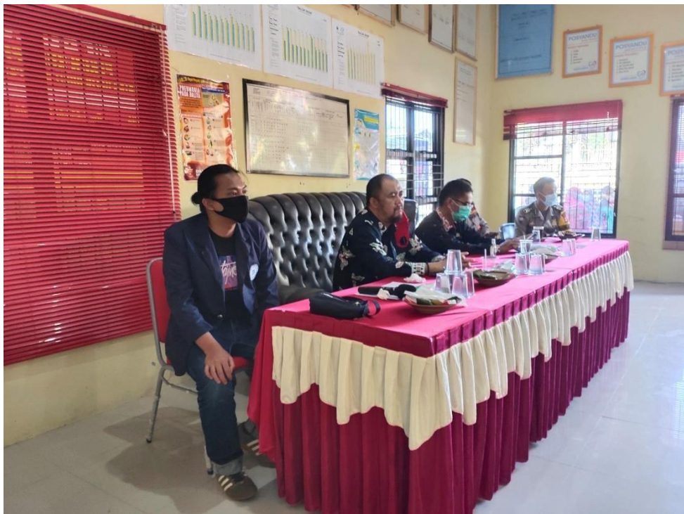
Gambar 1. 10 Foto bersama kepala desa