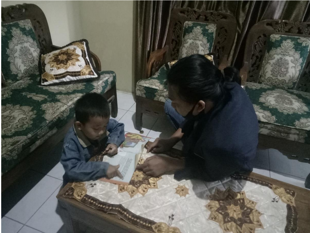
Gambar 1. 6 mengajar anak Tk