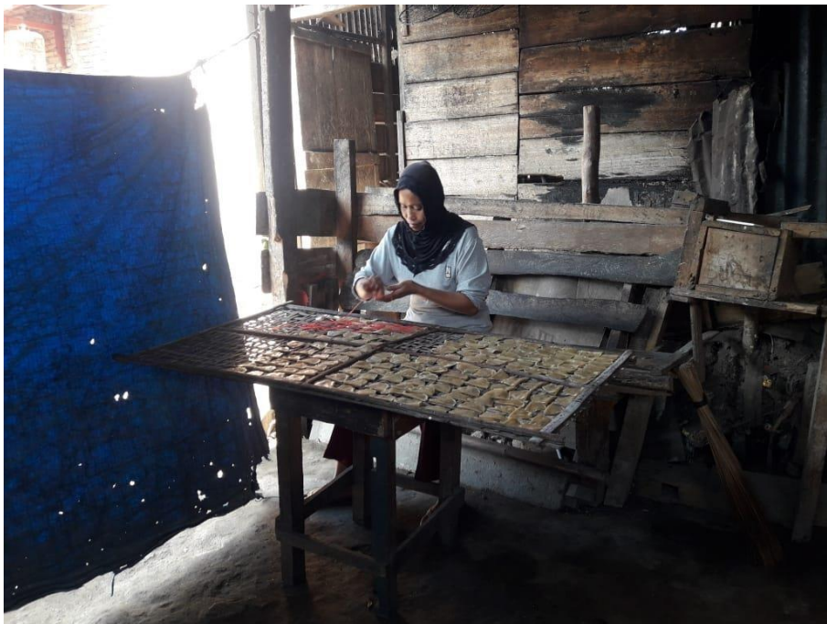
Gambar 1. 5 Pemotongan ukuran krupuk