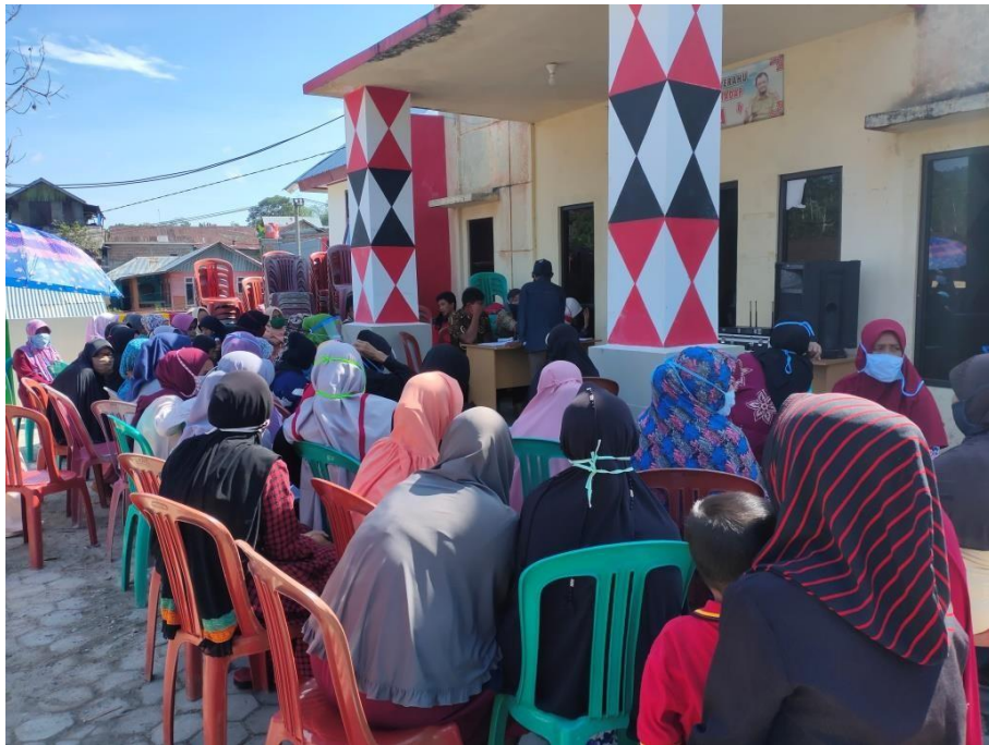
Gambar 1. 8 Antrian bantuan covid part 2