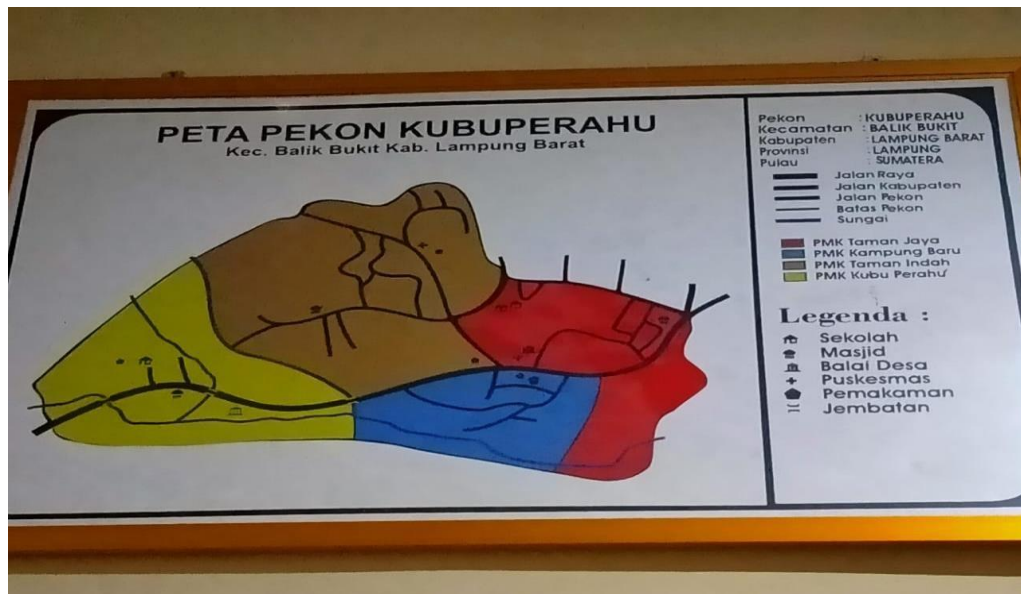
Gambar 1. 1 Peta desa pekon kubu perahu

Peta wilayah taman jaya pekon kubu perahu