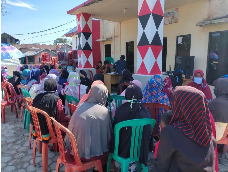
Gambar 1. 7 Antrian pembagian bantuan