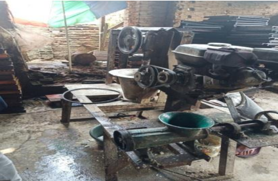
Gambar 1 Mesin pembuat kerupuk