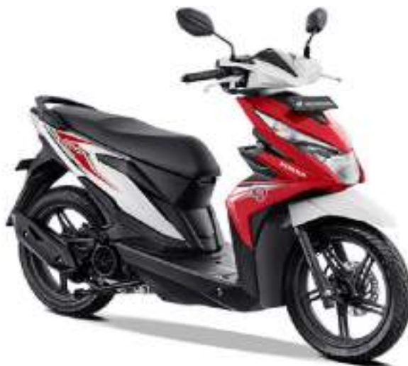
Beat Sporty CBS