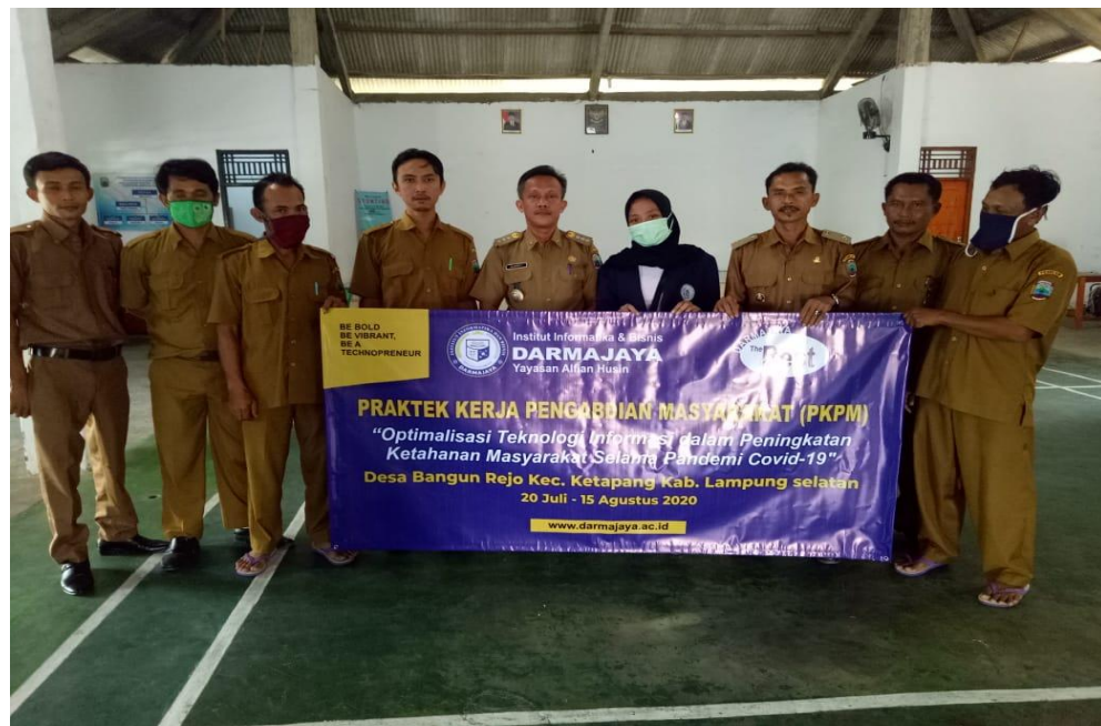
Gambar 9 : penyerahan banner kepada aparat desa