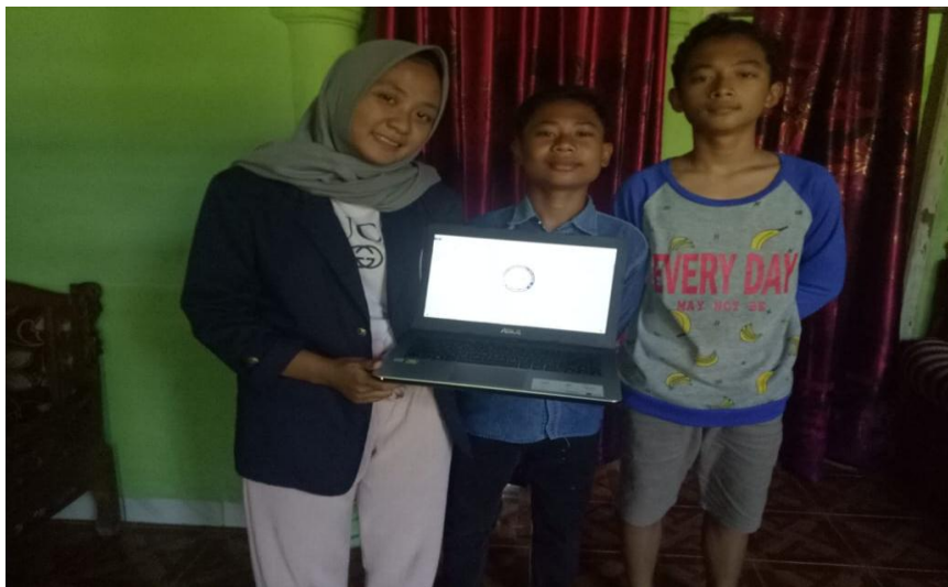
Gambar 8 : belajar membuat nama didalam ms.word