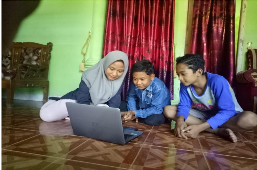
Gambar 7 : pendampingan belajar menggunakan ms.word