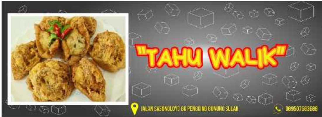
Gambar 6. desain produk

Mengenalkan dan mengajarkan tentang pembuatan desain produk