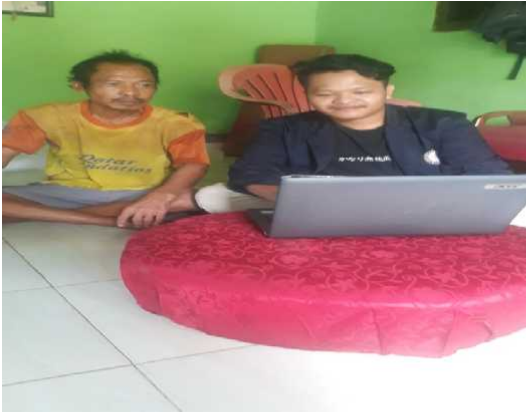
Gambar 4. sosialisasi COVID-19

Mensosialisasikan tentang pencegahan dan penularan virus corona