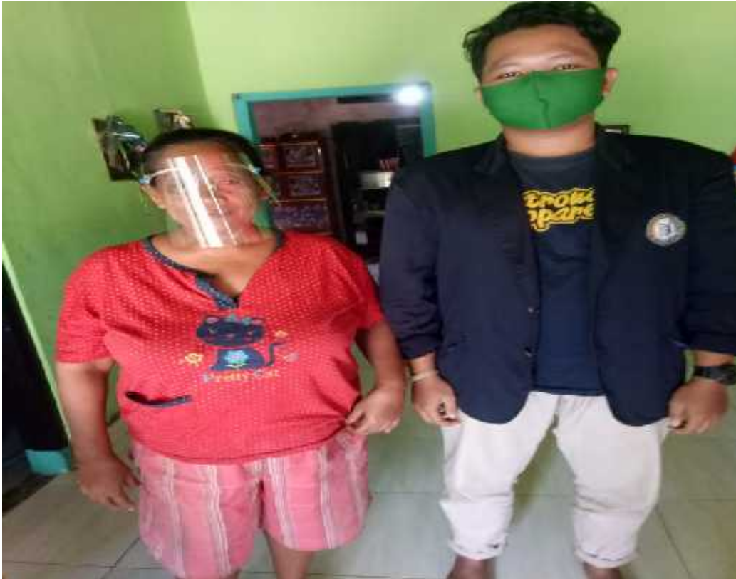
Gambar 8. membagikan face shield

Melakukan pogram darmajaya berbagi dengan membagikan face shield kepada masyarakat di sekitar UMKM