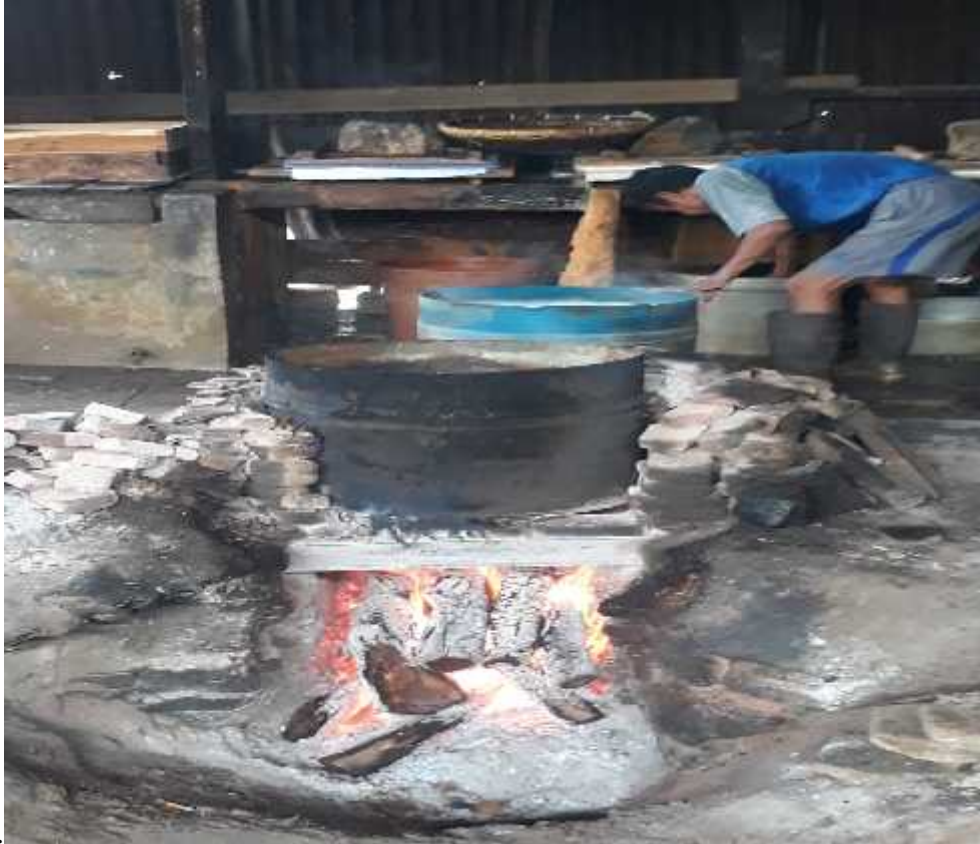
Gambar 2. survey lokasi

Melakukan suvey lokasi PKPM ke usaha mikro kecil dan menengah (UMKM) tahu