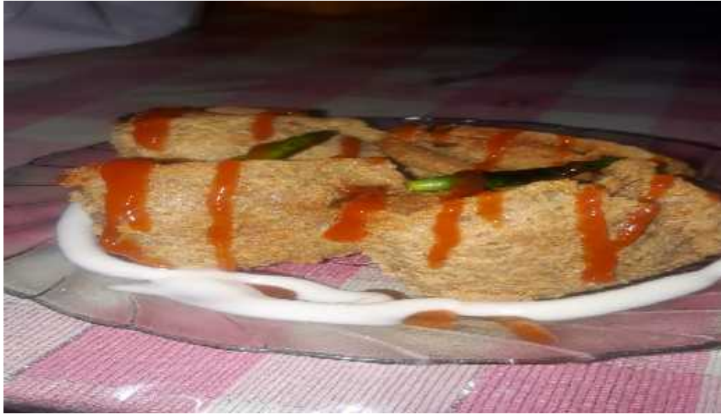
Gambar 7. tahu walik

Membuat varian produk dari tahu yaitu membuat tahu walik