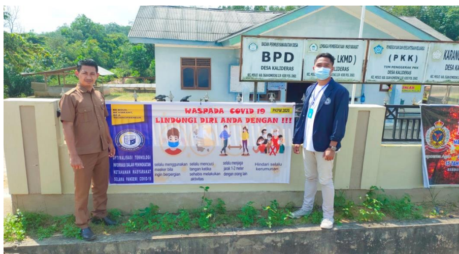
Gambar 2.6 Pemasangan Banner Pencegahan Covid-19

Pada tanggal 10 agustus 2020, saya melakukan sosialisasi melalui media cetak dengan cara memasang banner yang berisi cara-cara menghindari Covid-19 dengan baik dan benar seperti memakai masker, selalu mencuci tangan, jaga jarak dengan orang di sekitar, dan jangan berkumpul dengan orang lain.