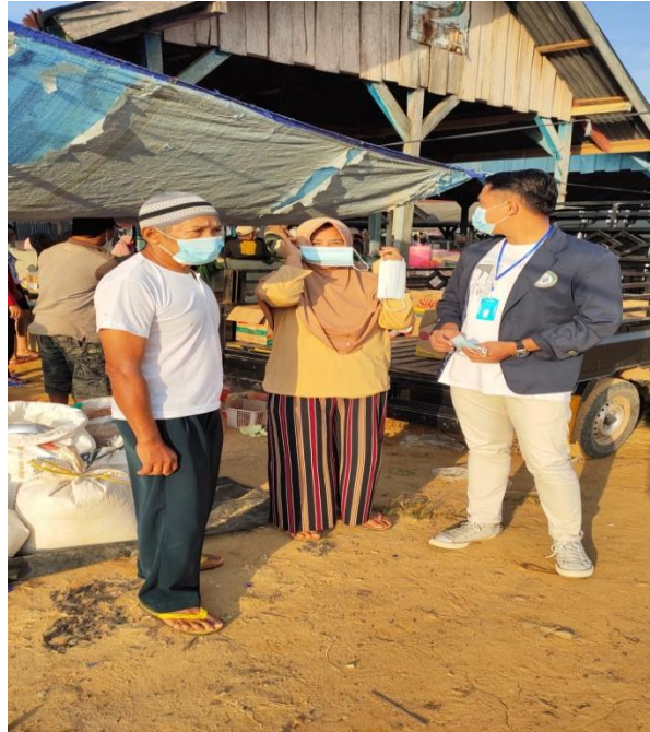
Gambar 2.4 Pembagian Masker di Pasar Desa Kali Deras

Pada tanggal 3 Agustus 2020, saya melakukan pembagian masker kepada masyarakat karena masih kurangnya kesadaran memakai masker, tujuan kami melakukan ini karna agar masyarakat sadar pentingnya memakai masker ketika berpergian keluar rumah dan agar selalu mematuhi protokol kesehatan yang sudah di anjurkan oleh pemerintah.