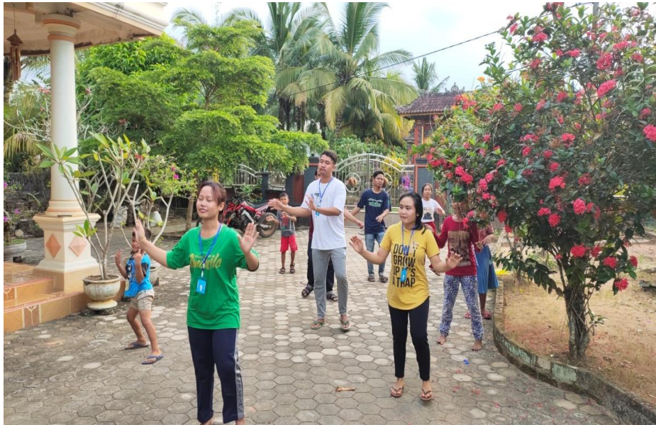
Gambar 2.7 Senam Sehat Bersama Anak-Anak SD

Pada tanggal 12 Agustus 2020, kami melakukan kegiatan senam bersama anak-anak agar kebugaran tubuh mereka tetap terjaga sehingga bisa terhindar dari Covid-19, kebugaran tubuh sangat dibutuhkan agar imunitas tetap terjaga. Kegiatan ini dilakukan dengan beberapa anak-anak karena mematuhi protokol kesehatan yang telah dianjurkan oleh pemerintah.