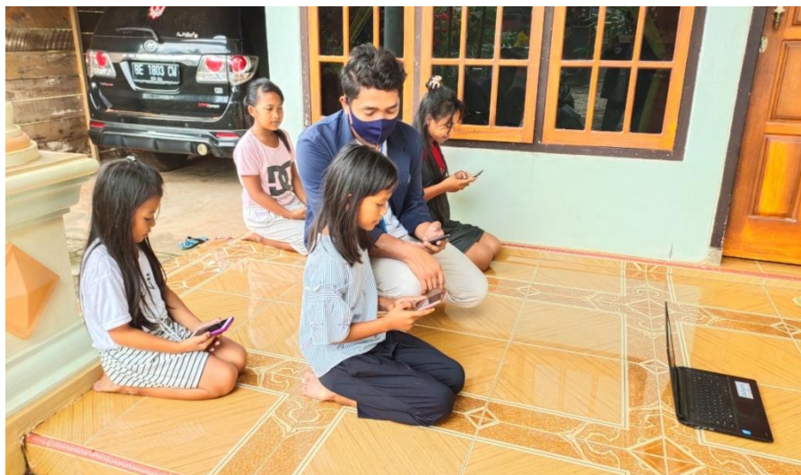
Gambar 2.1 Bimbingan Belajar Siswa Sekolah Dasar

Kegiatan ini bertujuan untuk memaksimalkan pembelajaran dan dapat memahami pembelajaran yang di berikan oleh guru. Dimana saat pandemi Covid-19 ini siswa tidak dapat bersekolah seperti biasanya sehingga siswa dituntut harus belajar daring (dalam jaringan). Oleh karena itu saya membantu siswa belajar agar mereka dapat sedikit memahami bagai mana cara melakukan pembelajaran secara efektif. Kegiatan ini saya laksanakan pada hari tanggal, 23 juli 2020, 28 juli 2020 dan tanggal 4 agustus 2020, kegiatan bimbingan belajar ini saya lakukan dengan beberapa karna mengikuti protokol kesehatan yang disarankan oleh pemerintah.