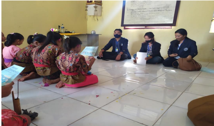
Gambar 2.2 Sosialisasi New Normal