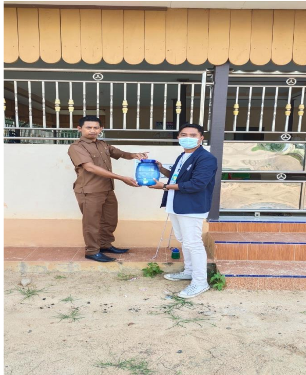
Gambar 2.5 Penyerahan dan Pemasangan Alat Cuci Tangan