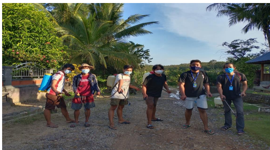
Gambar 2.3 Penyemprotan Disinfektan

Kegiatan ini kami lakukan pada tanggal 30 juli 2020, Covid-19 yang belum kunjung reda membuat kami mengajak masyarakat untuk melakukan penyemprotan di setiap rumah warga untuk mencegah penularan Covid-19. Disinfektan merupakan proses dekontaminasi yang menghilangkan atau membunuh segala hal terkait mikroorganisme (baik virus dan bakteri). Kami membuat cairan disinfektana dari beberapa campuran yaitu wipol, baycline, dan superpel.