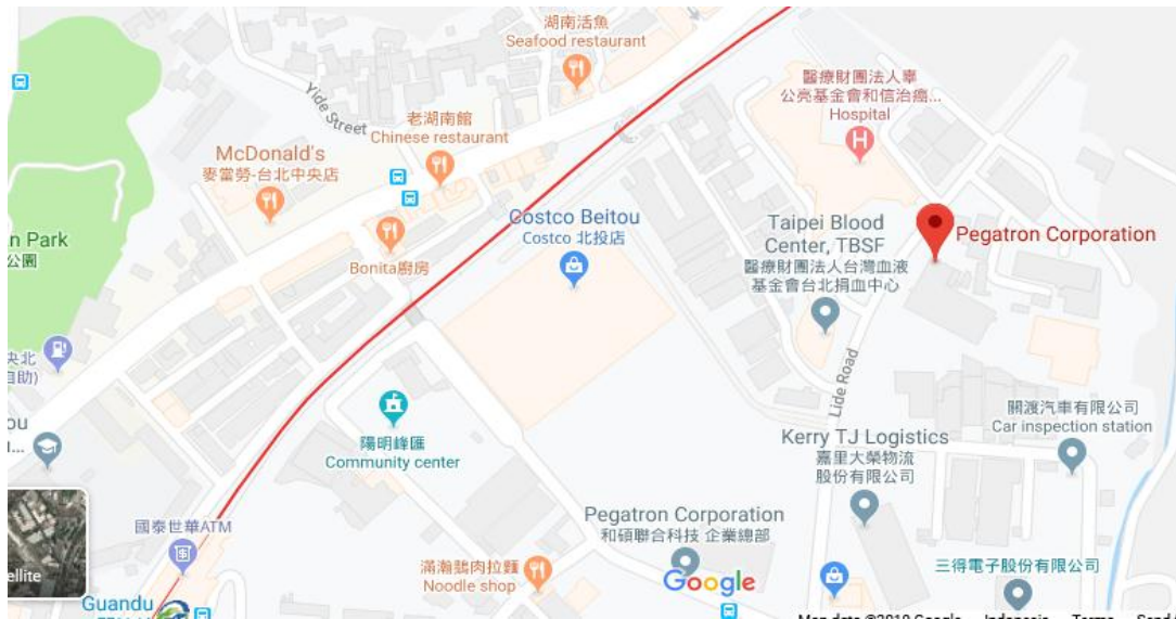
Gambar 2.1 Denah Lokasi Pegatron Corporation