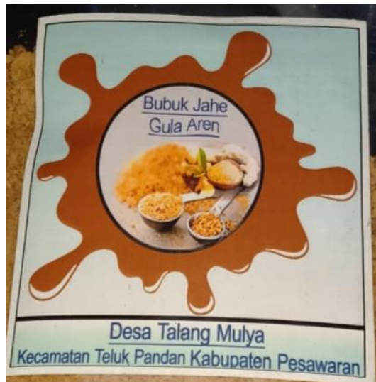
Gambar 2.3: Logo Bubuk Jahe Gula Aren