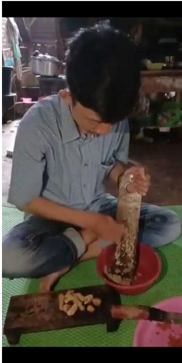
Gambar 2.5: Pembuatan Gula Aren Menjadi Bubuk