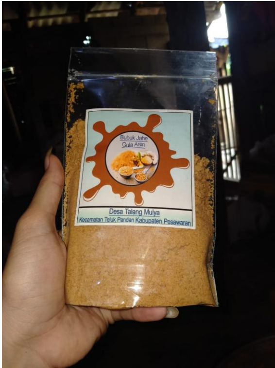
Gambar 2.2: Kemasan Bubuk Jahe Gula Aren