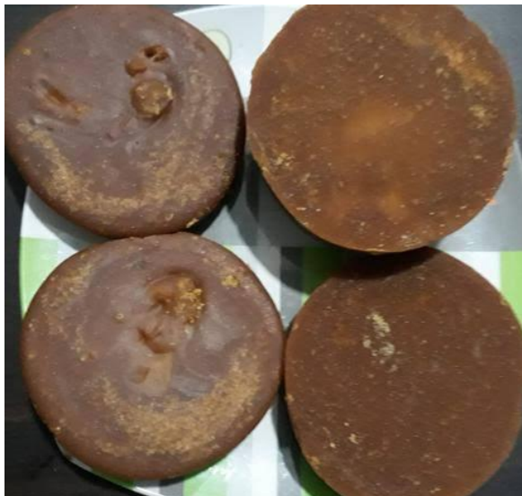
Gambar 2.1: Gula Aren Pertoros

Bukti foto bahwa telah mengikuti kegiatan selama PKPM