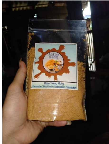
Gambar 2.2: Kemasan Bubuk Jahe Gula Aren