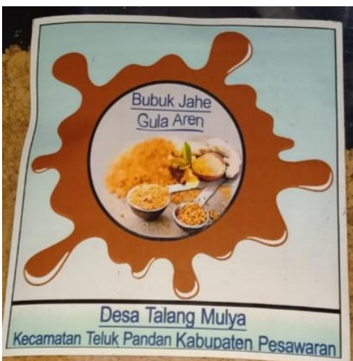
Gambar 2.3: Logo Bubuk Jahe Gula Aren