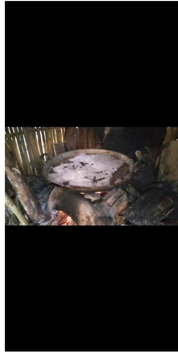
Gambar2.6: Proses Masak Gula Aren