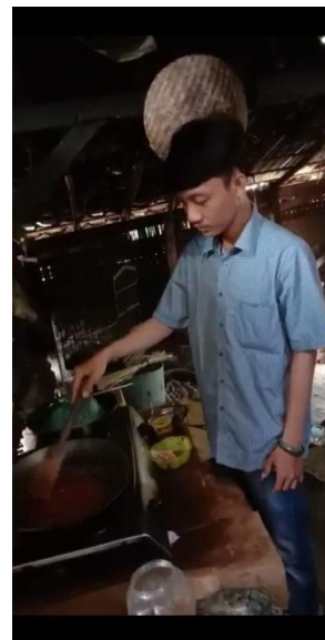
Gambar 2.4: Foto pembuatan Gula Aren