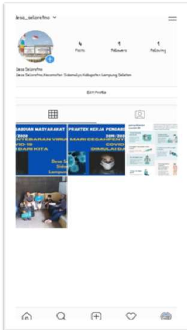
Gambar 2.7 Akun Instagram Desa Seloretno