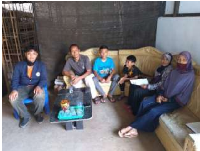
Gambar 2.6 foto Bersama warga sekitar

Setelah melakukan sosialisasi seputar covid-19 , saya juga menerapkan system new normal di desa Seloretno. Agar masyarakat dapat menghadapi pandemic covid-19 tanpa rasa takut