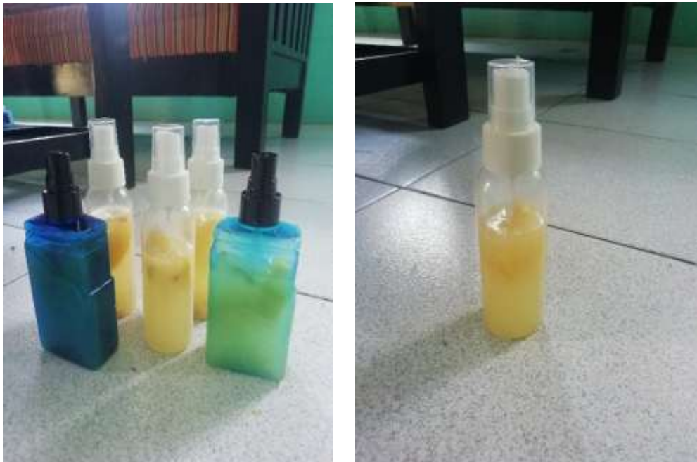
Gambar 2.9 Produk Hand Sanitizer Herbal

Dalam hal pencegahan penyebaran covid-19 di desa Seloretno, saya memilih untuk membuat Hand Sanitizer herbal. Alasan saya adalah produk Hand Sanitizer ini tidak mengandung alkohol. Dikarenakan harga banyak warga desa yang beranggapan alkohol berbahaya bagi tubuh. Hand sanitizer herbal ini hanya terdiri dari 2 macam bahan yaitu lemon dan air. Dengan perbandingan 70% air perasan lemon dan 30% air mineral. Hand sanitizer ini juga dapat dikreasikan seperti menambahkan potongan kulit lemon agar beraroma lebih harum. Ditujukan pada gambar 2.9