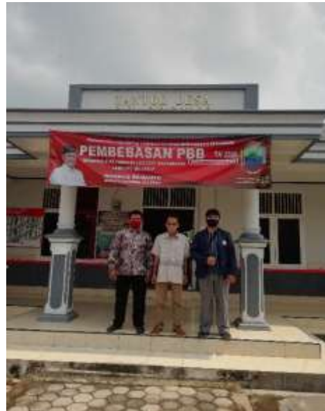
Gambar 2.3 Foto Bersama Lurah dan Kepala Dusun

Selama melakukan kegiatan PKPM, saya melibatkan beberapa mitra yaitu Lurah, Kepala Dusun, aparat keamanan desa dan warga sekitar guna membantu menyebarkan informasi seputar covid-19 kepada masyarakat desa.