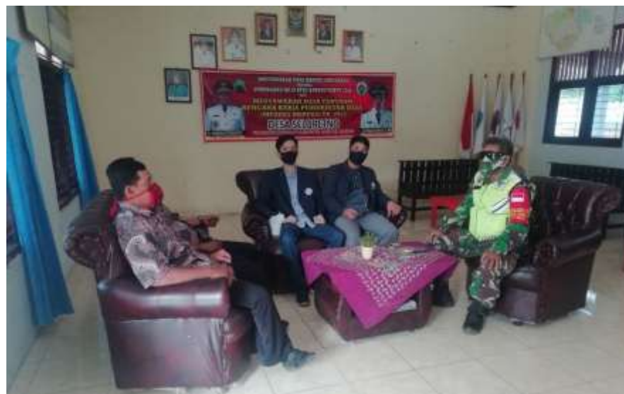
Gambar 2.4 foto Bersama aparat desa Seloretno