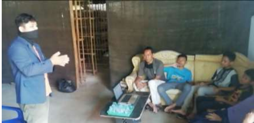
Gambar 2.5 edukasi kepada warga sekitar dan juga siswa desa Seloretno seputar Covid-19