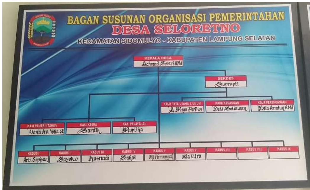
Gambar 2.2 Bagan susunan organisasi pemerintah desa Seloretno