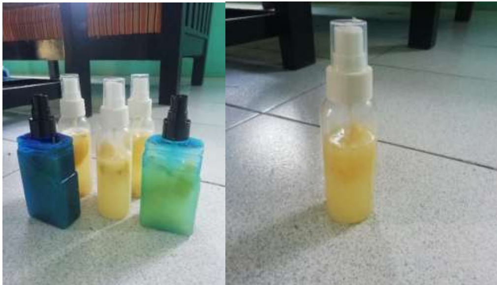
Produk Hand Sanitizer herbal