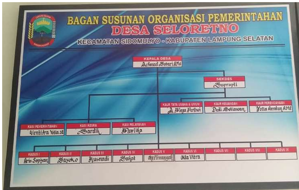
Struktur organisasi pemerintahan desa Seloretno