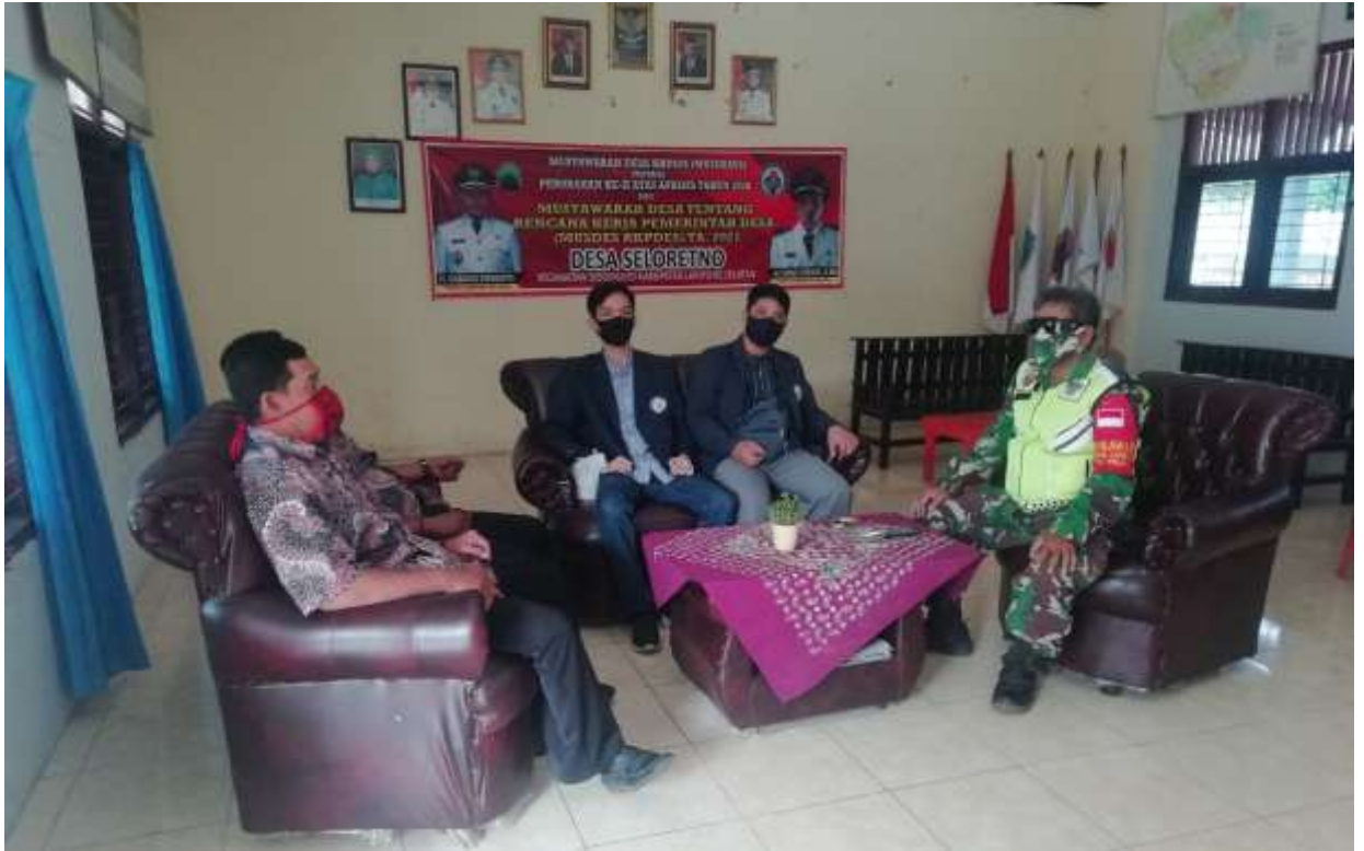
Foto bersama aparat desa