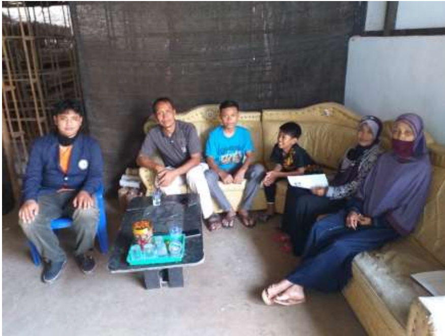
Foto bersama warga desa Seloretno