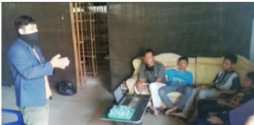
Sosialisasi dengan warga sekitar seputar covid-19