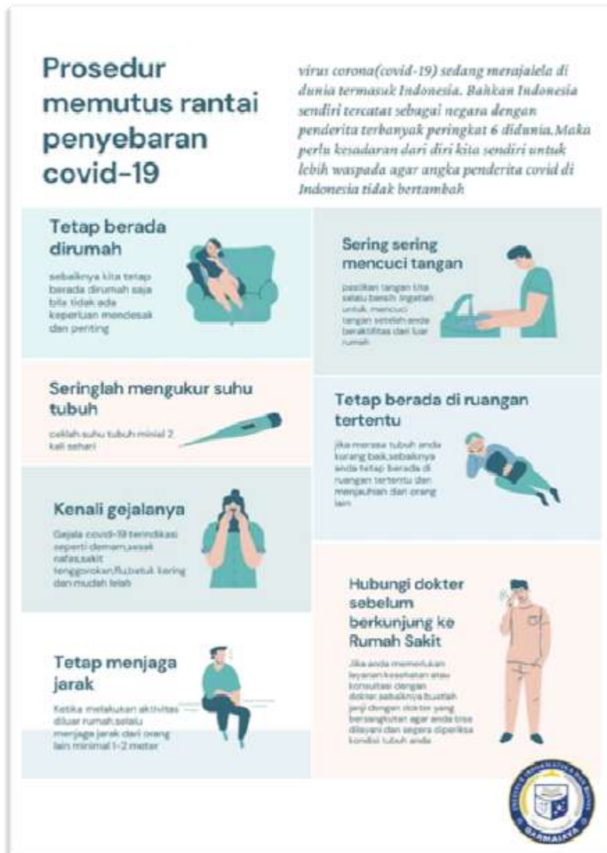
Contoh desain brosur seputar covid-19