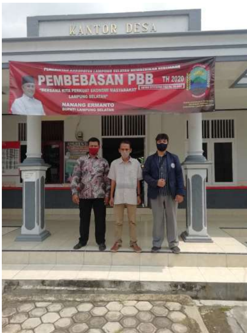
Foto bersama Lurah dan Ketua RW desa Seloretno