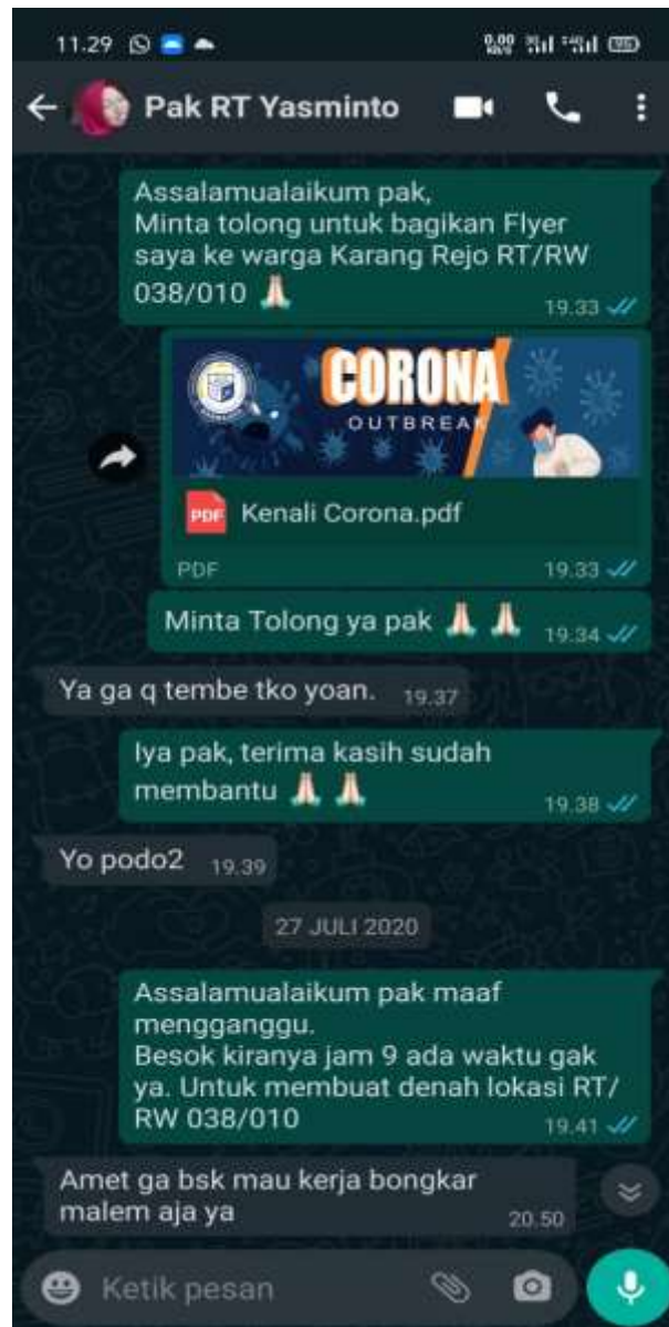
Bukti Pengiriman Flyer Untuk Dibagikan Ke Warga RT 038