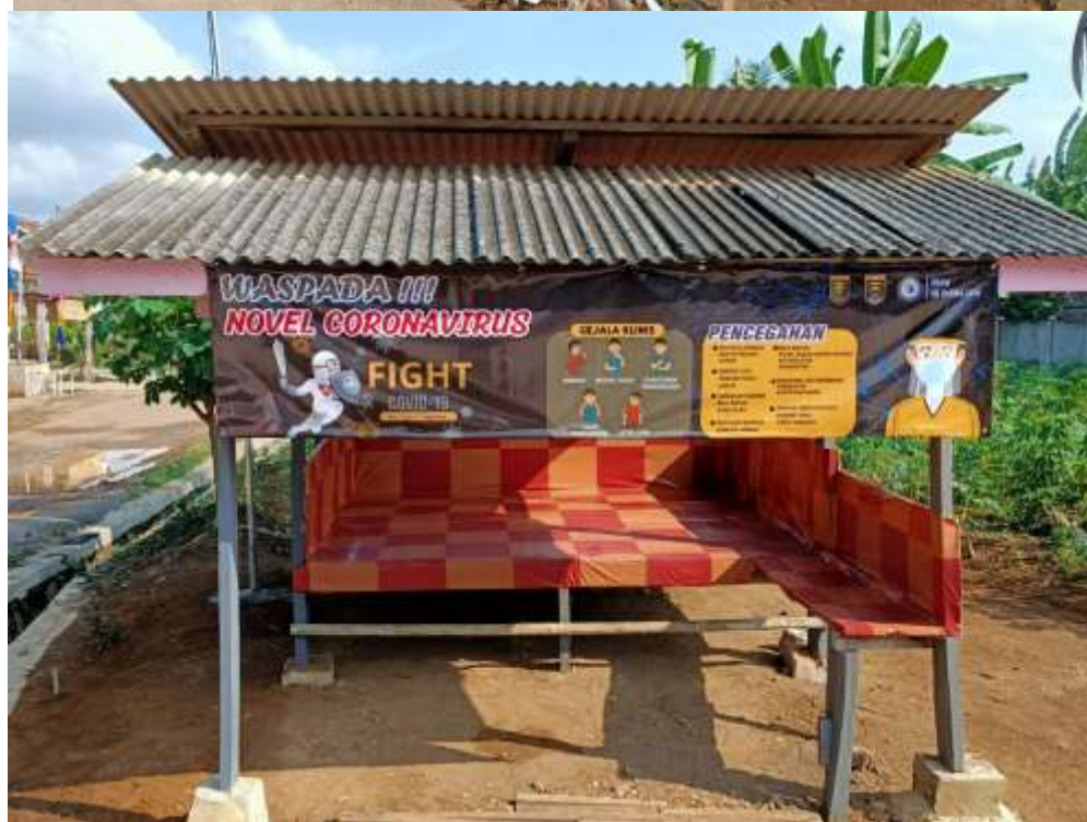
Hasil Kegiatan Kerja Bakti Membersihkan Lingkungan dan Memperbaiki Pos Ronda