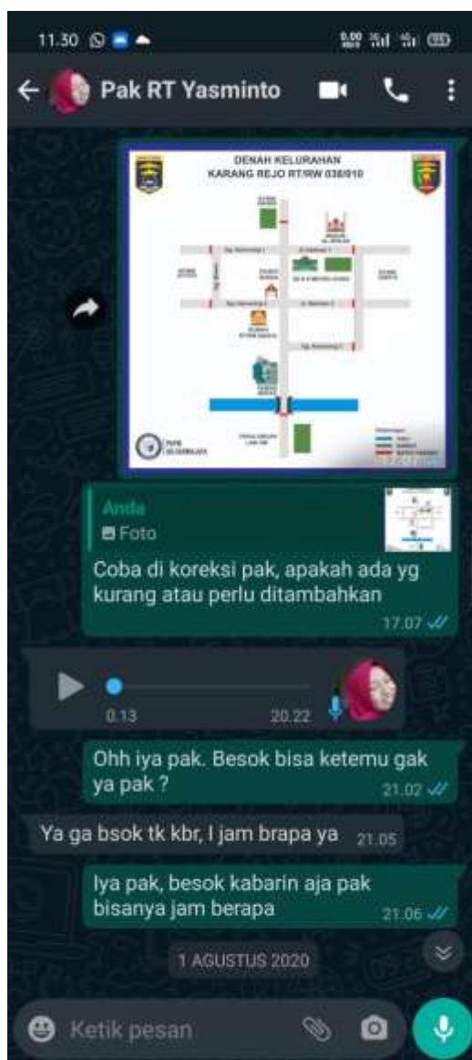
Pengiriman Desain Denah Desa Kepada Ketua RT Melalui Media Sosial