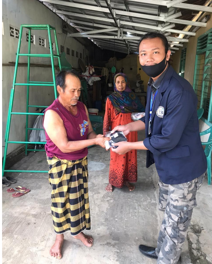
Gambar 2.3. Pembagian Masker dan Handsanitizer

diri setiap menjalankan kegiatan yang dianggap penting, serta menjauhi kerumunan atau bila perlu diam dirumah.