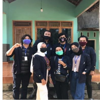
Foto Bersama Teman-Teman Dari UIN & IPB