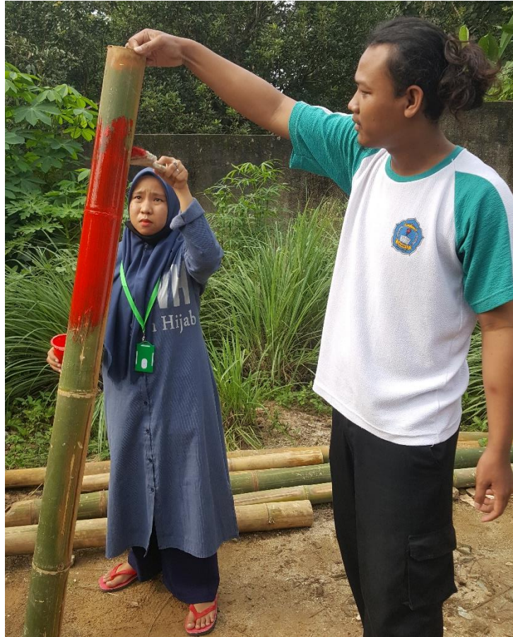
Gambar 2.2. Pembuatan Talang Air dari Bambu