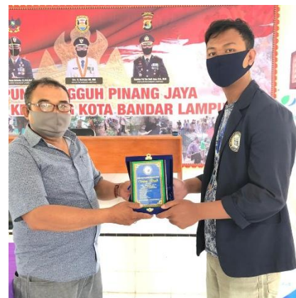
Pelepasan Mahasiswa PKPM