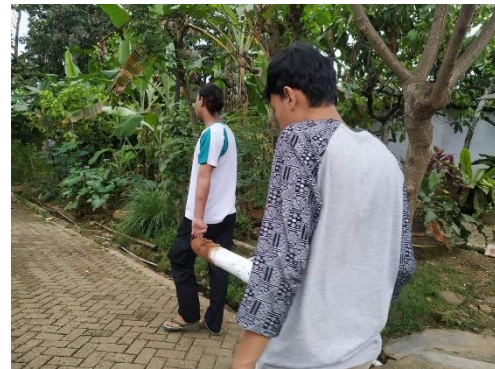
Pembuatan Dan Hasil Talang Air Dari Bambu