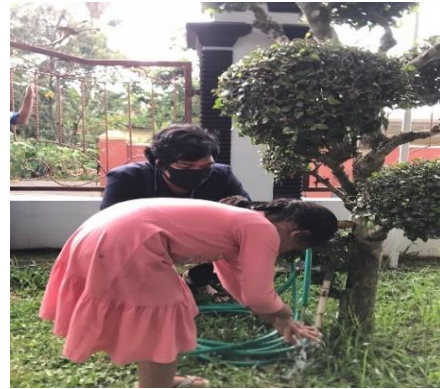
Sosialisasi Bersama Anak-Anak