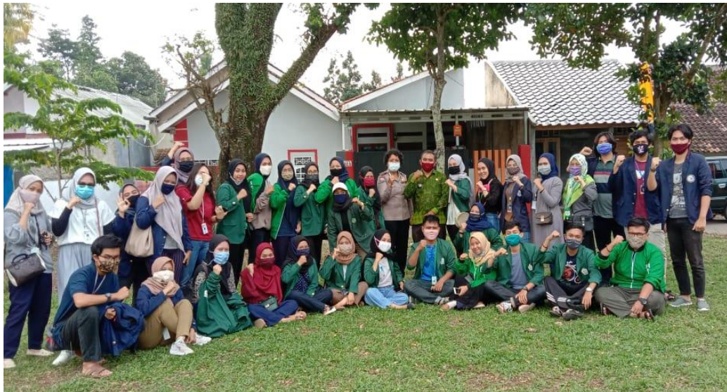
Foto Bersama Lurah dan Mahasiswa KKN