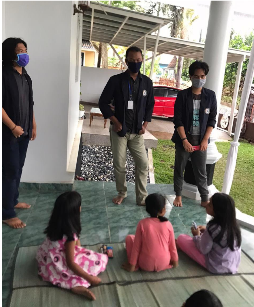
Gambar 2.5. Sosialisasi dan Edukasi kepada Anak-Anak