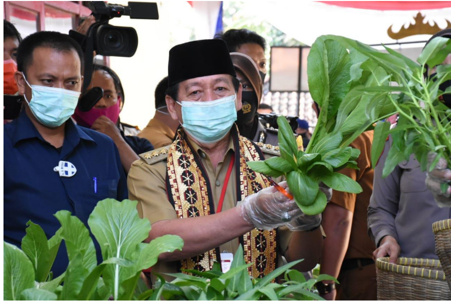
Gambar 2.1. Acara Kampung Tangguh