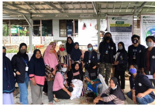
Kunjungan ke UMKM Batik Tulis Deandra