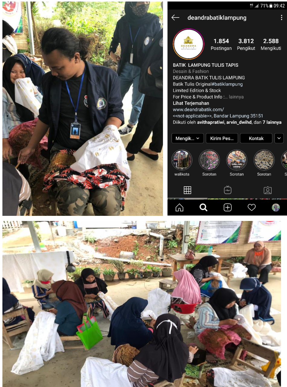
Gambar 2.6. Kunjungan ke UMKM dan Sosial Media UMKM