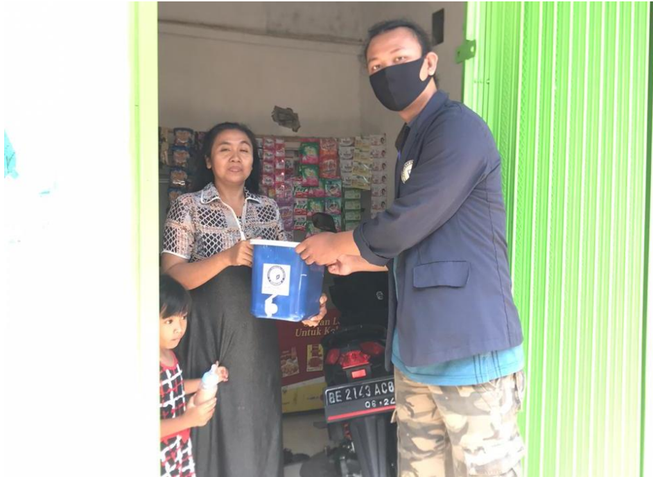
Gambar 2.4. Pembagian Tempat Cuci Tangan dari Ember