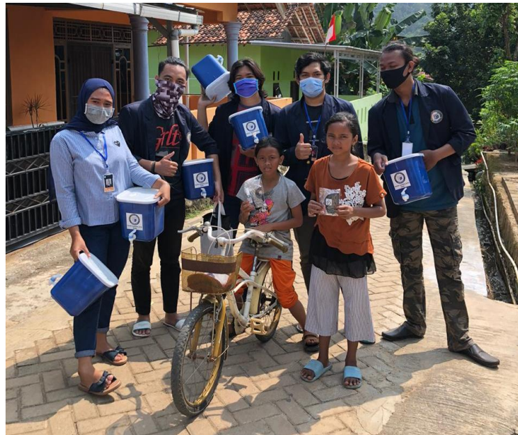
Pembagian Tempat Cuci Tangan Dari Ember